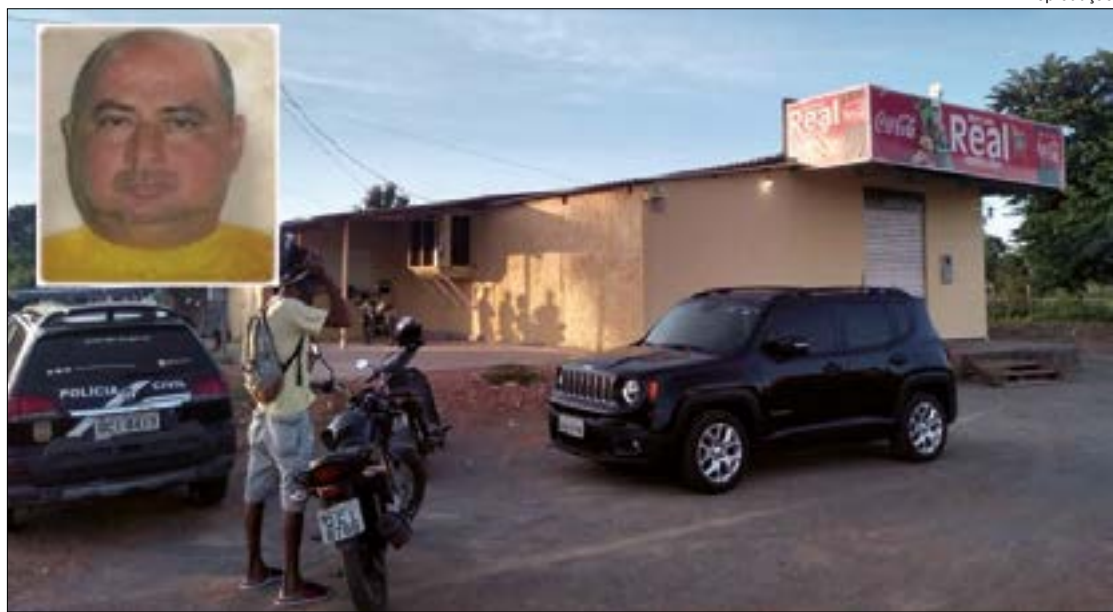
Carlinho tinha um comércio na cidade e foi encontrado pela esposa caído em frente ao portão da residência

Rosinei Neves, chefe da Divisão de Homicídios do município, acredita que o crime pode se tratar de um latrocínio, mas as investigações irão continuar para localizar os assassinos e descobrir a sua real motivação.