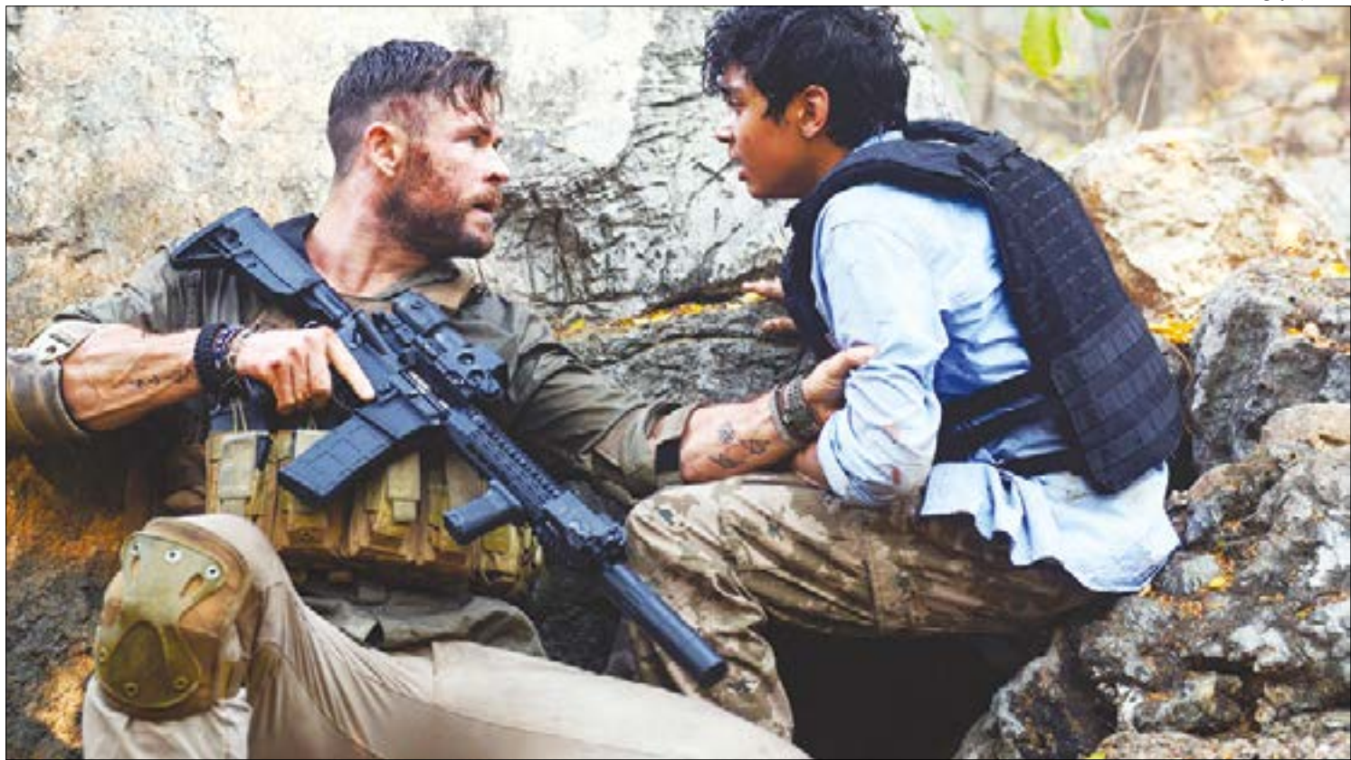
Filme produzido pelos 'reis de Hollywood' e estrelado pelo 'Thor' é ótima pedida para o final de semana

Logo no começo, Tyler salta de um penhasco e se isola no fundo da água. Já no fim, o garoto está na piscina, sobe no trampolim e também salta na água. Isola-se lá embaixo. O som do silêncio. As duas cenas como contraponto uma da outra? “Que bom que você notou. São cenas das quais estamos muito orgulhosos. O roteiro original já sinalizava para isso, mas não desse jeito. Foi uma criação conjunta, não sa-