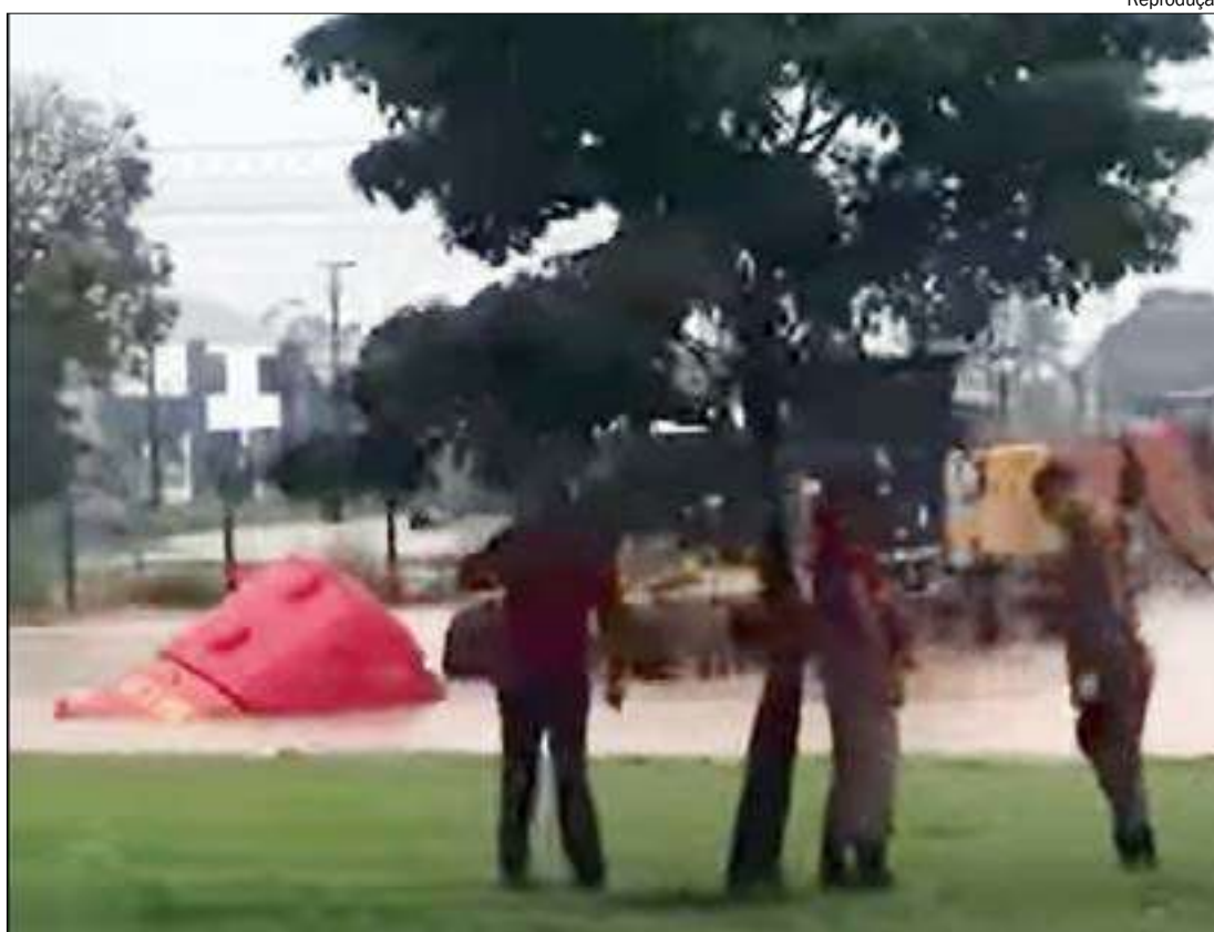
Viatura do Corpo de Bombeiros foi 'engolida' por cratera que se abriu com as chuvas em Sinop

Já na região Sul do estado, 24 mil residências ficaram sem energia elétrica na noite desta quarta-feira (16) por causa do temporal. A força da água fez ceder parte da sustentação de um dos quatro transformadores instalados na subestação Rondon Um. Foram impactados pelo incidente os municípios de Guiratinga, Pedra Preta, São José