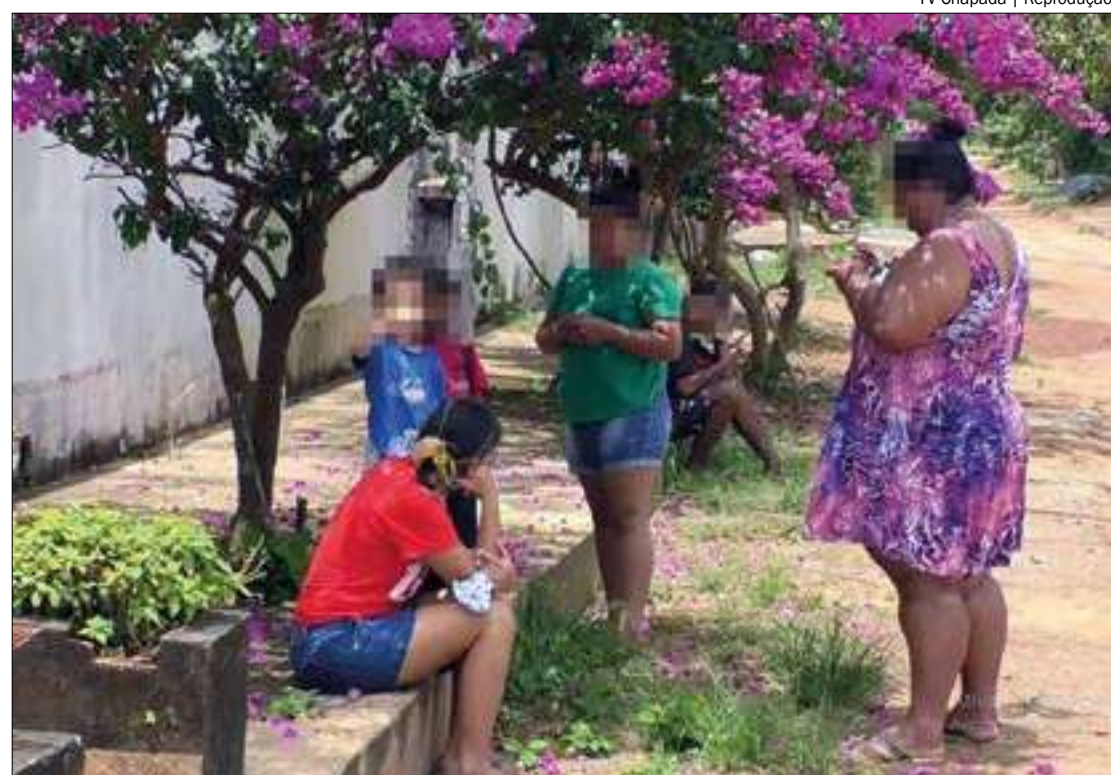
Populares pediram autorização para construir abrigo de ônibus, mas a Prefeitura de Chapada não deu aval

Enquanto isso, as mães e pais de alunos temem que seus filhos peguem um resfriado ou sofram com o sol escaldante. Eles cogitam até mesmo 'colocar a mão na massa' e construir o ponto de ônibus para garantir mais conforto para os filhos. "Se a prefeitura entrar em acordo, trazer os materiais, nós pais fazemos, porque é para os nossos filhos", disse uma mãe.