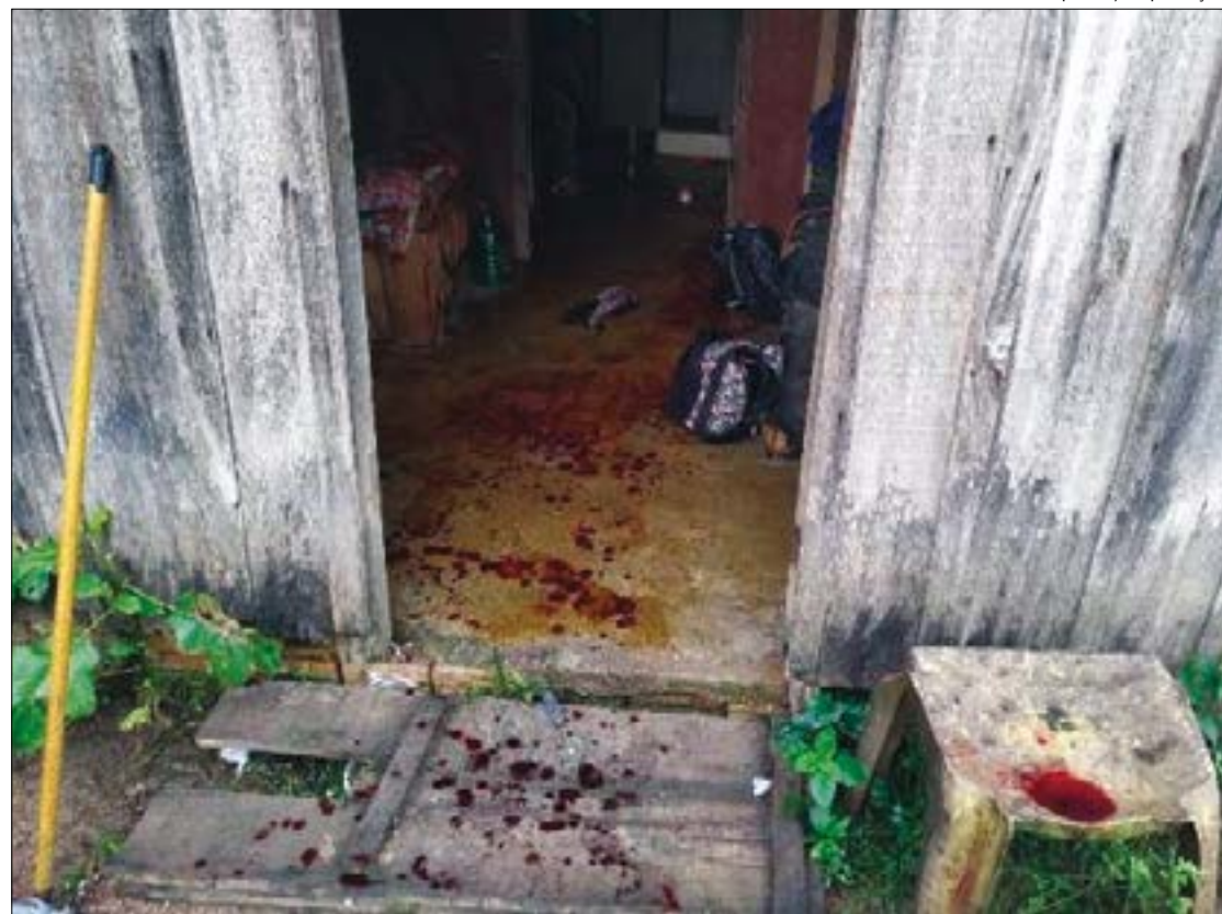
A mulher sofreu vários golpes de facão na cabeça, nos braços e nas mãos