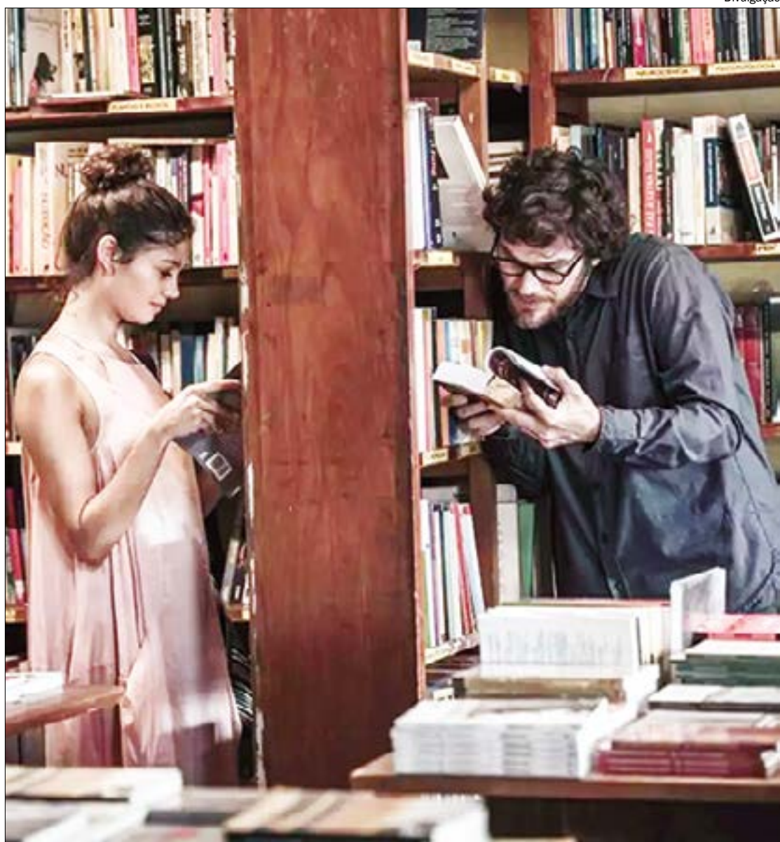
‘Todas as Mulheres do Mundo’ é um chamado para reviver os momentos de romance em casal

Como ator, Matheus tem tido grandes parcerias, e a maior de todas é com Cláudio Assis. Como é ser dirigido por uma mulher? “A maioria dos diretores, quando escolhe o ator, acha que já está tudo pronto. Entrega pra gente. A Patrícia, não. Ela é muito focada. Ouve a gente, mas tem o conceito dela e não abre mão.” Patrícia talvez seja a única que, trabalhando com um ator tão bom, tão grande como Matheus, não se vexa de interromper a cena e corrigi-lo, se for necessário. Ele aprova: “Ôxe, pois se ela tem a coisa na cabeça e é para melhorar a cena, como não vou gostar?”.