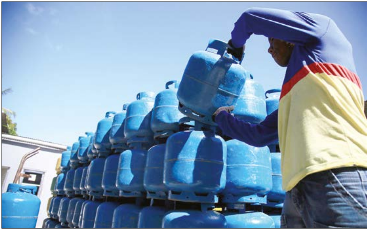
Brasil já está tendo que importar gás de cozinha devido à crise do petróleo

A queda na produção nacional não deverá refletir em aumento de preços para os consumidores. Além disso, não há risco