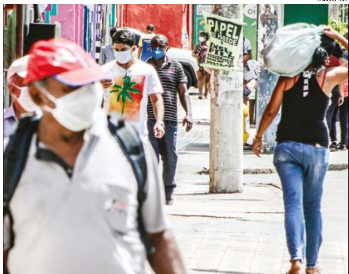
Segundo o TST, corte de salário e jornada pode acontecer se respeitar salário-hora

Forno: Dependendo do alimento, é possível preparar mais de um prato que vai ao forno. Procure saber o tempo médio de cozimento de cada um e evite abrir várias vezes o forno.