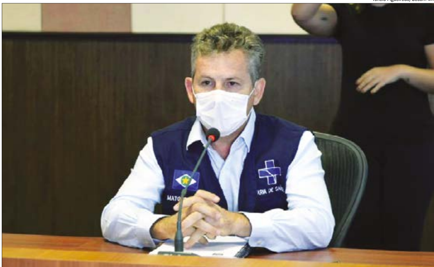
Governador destaca que apenas 2,88% dos leitos estão ocupados e orienta para volta das atividades produtivas

A liberação para o retorno às atividades vem acompanhada de um novo protocolo para comportamento em espaços públicos. A orientação é para que a população continue usando máscaras para circulação ou para entrar