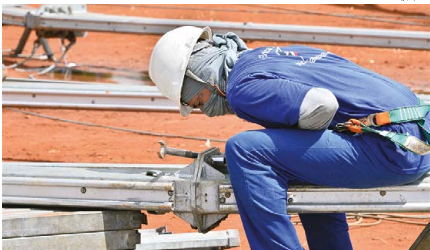
Plano do governo prevê R$ 300 bi para acelerar o desenvolvimento, mas a maior parte precisa sair da iniciativa privada

Assessores do ministro minimizaram o problema afirmando que os valores não estão fechados e serão ainda definidos “dentro do espaço fiscal” das despesas discricionárias, aquelas não obrigatórias que o governo pode administrar.