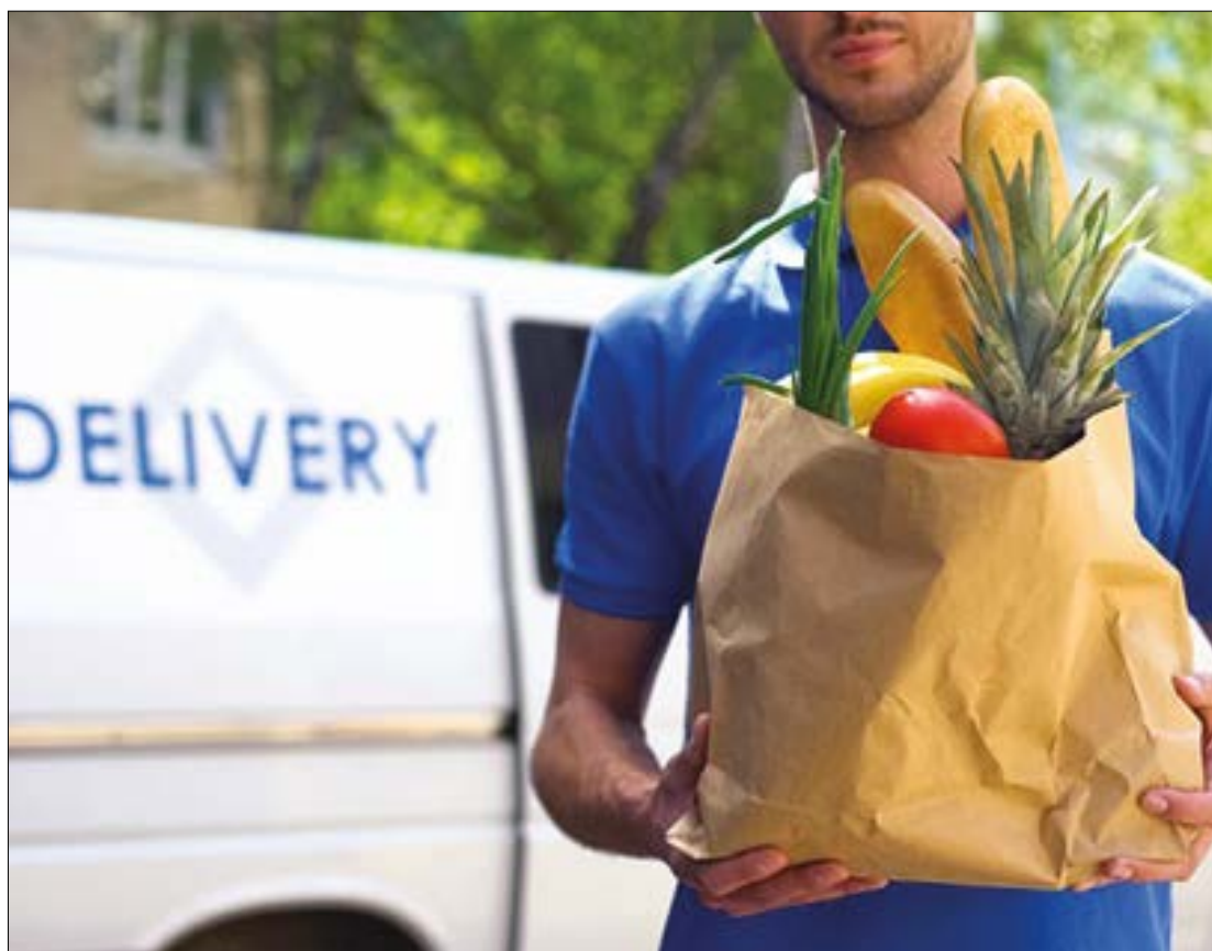
Empresas entregam desde remédios até hortifrúti na porta da sua casa

as 7h30 e 17h30. Entrega é grátis para pedidos acima de R$ 50. Abaixo desse valor será cobrada taxa de R$ 5.