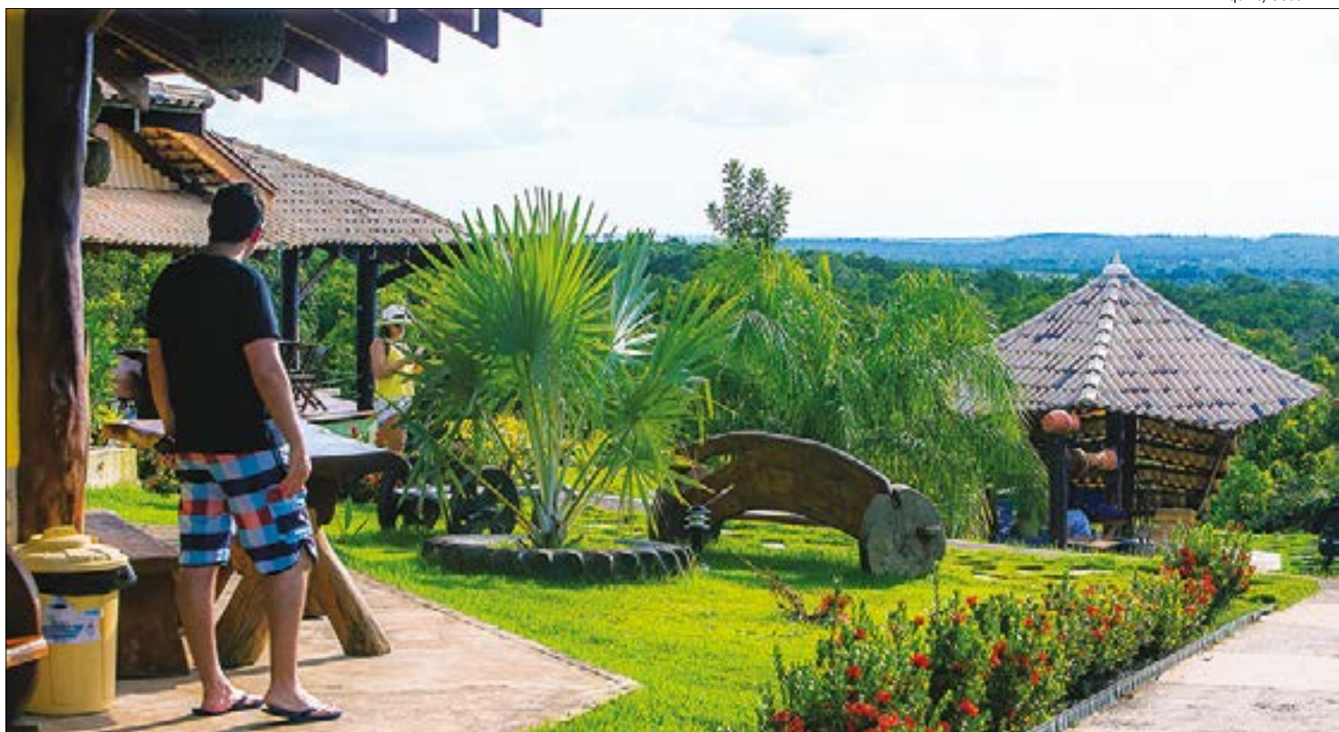
Turismo foi um dos setores mais impactados pela pandemia, com a demanda caindo quase a zero

Alguns dos novos segmentos também serão incluídos nas atividades já selecionadas previamente de forma a tornar o processo mais simples, explica uma fonte. A cadeia têxtil, assim como bares e restaurantes, por exemplo, deve ser alocada no setor de varejo não alimentício, coordenado pelo BNDES ao lado do Santander. "Nesses segmentos não há um consolidador. É muito pulverizado além das grandes empresas.