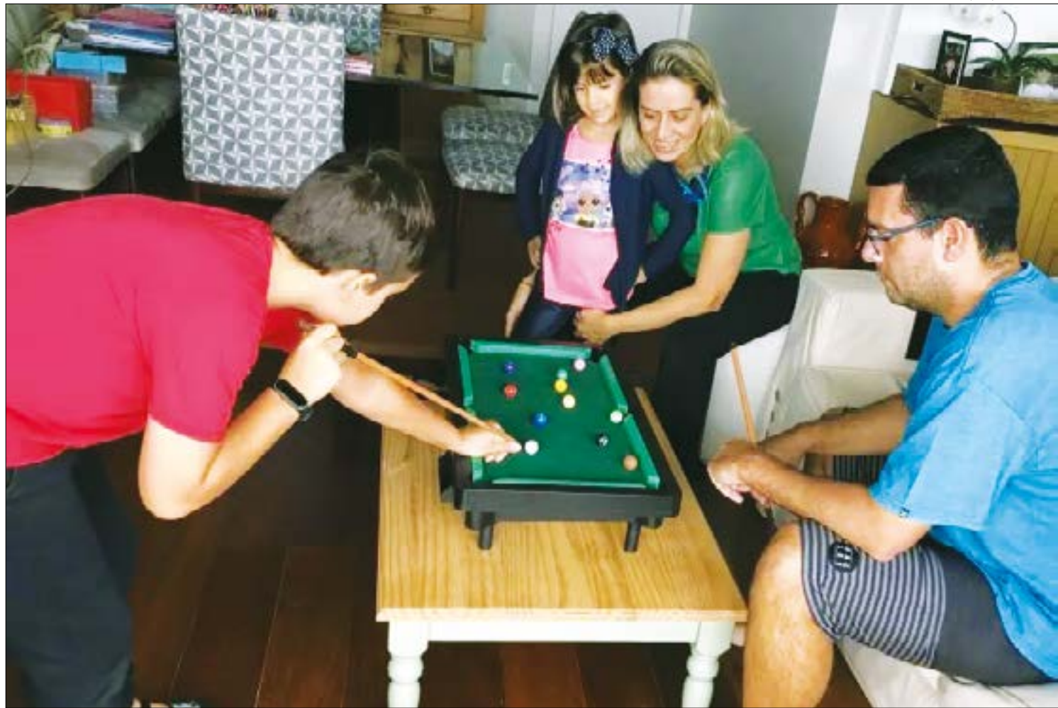
A escolha da brincadeira varia conforme a idade, mas o ideal é que envolva toda a família