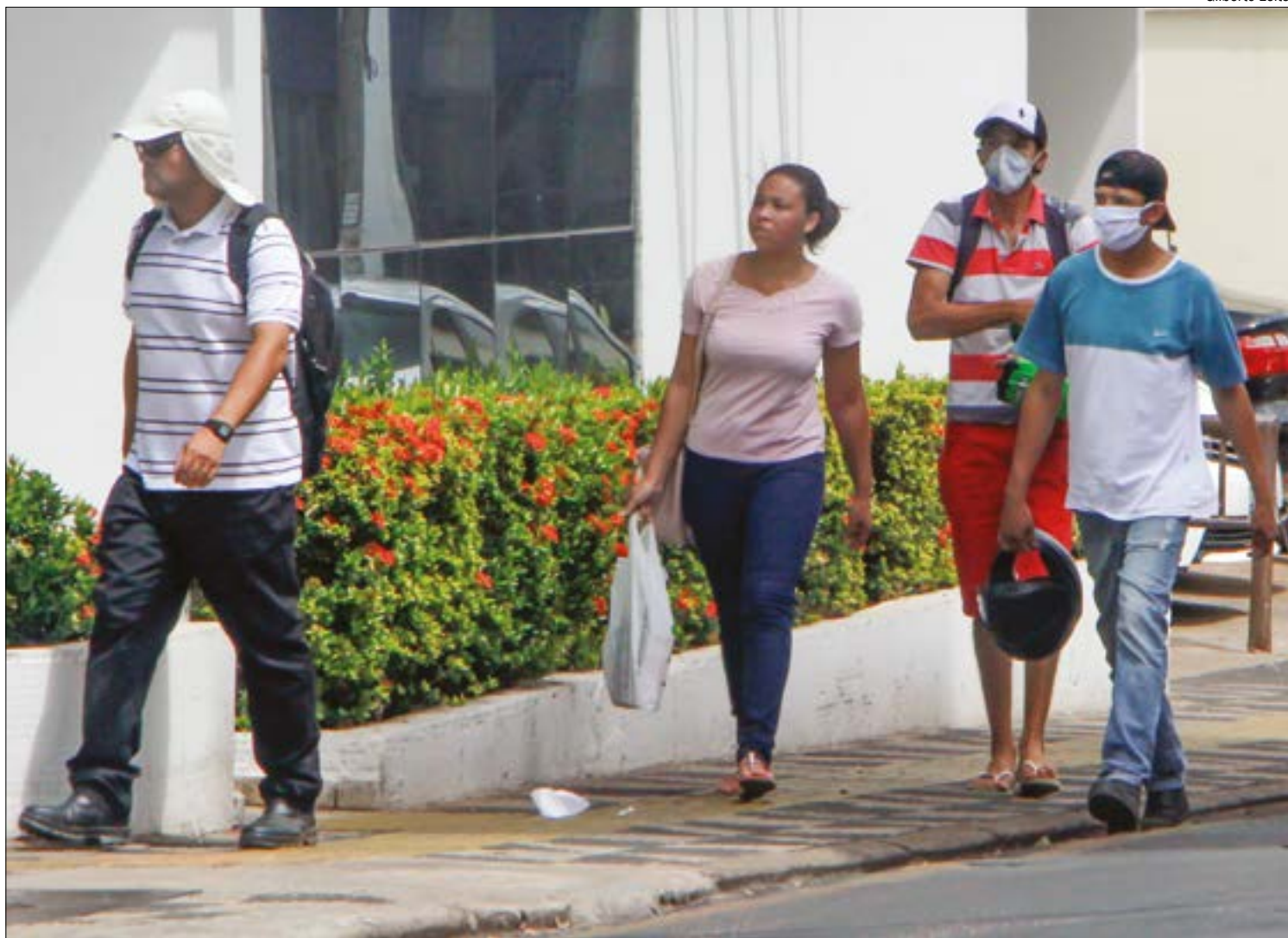
Comércio aposta no Dia das Mães para reaver as perdas com o isolamento social