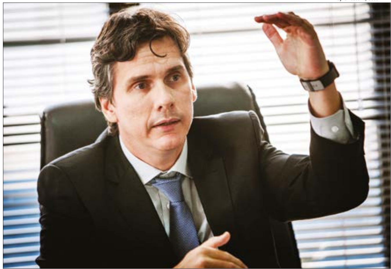
Gallo explica que cortes serão 'lineares', mas não devem atingir Saúde, Segurança e Assistência Social

O mesmo não pode ser garantido para o mês de junho, já que o Estado ainda não sabe como será a arrecadação no próximo mês.