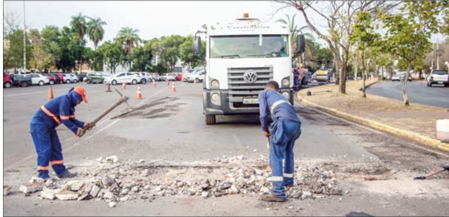
Concessionária é criticada por não recompor asfalto com a mesma qualidade após fazer obras na rede de água e esgoto