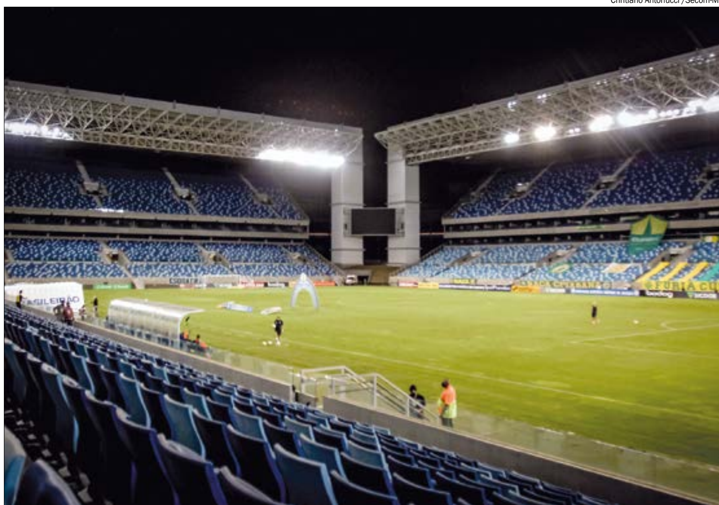
Arena Pantanal poderá receber até 80% da capacidade, mas só vacinados poderão assistir ao jogo

"A CBF, antes de disponibilizar os ingressos, precisava saber a capacidade estipulada. Como o decreto foi publicado nesta segunda-feira (14.02, às 18h), a informação de venda de ingressos deve ser publicada logo em breve. Mas reforço que venda de ingressos não