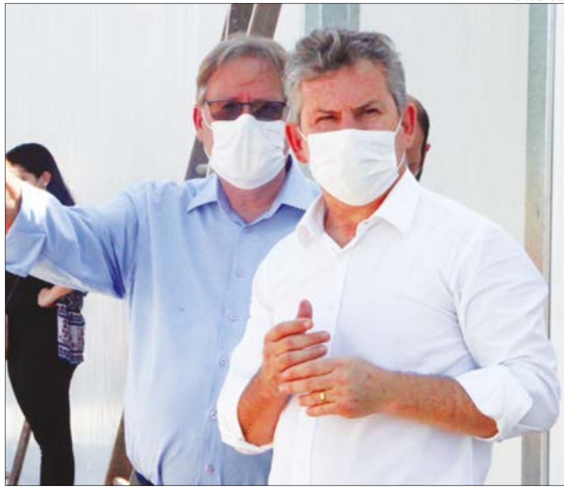
Gilberto Figueiredo vistoria obra de ampliação do Hospital Metropolitano junto com o governador Mauro Mendes

“Precisávamos adquirir condições estruturais com os leitos disponíveis, precisávamos de recursos humanos, EPIS para os