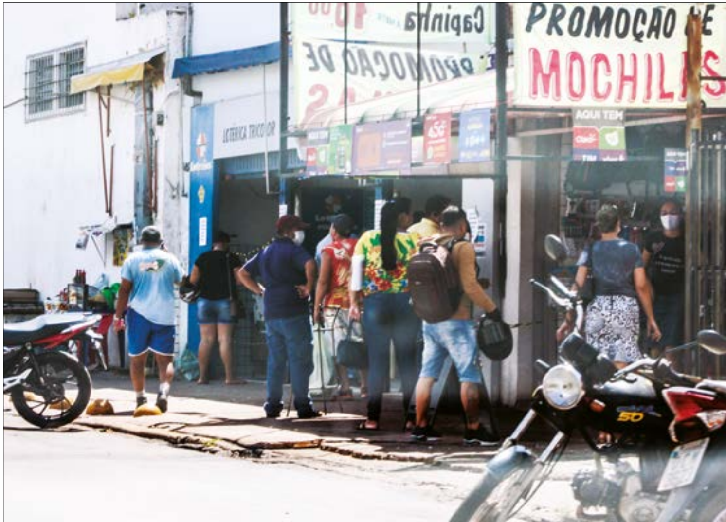
Manual traz orientações para o comércio mato-grossense diante da pandemia

O Manual de Orientação traz medidas trabalhistas, como as Medidas Provisórias nº 927/20 e nº 936/20, que flexibilizam questões trabalhistas e que poderão ser adotadas durante o estado de calamidade pública, como a redução proporcional de jornada de trabalho e de salário, a suspensão temporária do contrato de trabalho.