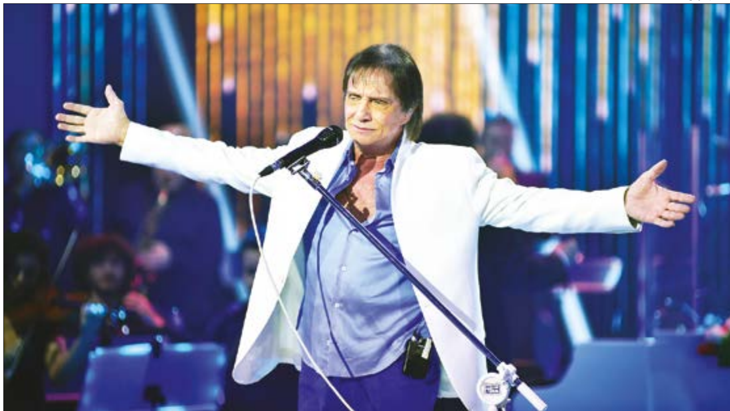
Show de Roberto Carlos terá 45 minutos de duração e começará no final do 'Domingão do Faustão'

O cantor Roberto Carlos irá comemorar seu aniversário de 79 anos neste domingo (19) com uma live, realizada de sua casa, no bairro da Urca, Rio de Janeiro. No repertório estão os principais sucessos de sua carreira. Parte do show será transmitida ao vivo pela Globo durante o programa 'Domingão do Faustão'. Em seguida, a atração vai para o Globoplay, a partir das 19h45.