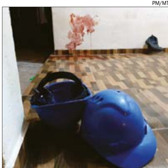
O local era alugado por cinco homens que prestava serviço em uma indústria e foram atacados durante a madrugada

A Polícia Civil instaurou um inquérito para apurar o triplo homicídio. A vítima que conseguiu fugir será fundamental nas investigações para auxiliar a polícia na elucidação do caso. As identidades das vítimas não foram reveladas.