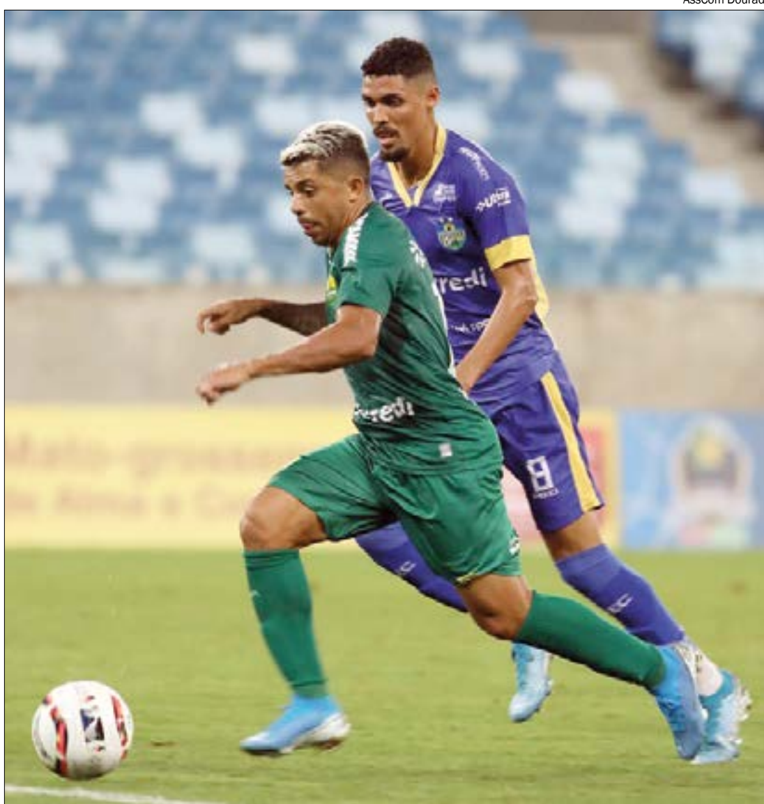
Vitória apertada do Dourado não empolgou a torcida, que cobra mais do único clube de Série A no Estadual

Ficar entre os dois primeiros é importante porque dá aos clubes um