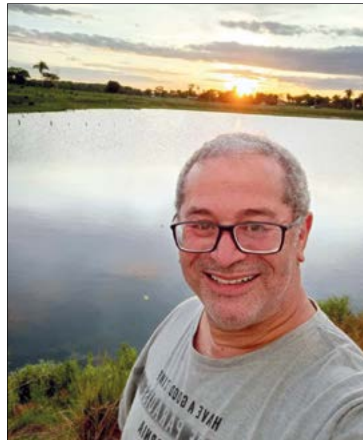
O famoso Pacheco hair designer das celebridades, em Cáceres, está organizado no próximo dia 13 de fevereiro "Peixe VIP" com várias atrações. Já confirmamos presença