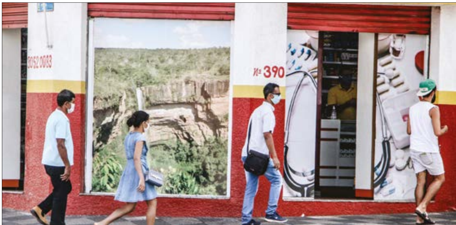
Relação de confiança entre clientes e empresa terá um peso maior na sobrevivência dos negócios após a pandemia

“É fundamental essa relação de confiança, para que ele possa manter a sua clientela, fazer a empresa girar, tomar medidas de contingência, para manter a sua operação. O trabalho de proximidade com o cliente, de saber como ele é, onde ele está, é essencial. O cliente vai valorizar as marcas em que ele já tem essa percepção, de confiança e de credibilidade”, alerta Schelini.