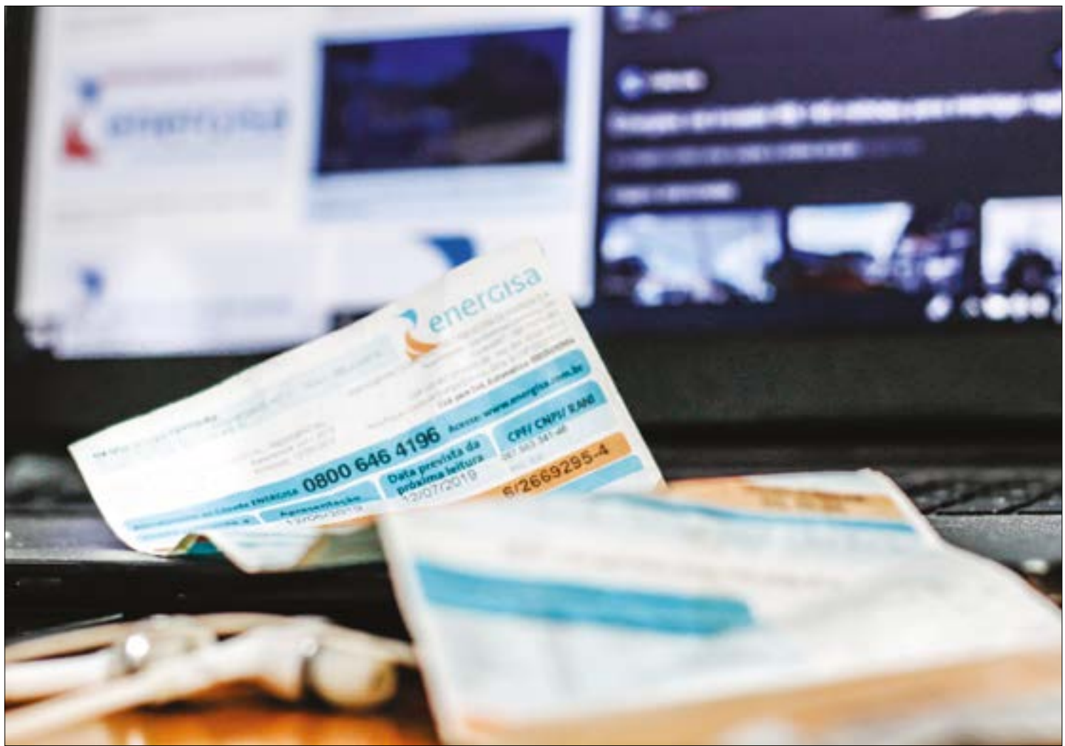
Empréstimo para cobrir despesas do setor elétrico deve passar de R$ 17 bilhões e causar 'nova pressão' na conta de luz

A exemplo do empréstimo anterior, o empréstimo também será repassado às contas de luz dos consumidores e será pago por meio de um encargo tarifário.