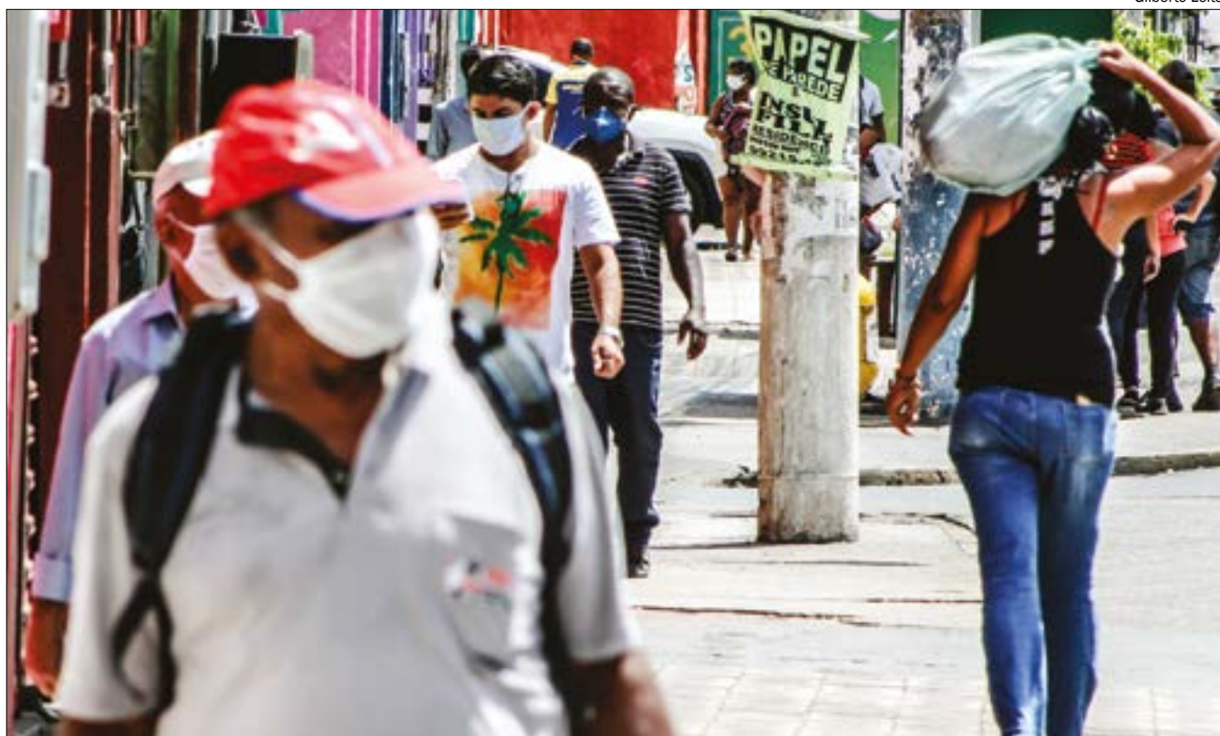
Desembargador destacou que uso de máscaras não é suficiente para evitar infecções