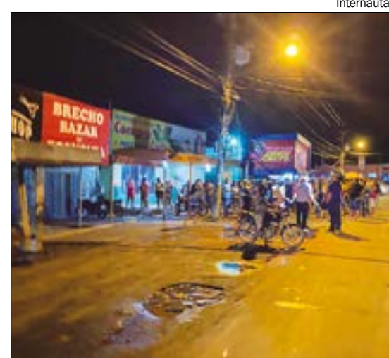
Moradores realizaram uma manifestação para cobrar asfalto no bairro

Porém, 45 minutos depois, os policiais voltaram a pedir para que as pessoas saíssem do local, momento em que foram hostilizados pelos manifestantes, mesmo alegando o perigo de contaminação pelo novo coronavírus,