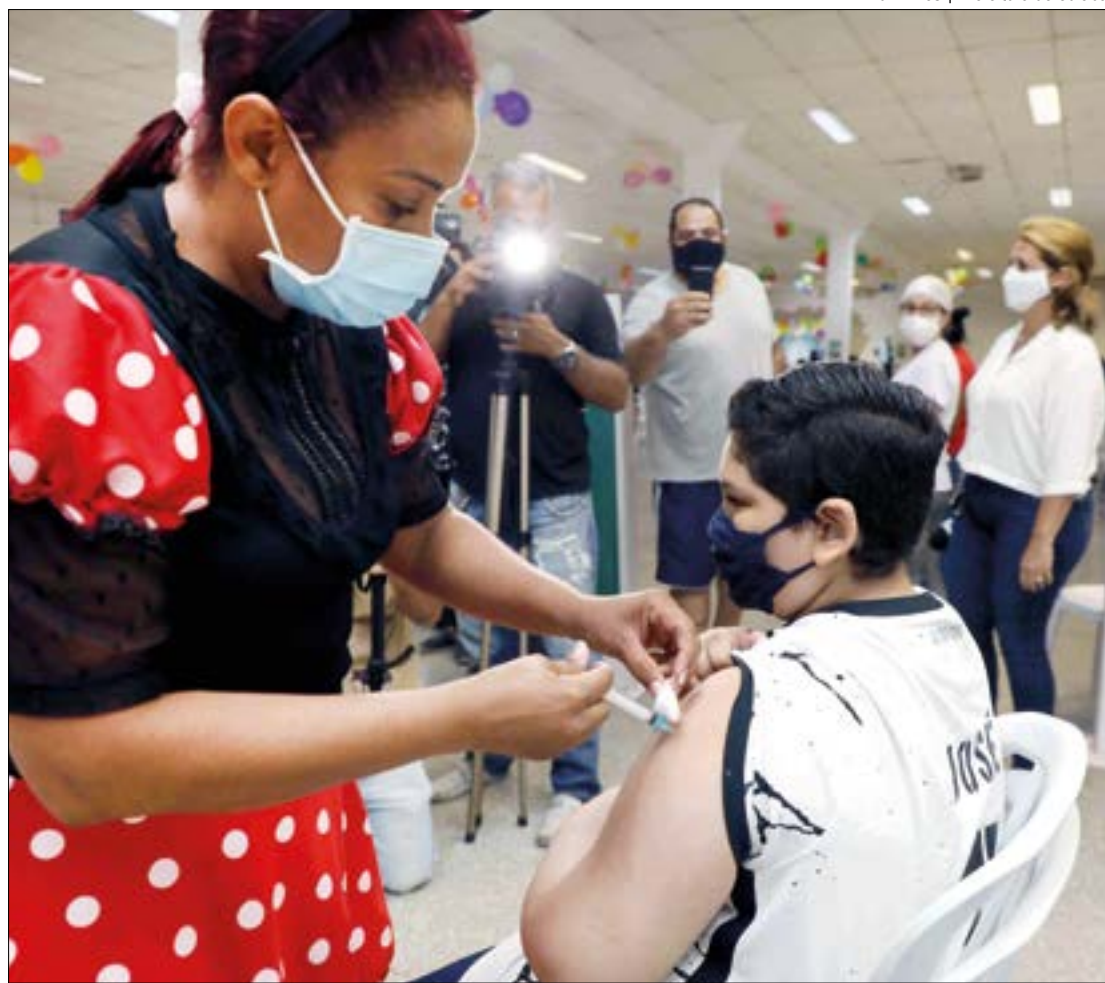
Polos exclusivos foram criados para vacinar o público em Cuiabá