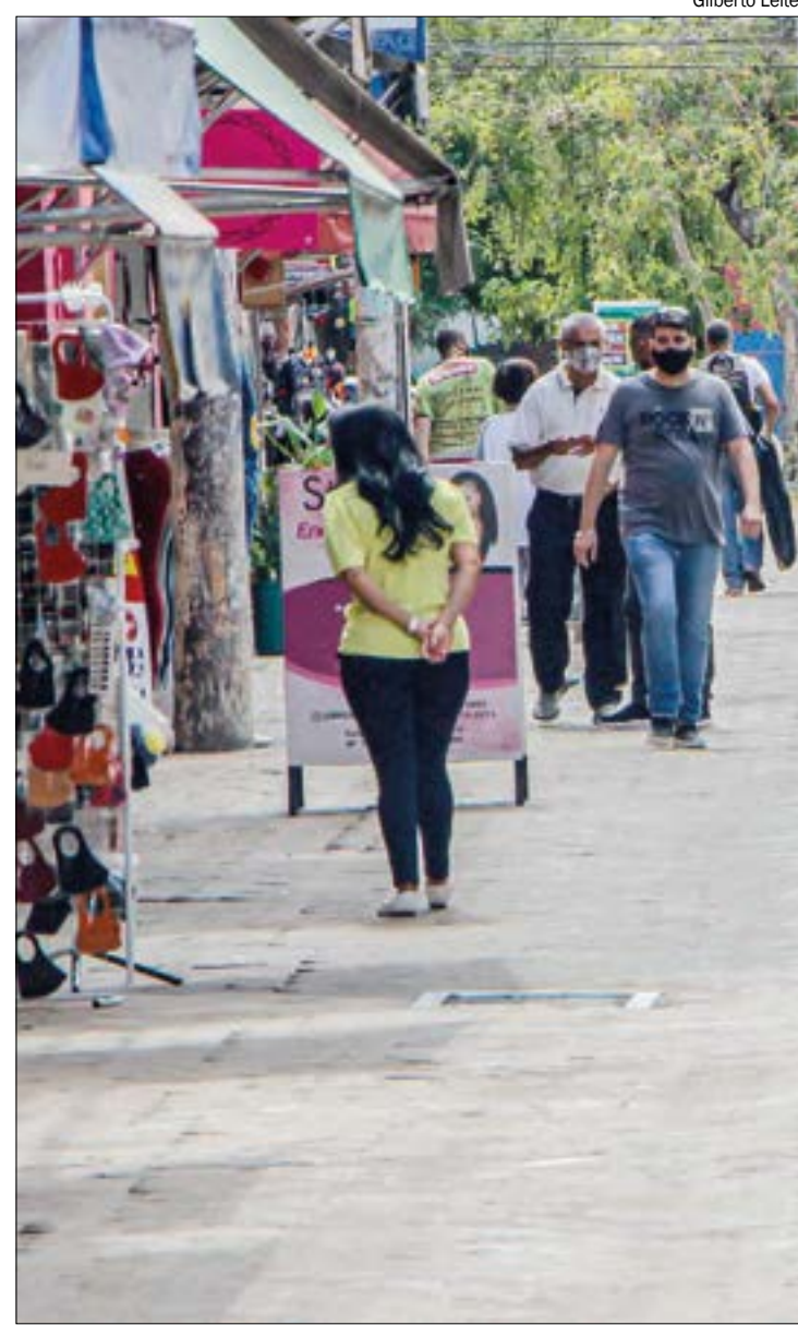
Previsão da inflação para 2022 já está em 5,15%, informou o Banco Central no Boletim Focus

JUROS E CÂMBIO - A previsão do mercado para a taxa básica de juros, a Selic, em 2022, também ficou estável em relação ao divulgado na semana passada, 11,75% ao ano. Há quatro semanas, a projeção era que a Selic fecharia 2022 em 11,5% ao ano.