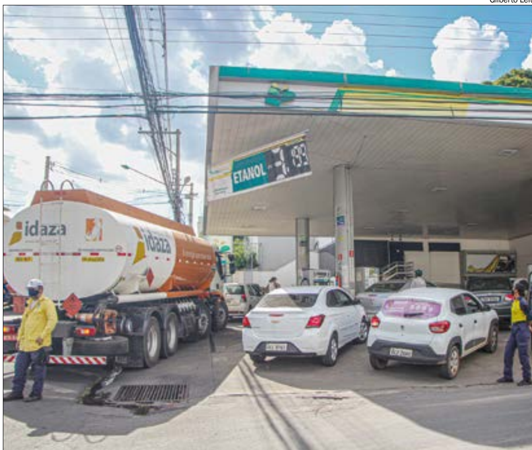
Economista alerta que Petrobras vai continuar aumentando preço dos combustíveis, mesmo com corte nos impostos