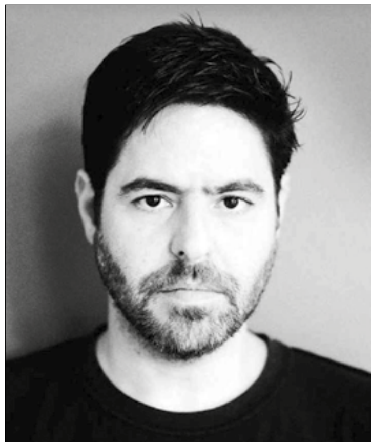
O arquiteto da música eletrônica Gui Boratto amanhã na Vozz Club