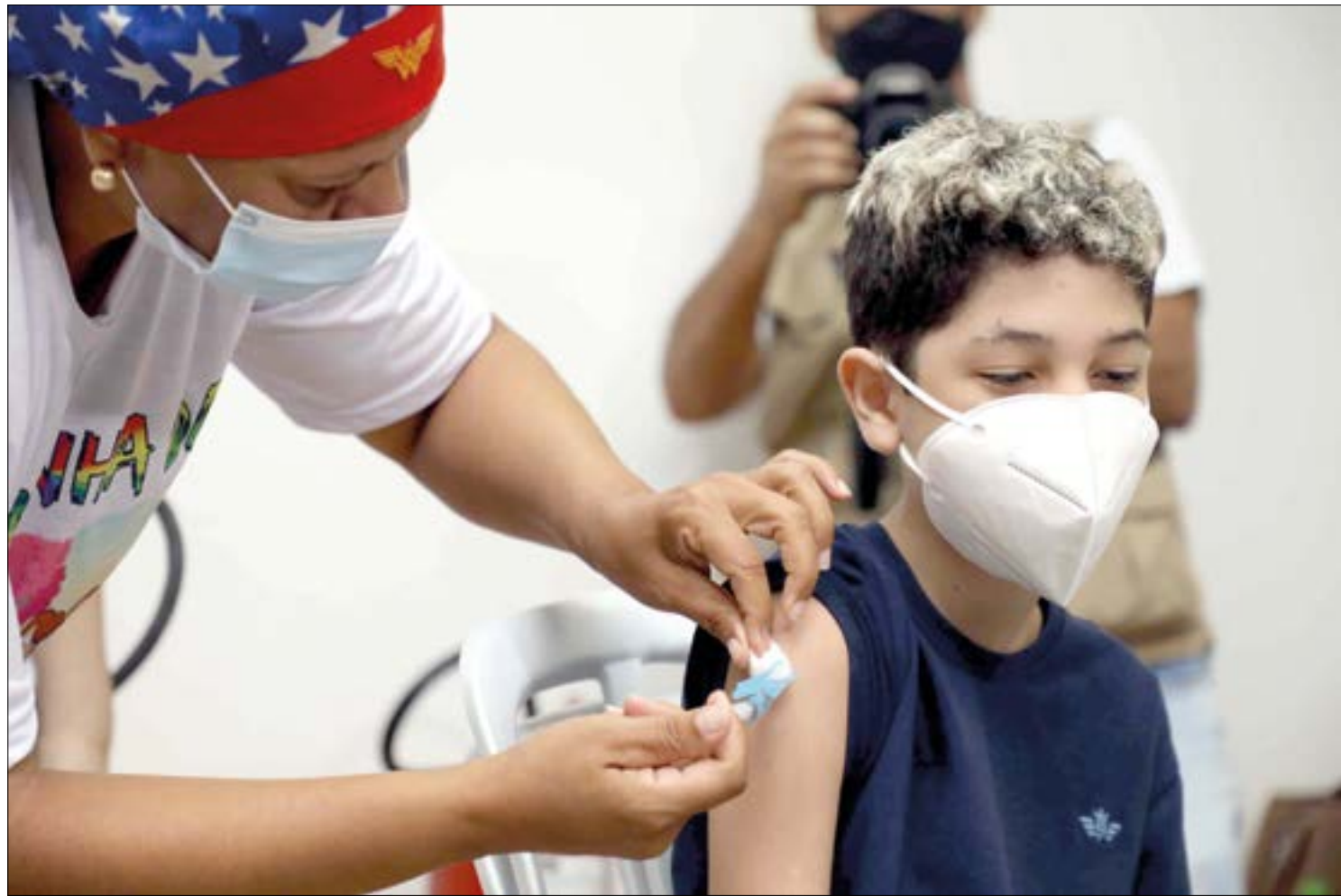
Cuiabá recebeu 3.580 doses e, até o momento, 12 mil crianças estão cadastradas para serem vacinadas