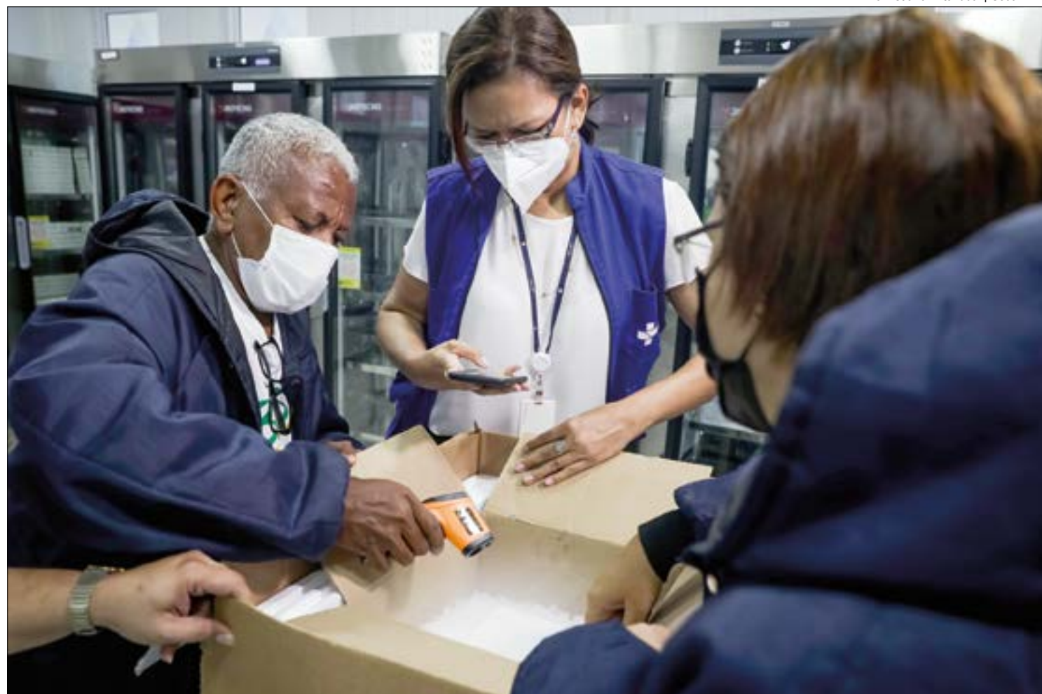
As crianças teriam sido vacinadas com doses para adultos, não autorizadas para aplicação em menores