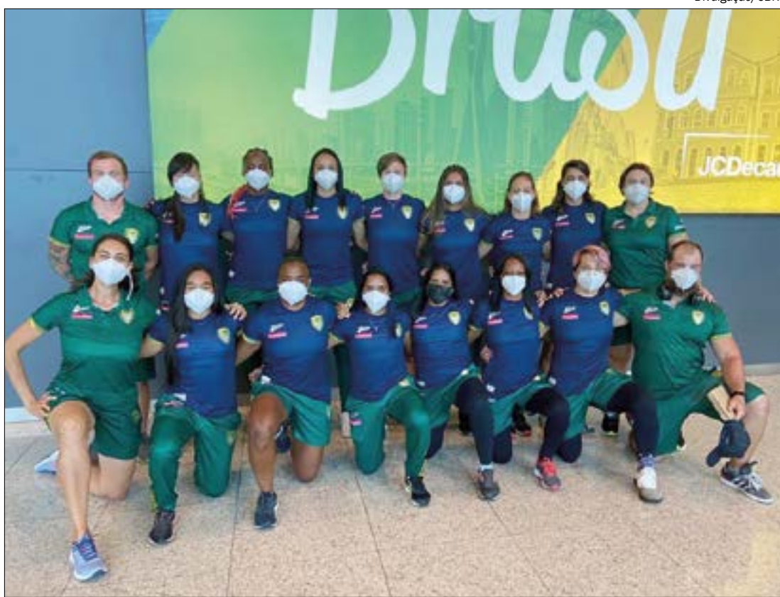
Yaras estão em 7º lugar no Circuito Mundial e buscam melhorar a colocação nas etapas da Espanha

Agora, a seleção brasileira disputará a etapa de Málaga entre os dias 21 e