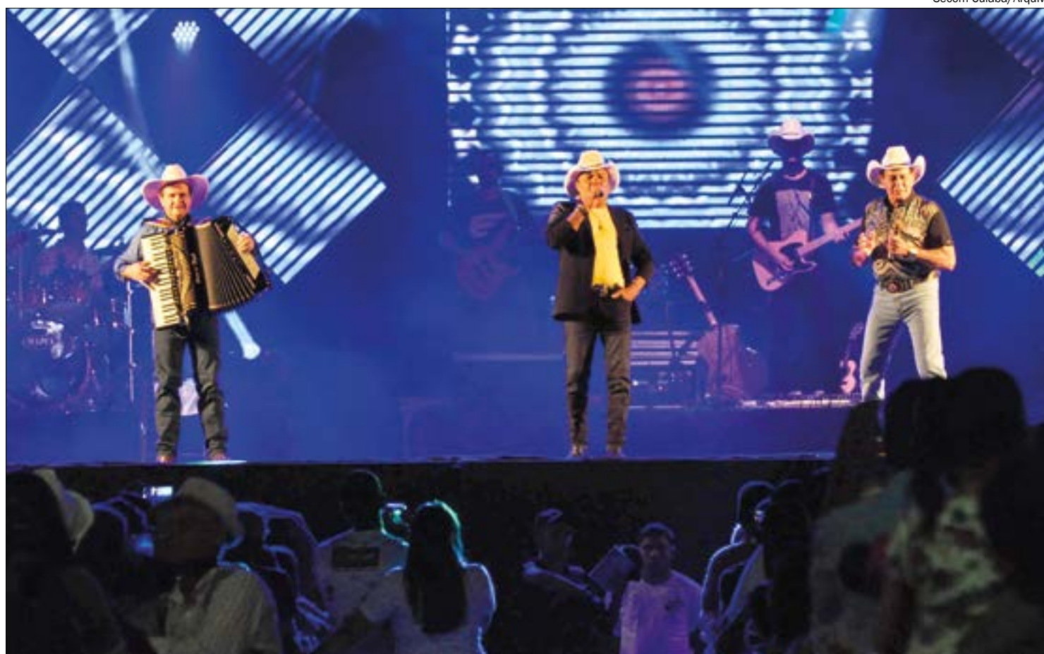
Responsável por 13% do PIB, setor de eventos foi o mais atingido pela pandemia e ainda ‘patina’ na trajetória de recuperação

O setor é contra a imposição de um ‘passaporte’ para entrar em estabelecimentos e eventos. Alcimar defende o modelo utilizado em Cuiabá, que oferece