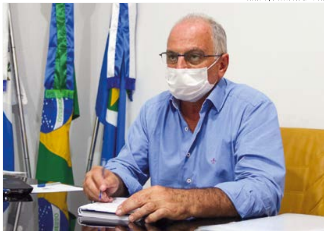
Osmar Froner, prefeito de Chapada, está analisando a possibilidade de realizar eventos durante o Carnaval