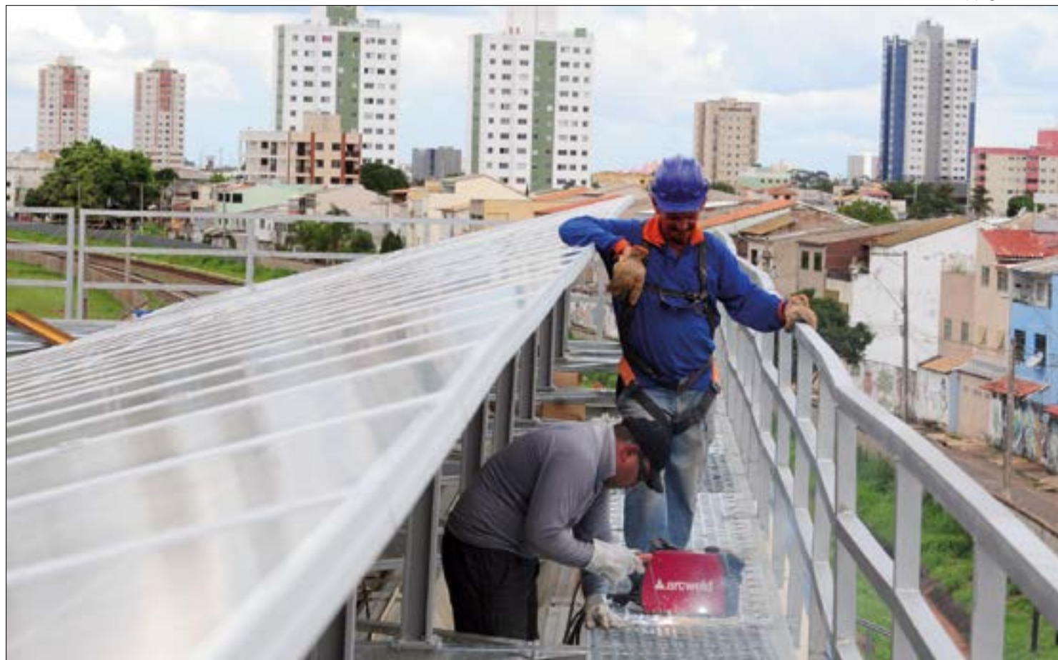
Cuiabá é a primeira cidade no Brasil a atingir a marca de 100 MW de geração de energia solar