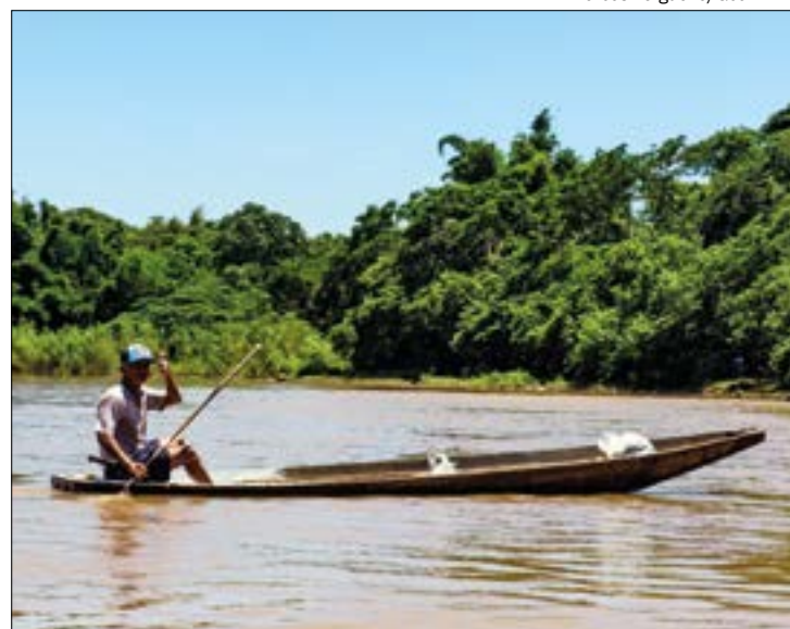
O projeto é de autoria de lideranças partidárias, que defendem pesca como atividade tradicional