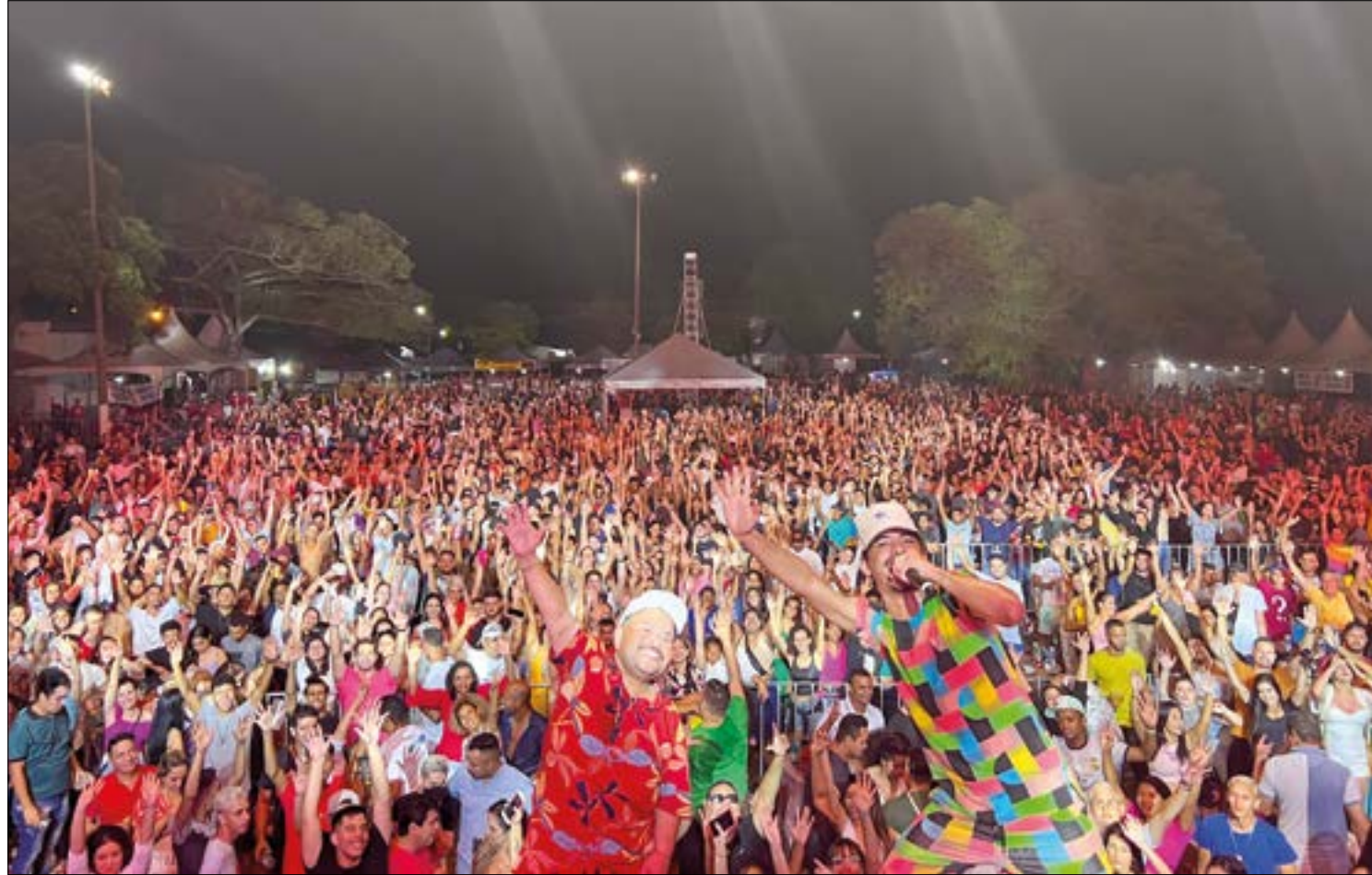
Chapada registrou 91 óbitos em decorrência da covid-19 de abril de 2020 até janeiro deste ano