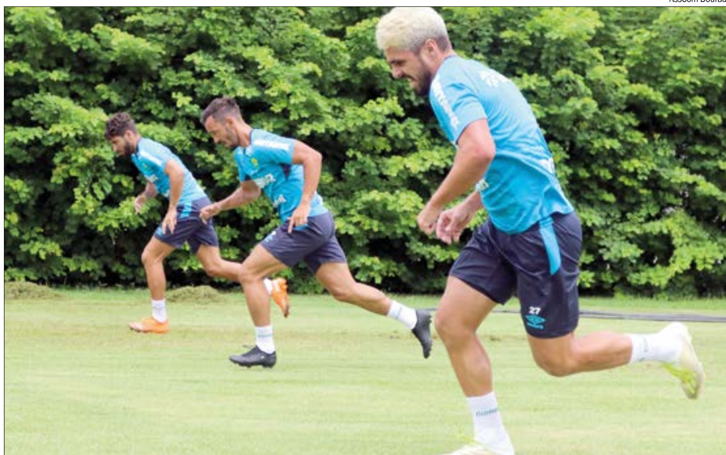
O segundo dia da pré-temporada foi de mais testes físicos e clínicos para os jogadores do Cuiabá