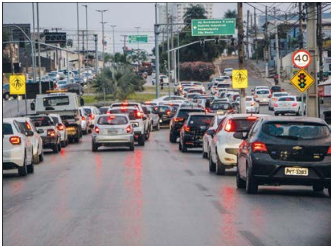
Venda de veículos caiu, mas de caminhões e motos aumentou, segundo Fenabreve

As regras e procedimentos para o sistema de pontuação do Nota MT constam no Decreto nº 1.217, publicado no Diário Oficial do dia 28 de dezembro de 2022, que regulamenta o "Nota MT/Desconto IPVA".