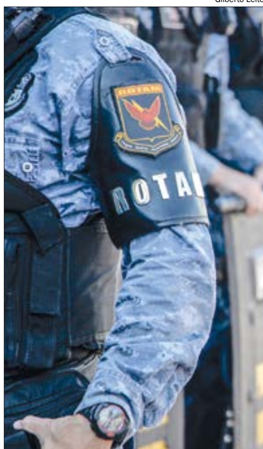
Vagas são para cadastro de reserva, mas expectativa é de que 1.200 servidores sejam nomeados ainda em 2022

As possíveis dúvidas sobre o edital podem ser sanadas pelo e-mail: concursos@ufmt.br .