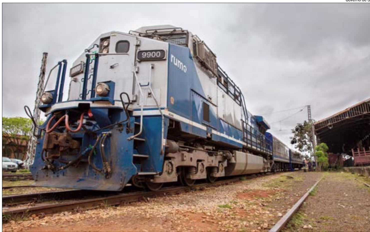
A autorização dada inicialmente para a VLI, foi concedida também para à Rumo