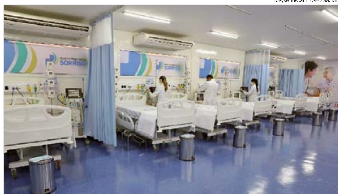
Em Sorriso, investimento foi de R$ 13.067.776,56 para a reforma, realizada entre abril e agosto