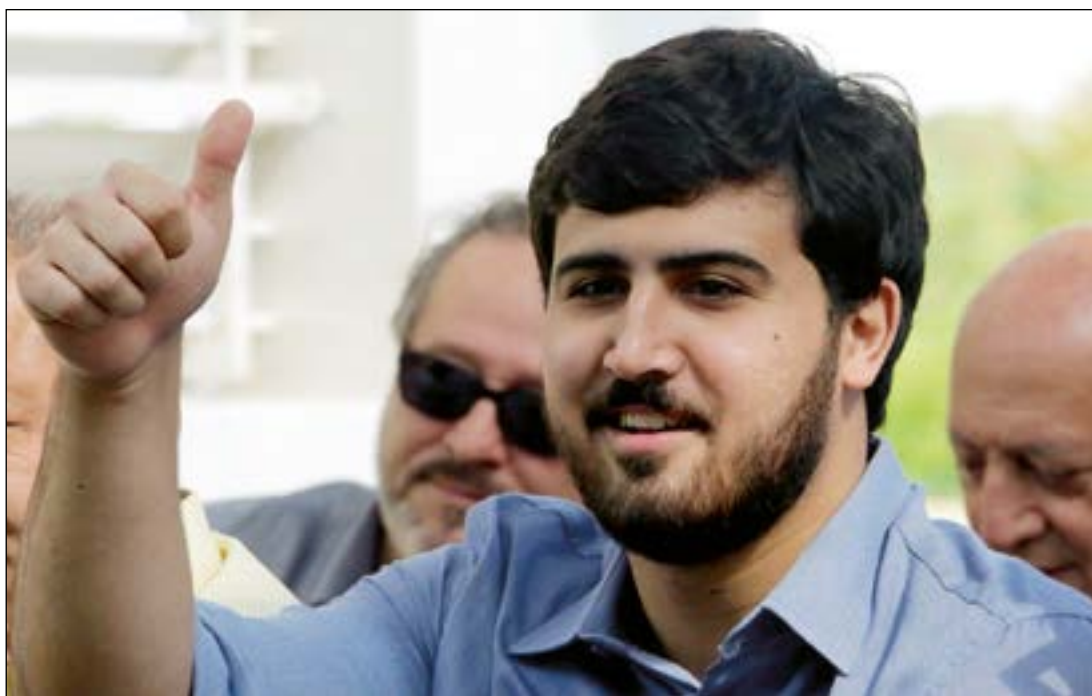
Aniversariante ilustre da semana o Deputado Federal Emanuelzinho Pinheiro Neto