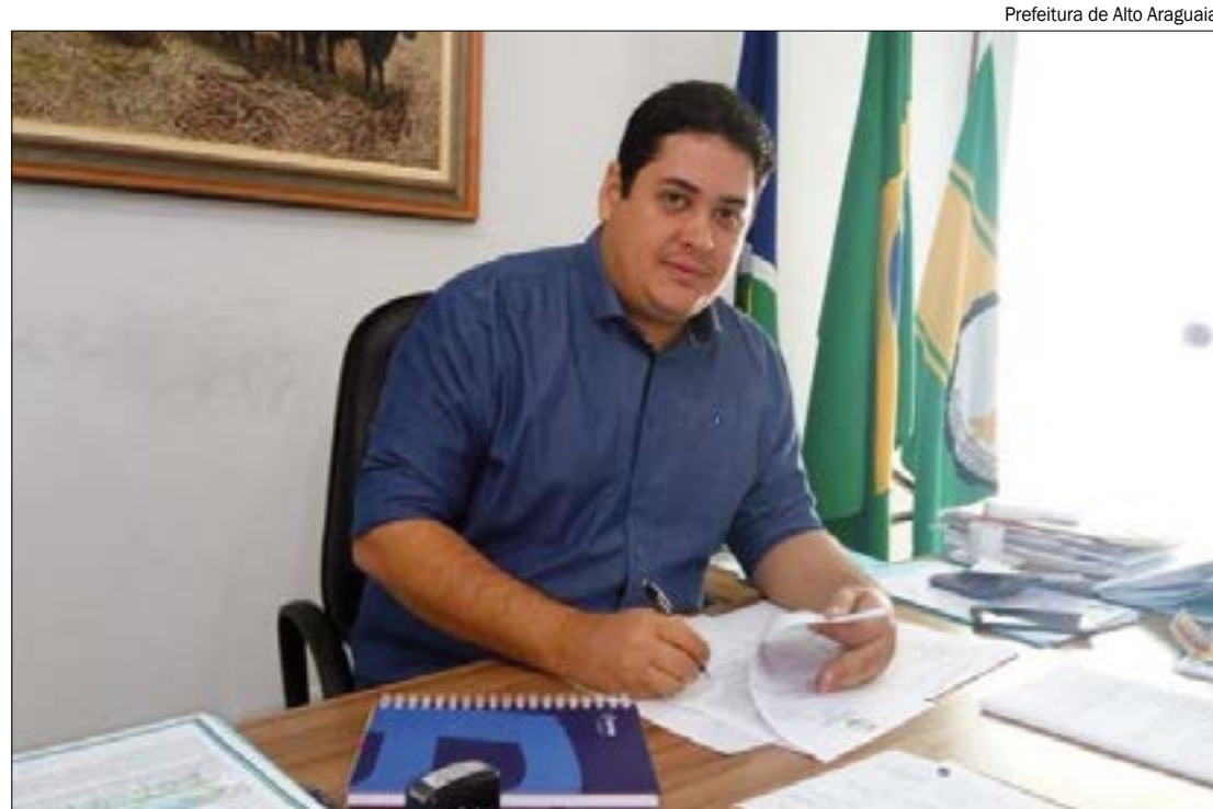
Prefeitura de Alto Araguaia

Os kits para as unidades escolares serão distribuídos conforme a quantidade de alunos da unidade e foram montados com materiais elaborados de acordo com a etapa de educação - anos iniciais e finais do Ensino Fundamental, Ensino Médio e Educação Especial.