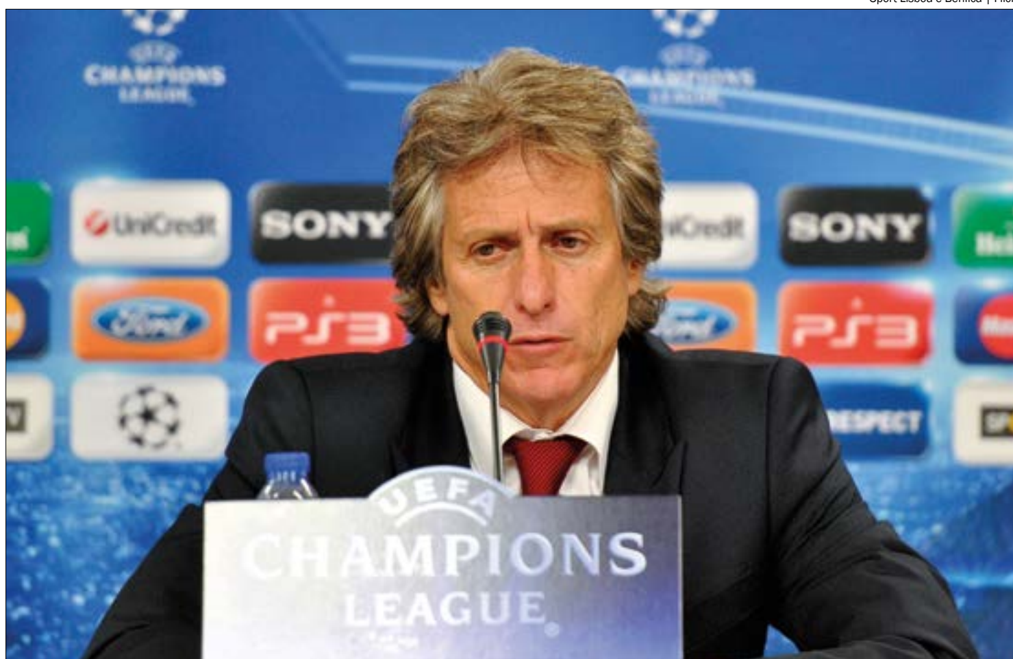
Após atrito com o elenco durante treino, treinador se reuniu com a diretoria e deixou o cargo