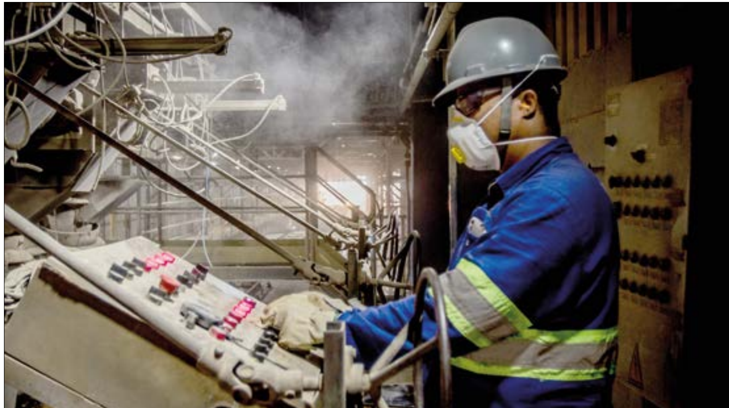
O traçado mais desejado é a continuação da FICO, ligando Água Boa ao município de Lucas do Rio Verde