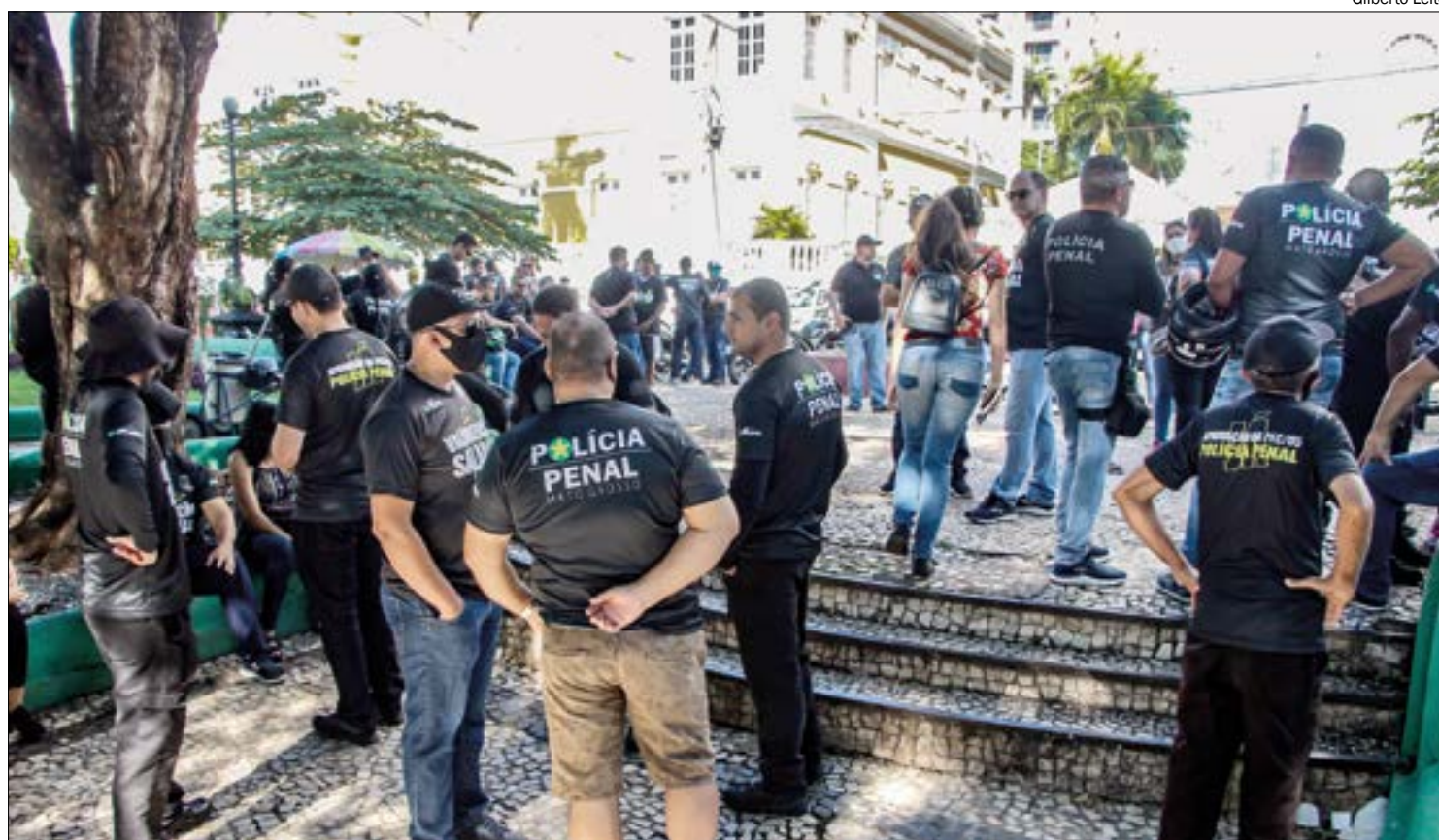
Paralisação chega ao seu 11º dia. Desembargador determina bloqueio das contas do Sindspen e dos dirigentes

A decisão foi proferida na noite de domingo (26) e atende pedido feito pelo Governo do Estado, que aponta as dificuldades impostas pelos dirigentes do sindicato para evitar a intimação judicial e, por con-