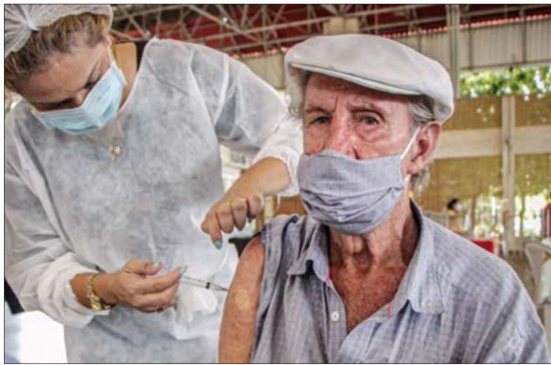
Pouco mais de 170 mil doses de reforço foram aplicadas, o que atende cerca de 3% da população vacinável

Em dezembro, 30,3% das vítimas do coronavírus tinham entre 71 e 80 anos. A mesma porcentagem foi registrada para pessoas de 61 a 70 anos, seguida de 15,15% vítimas com mais de 80 anos. 69,7% tinham algum tipo de comorbidade e das vítimas, 54,5% eram mulheres.