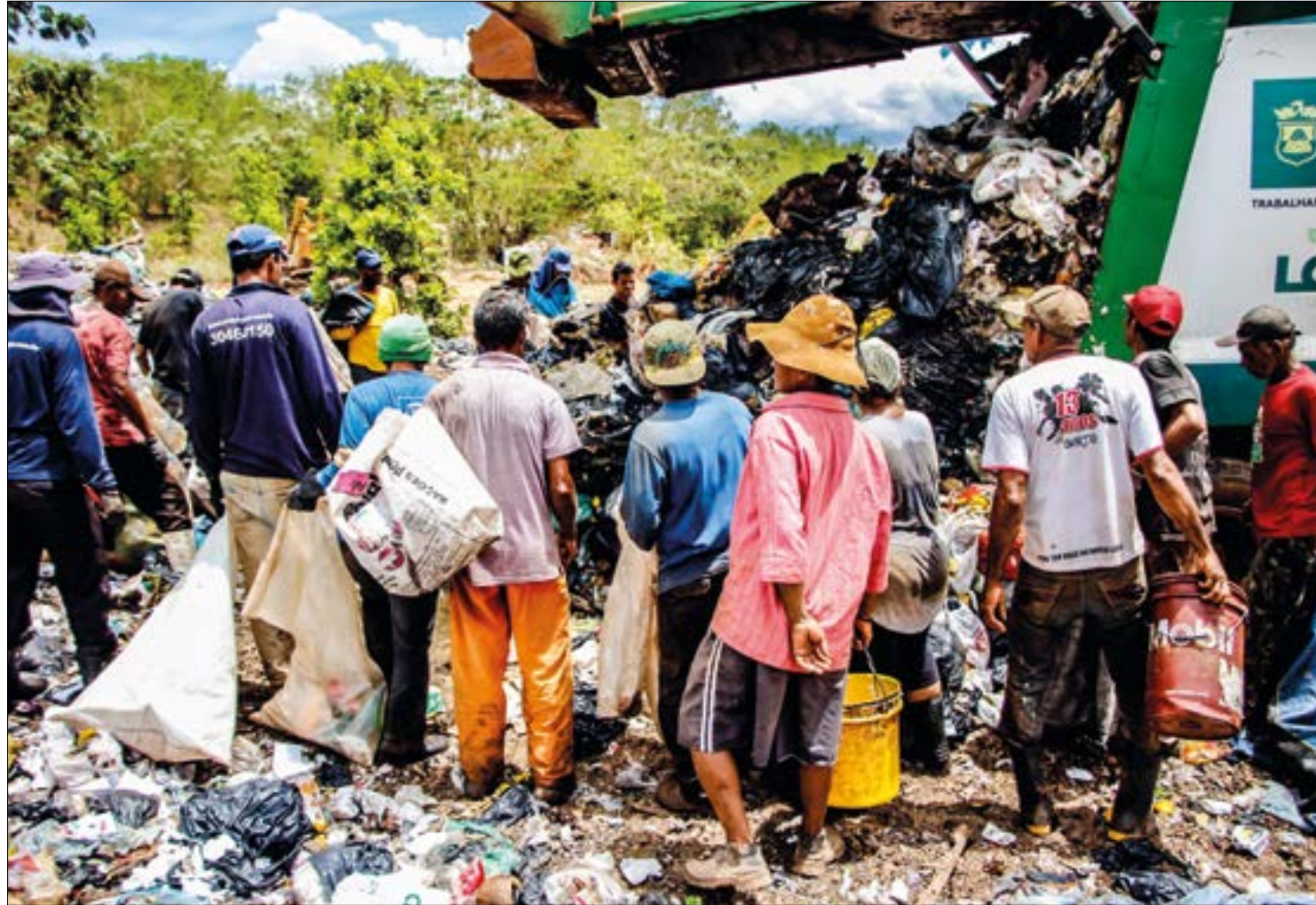
O valor destinado aos trabalhadores será limitado a um membro da família