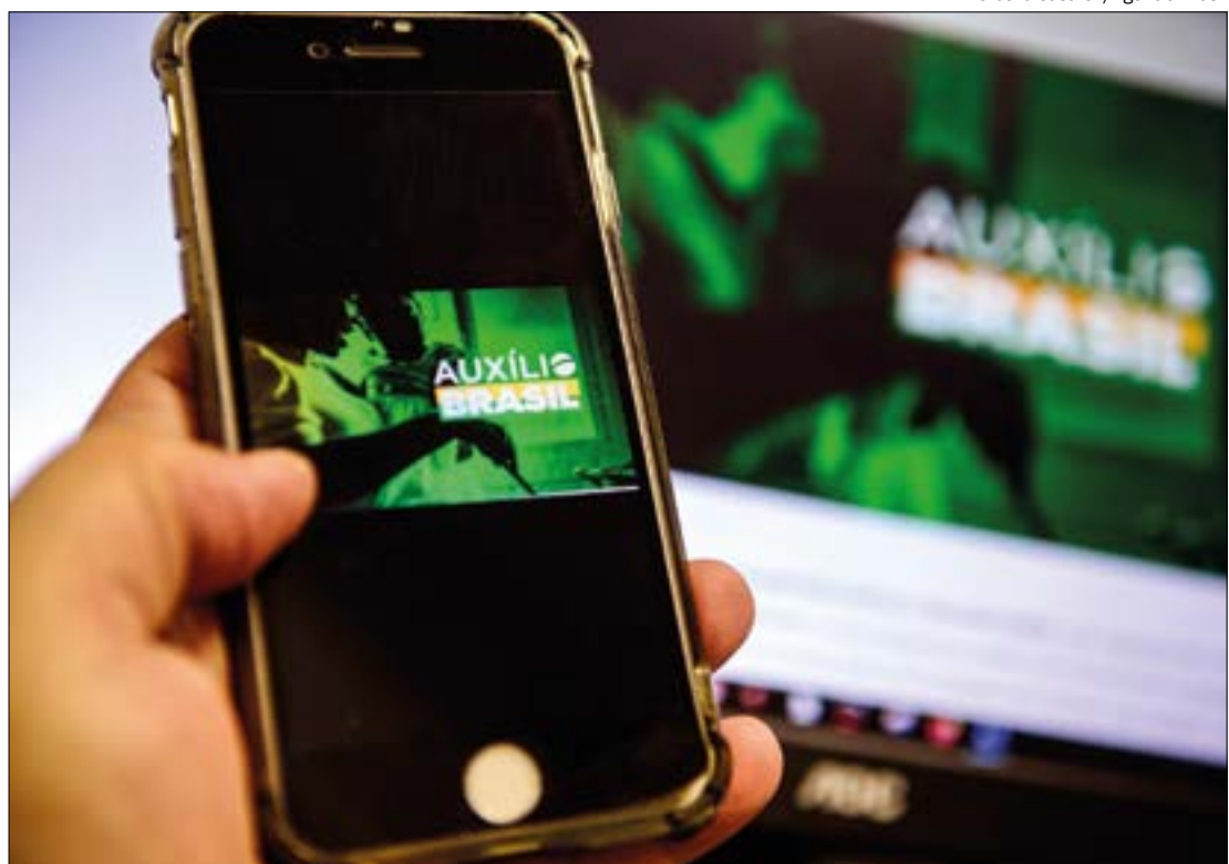
Datas de pagamento do Auxílio Brasil seguem o modelo do Bolsa Família