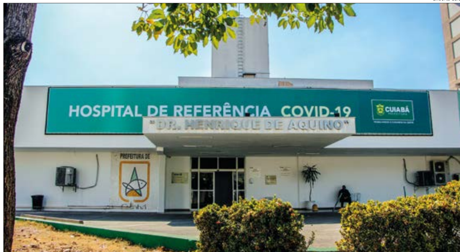
As cirurgias começarão a ser feitas assim que o projeto for aprovado pela SES-MT

A Polícia Civil passa a investigar o caso.