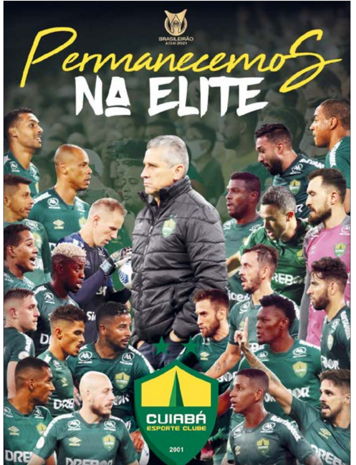
Além da permanência na Série A, o Dourado carimbou sua vaga para disputar a Copa Sul-Americana em 2022

*Estagiária sob supervisão do editor Gabriel Soares