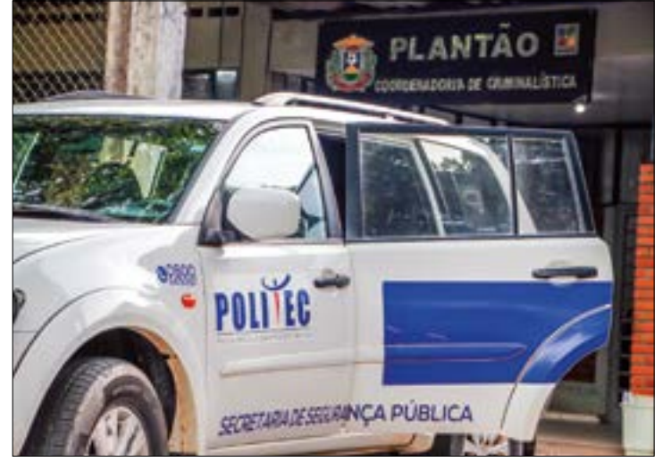
Joas estava deitando quando o colega de trabalho entrou no alojamento e disparou contra ele