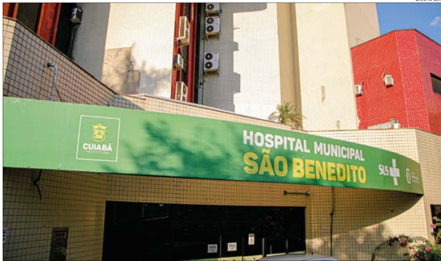
A regra era válida para acompanhantes e visitantes de pacientes internados nas unidades de saúde

A Polícia Civil apura o caso como ocorrência de morte a esclarecer, sem indício de crime.