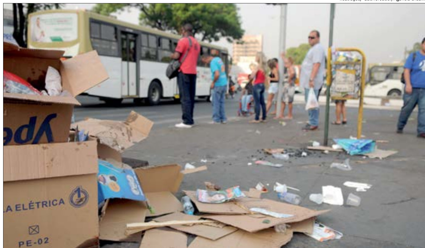
Ilustração/ Gabriel Jabur/Agência Brasília

Em Cuiabá, pessoas que lançarem em ruas, praças, jardins e quaisquer áreas e logradouros públicos dos municípios como papéis, invólucros, copos, casas, restos de alimentos e resíduos em geral, sofrerão