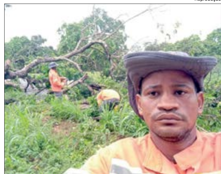
Manoel morreu após se envolver em um acidente com uma carreta na BR-070