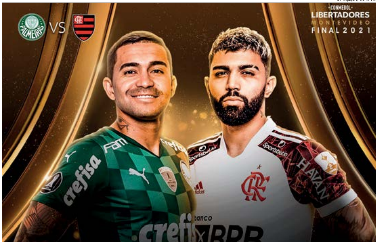
Palmeiras e Flamengo têm disputado a hegemonia do futebol nacional desde 2015 e decidirão o melhor na final da Libertadores