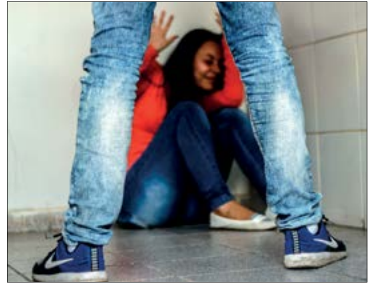
Adolescente saiu da escola e foi para casa de amigos. Ao adormecer, acabou sendo estuprada por eles