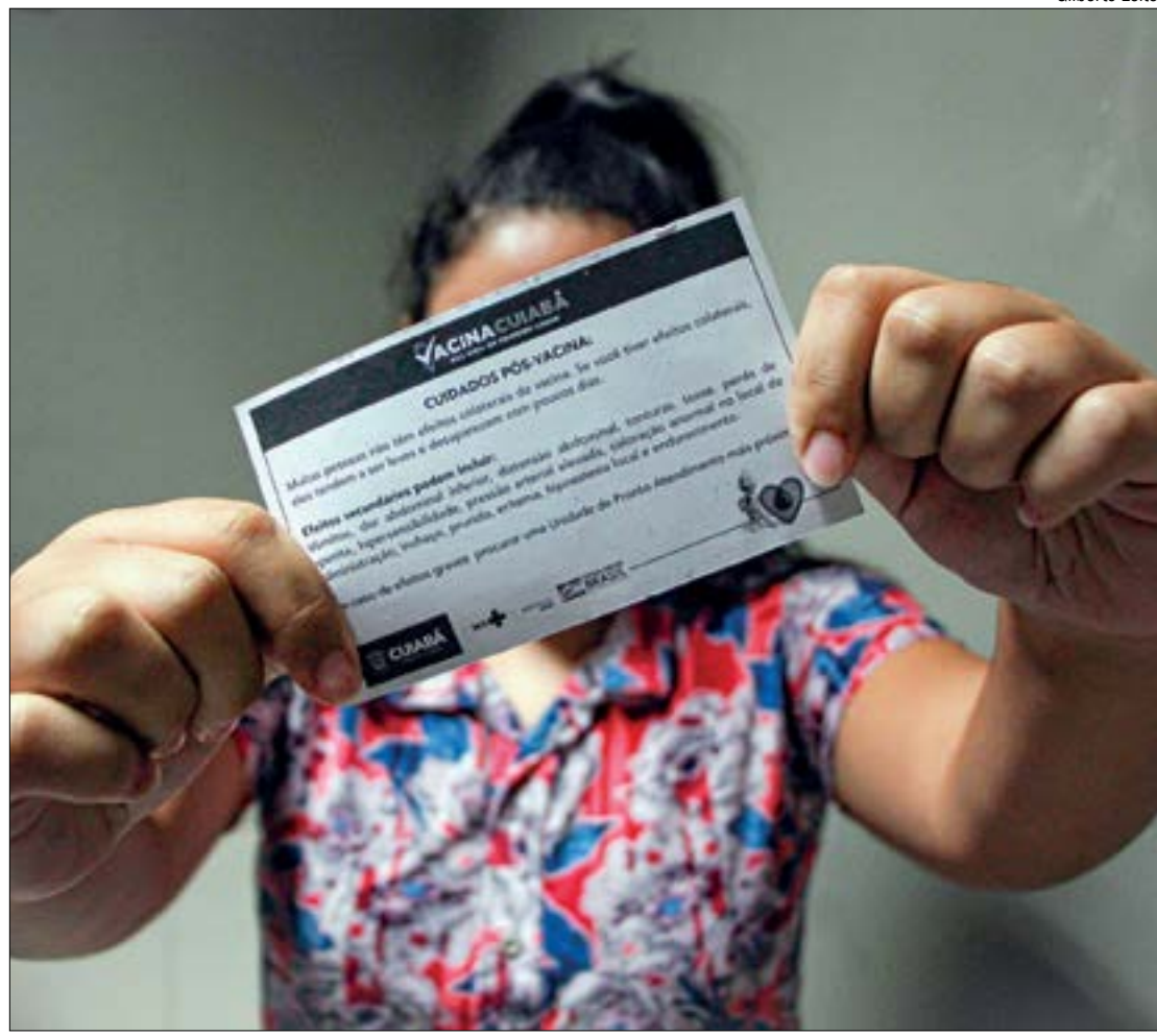
O cronograma para imunização da 3ª dose ainda será divulgado pelo Ministério da Saúde