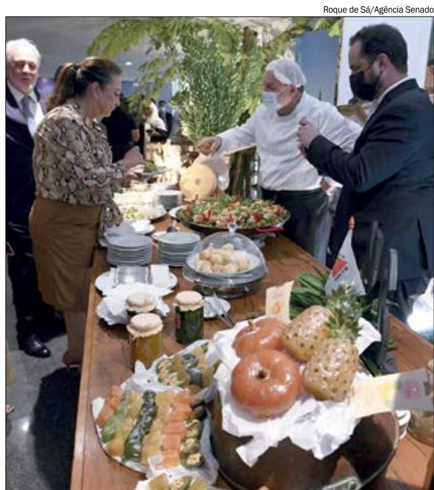
Roque de Sá/Agência Senado