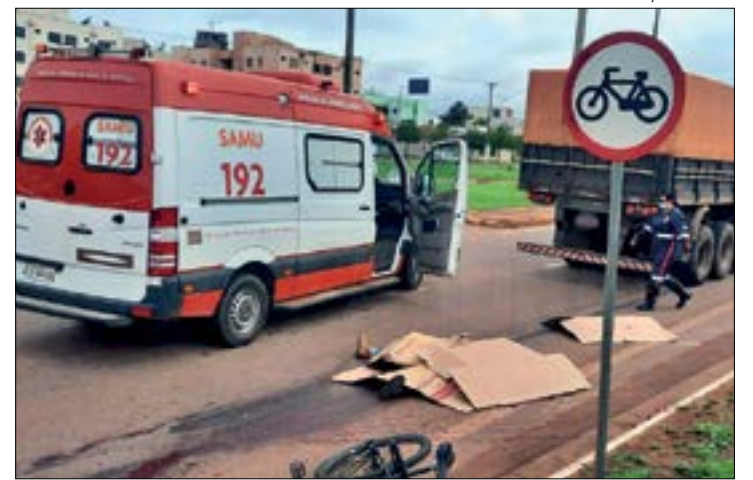
A vítima teve a cabeça arrancada após ser atropelada por um caminhão