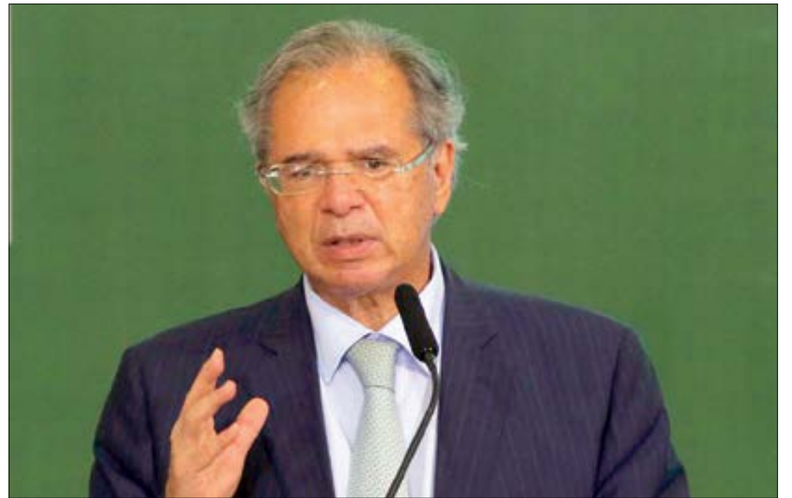
“Inflação provavelmente será um pouco acima do previsto”, afirma Guedes

O técnico destaca que o produtor pode obter ganhos de três formas: pela produção do biogás, que irá abastecer o botijão de gás ou gerar a energia elétrica; e pela produção do biofertilizante resultante do processo. Ele frisa que o Brasil é o quarto maior importador de fertilizantes do mundo. O País importa cerca de 75% do total desses insumos aplicados nas lavouras.