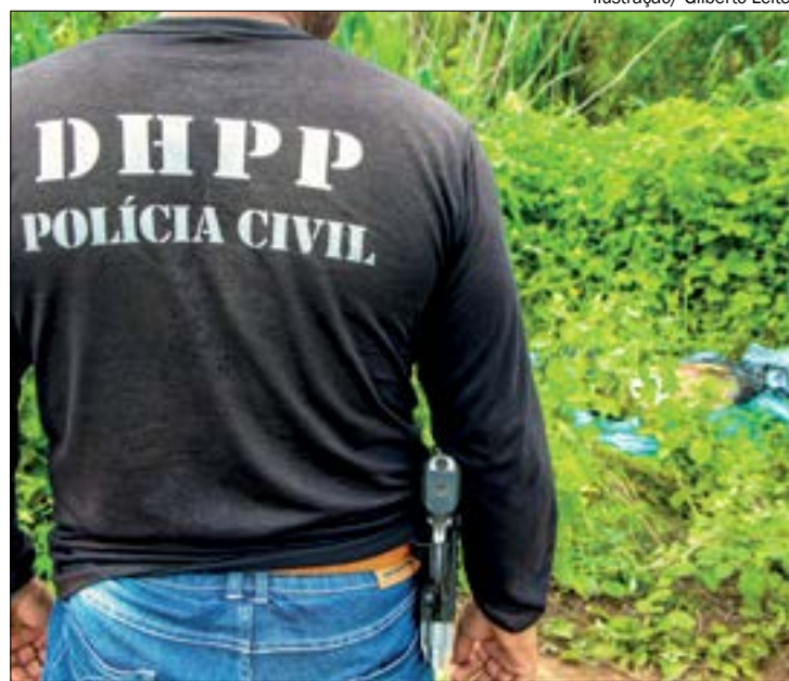
A briga começou no bar e acabou com o homem esfaqueado, caído no quintal de uma residência