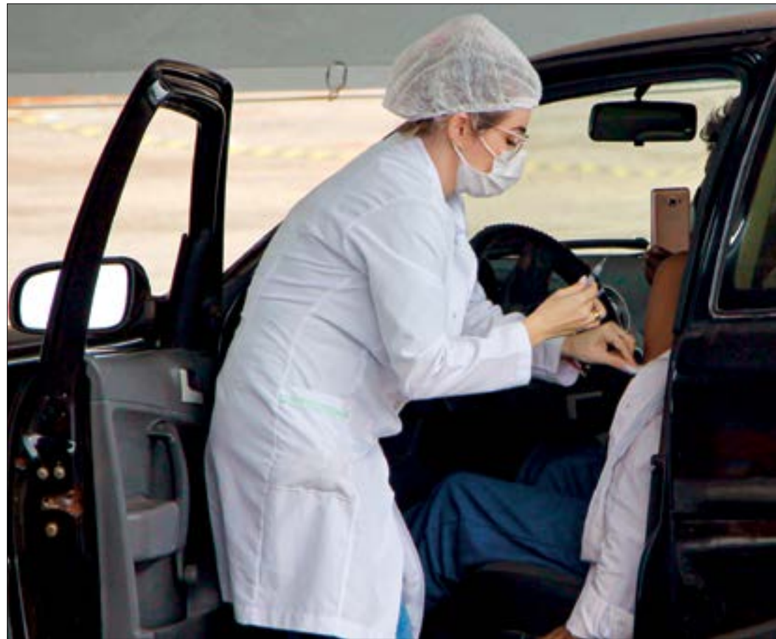
Além de ampliar a 3ª dose, o Ministério mudou o intervalo para o reforço de 6 para 5 meses

O corpo foi encaminhado ao Instituto Médico Legal (IML) para exame de necropsia.