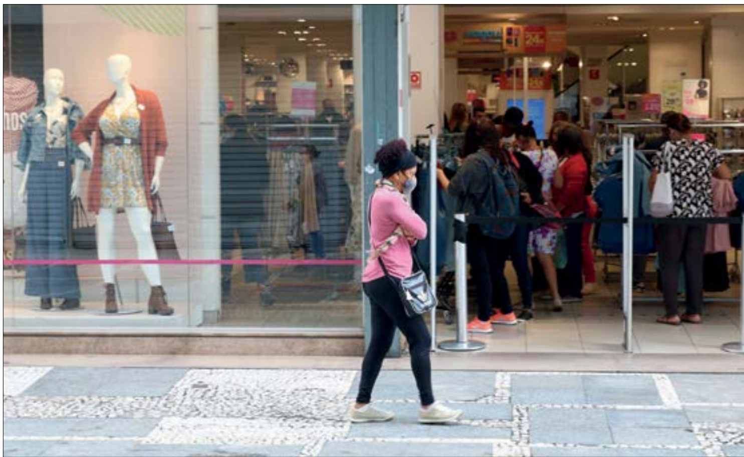
Promoções de Black Friday são opção para atrair clientes, mas demandam planejamento

já trabalham com estoques mais baixos para atender os clientes neste fim de ano. Um dos grandes desafios será realizar promoções que sejam interessantes para os consumidores, considerando o aumento dos custos, sem comprometer as finanças do negócio”, informou a Fecomercio.