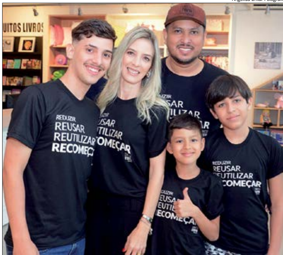
Angélica Untar Fotografia