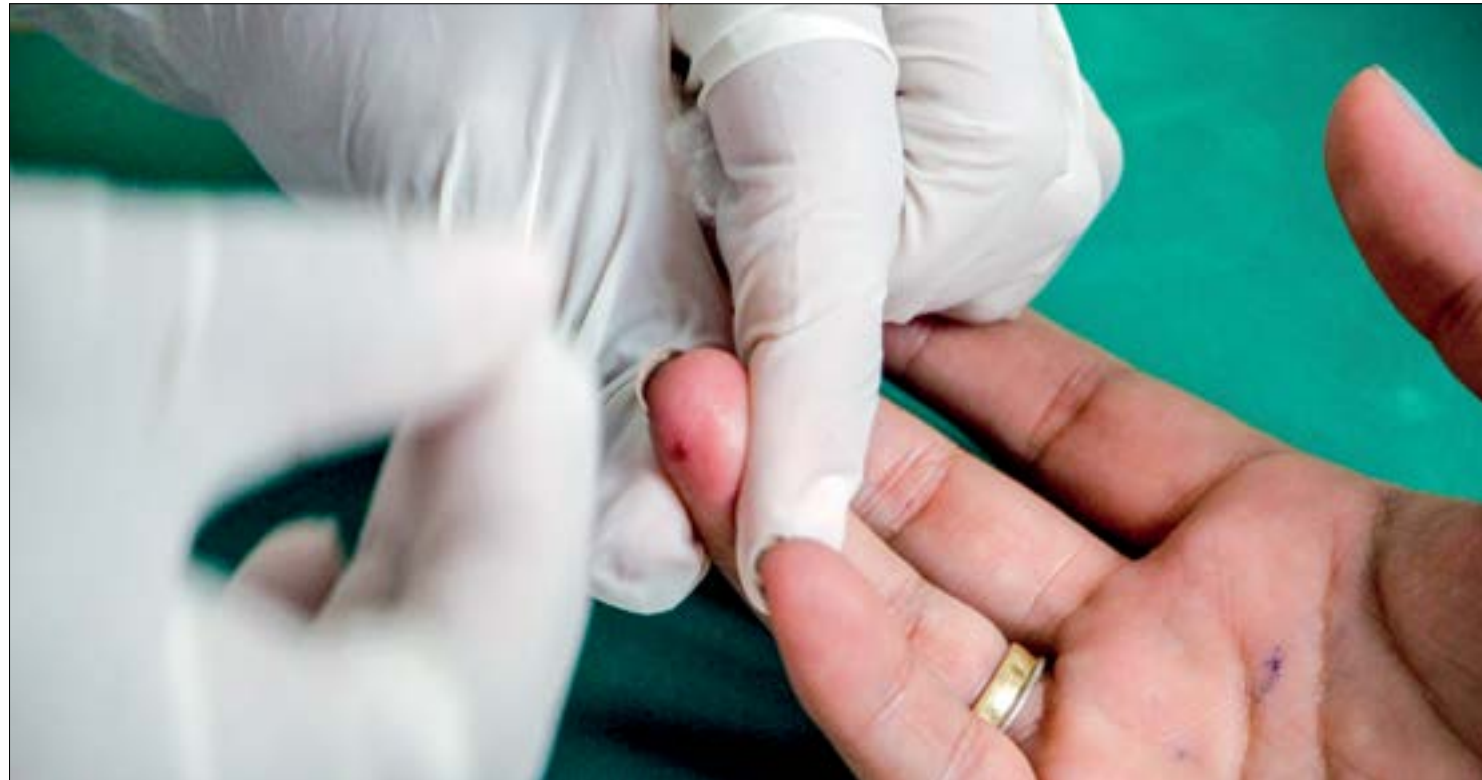
O levantamento estimou que até 2045, 784 milhões de pessoas podem viver com diabetes no mundo