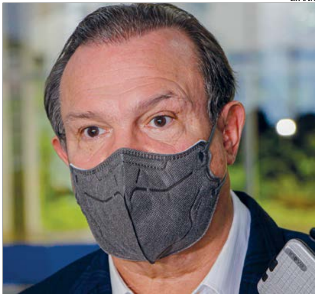
Movimentação de Bolsonaro fortalece Fagundes, que já é visto como possível candidato ao governo em 2022

O relacionamento com o PP foi lembrado porque a sigla deverá indicar o vice de Bolsonaro na cha-