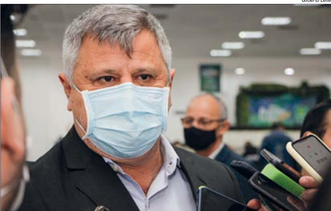
Contratações da Saúde serão submetidas ao crivo de Stopa, prefeito em exercício de Cuiabá