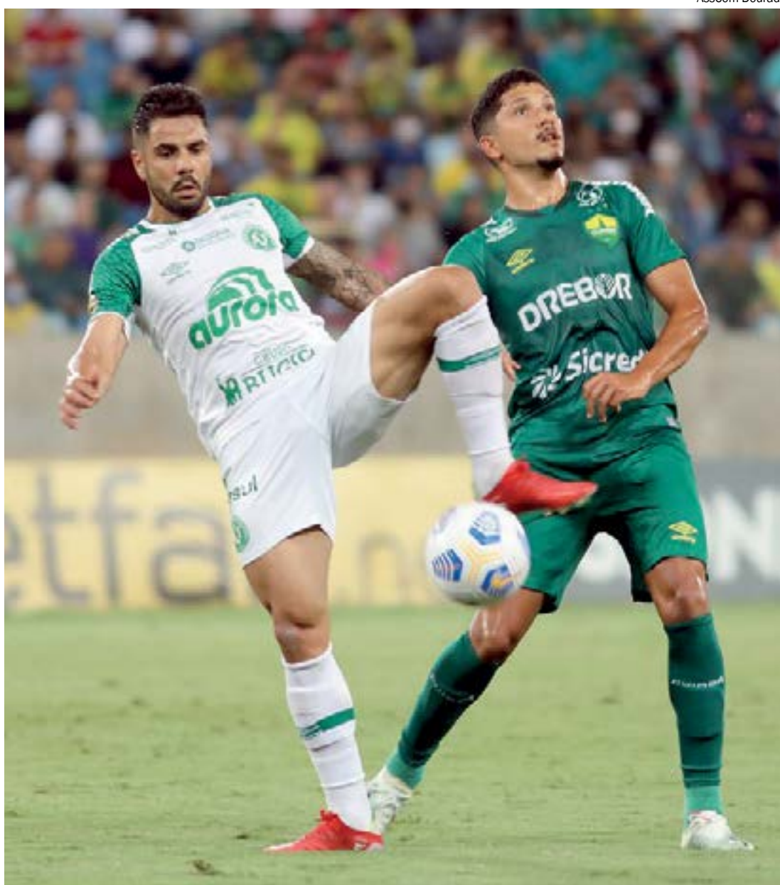
Cuiabá tentou e fez 14 finalizações, mas não conseguiu furar a defesa da Chape

Contra o Ceará, no domingo, Jorginho deve enfrentar uma situação diferente. O técnico Tiago Nunes, que comanda o alvinegro do Nordeste, tem um estilo de jogo mais propositivo, o que deve permitir ao