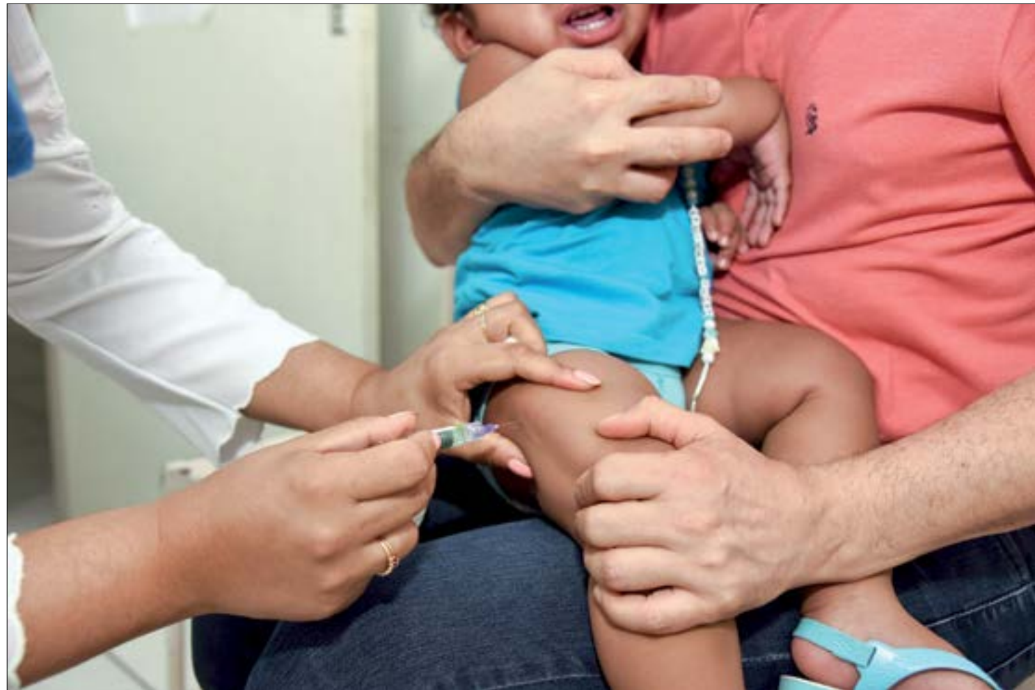
Todas as unidades básicas de saúde estão aplicando vacinas da campanha de multivacinação

No veículo roubado foi encontrado duas televisões e com o suspeito baleado a carteira da vítima.