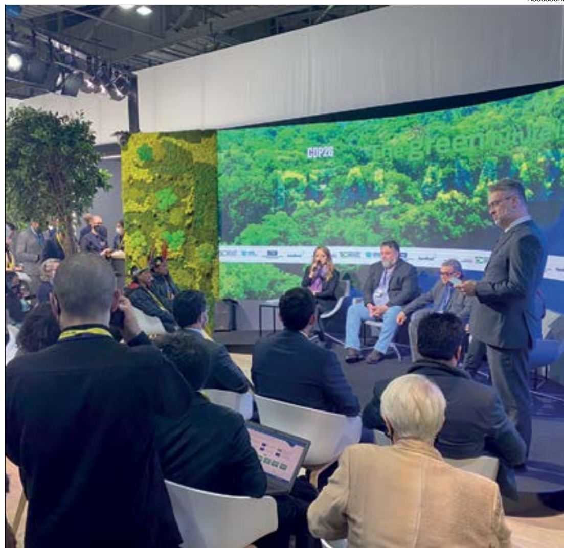
No painel 'Amazônia Real', Mauren destacou que território preservado de Mato Grosso é maior que três países

"Fomos notícia ano passado em virtude dos incêndios, principalmente no Pantanal, mas neste ano reduzimos os focos de calor em 83% no Pantanal, 52% em todo o estado, em comparação com o ano passado. Houve redu-