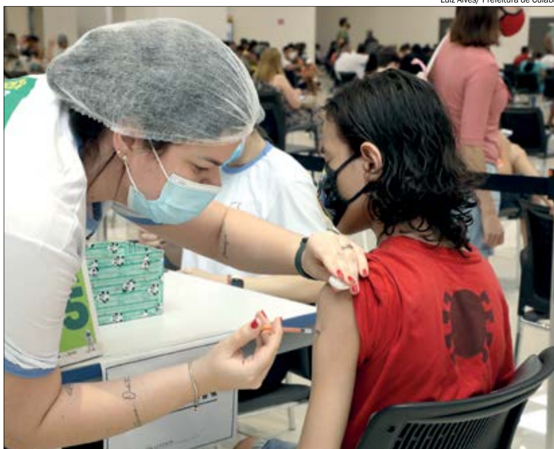
Luiz Alves/ Prefeitura de Cuiabá