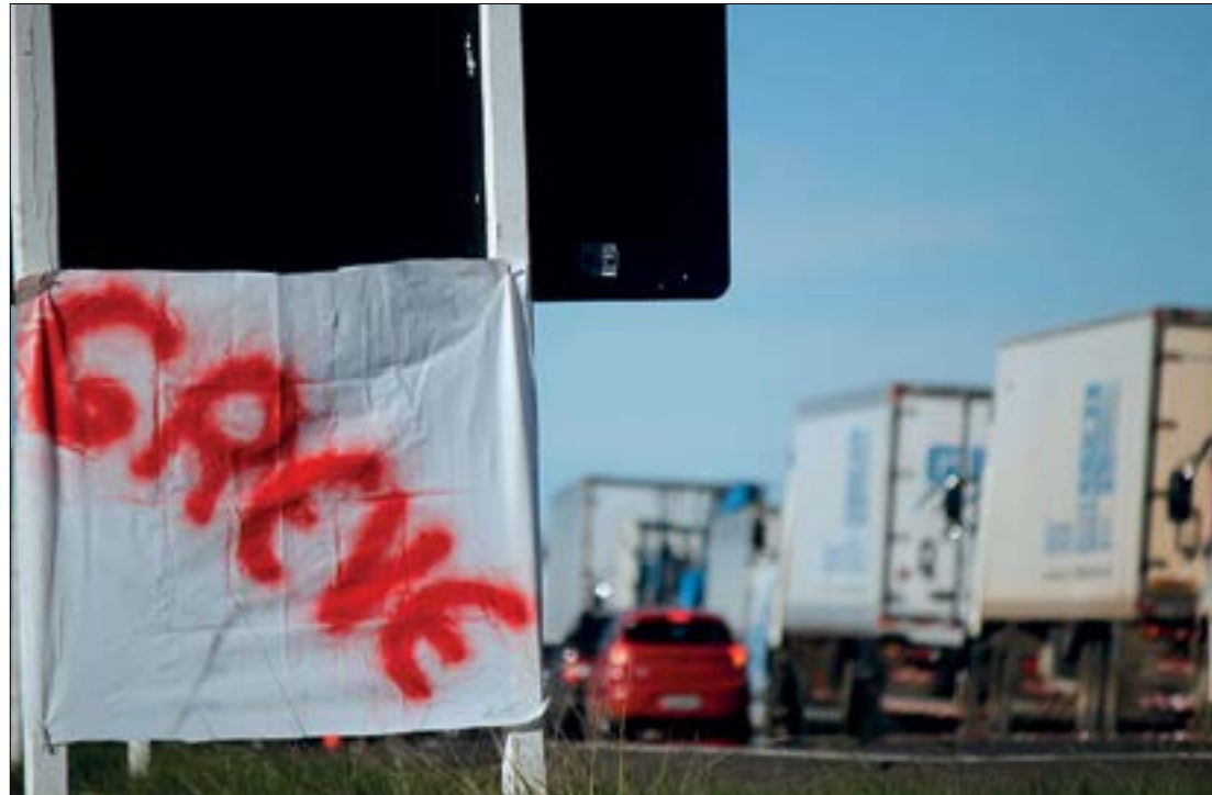
Setores como o agronegócio e logístico dizem que não vão apoiar o ato previsto para o dia 1º de novembro