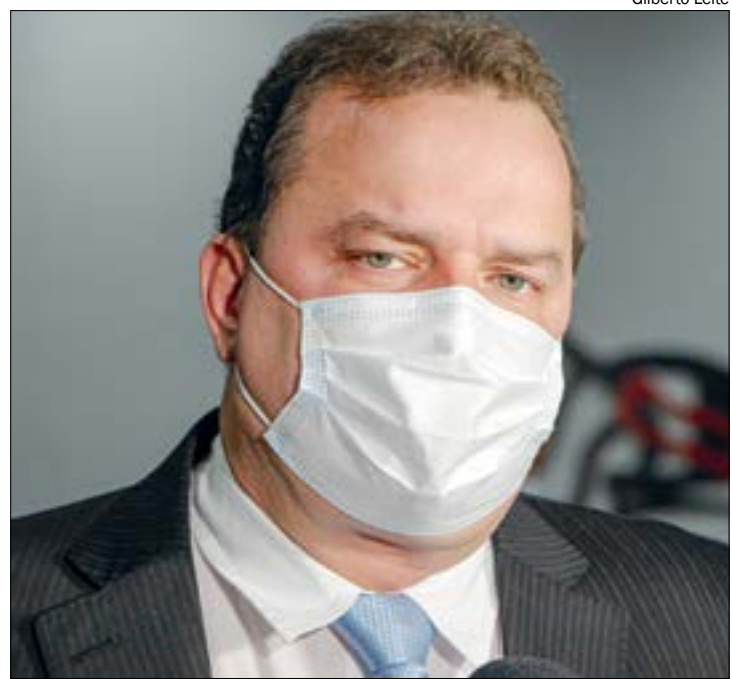
Russi defende melhoria na aplicação dos recursos contra desmatamento e queimadas ilegais