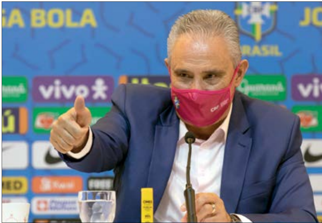
Tite poderá convocar atletas nacionais em caso de lesões ou desfalques, devido à facilidade de logística