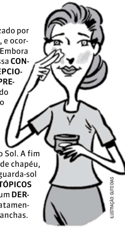
ILUSTRAÇÃO: GUTO DAS

O MELASMA é um distúrbio cutâneo caracterizado por MANCHAS na pele, principalmente no ROSTO , e ocorre com maior frequência entre as MULHERES . Embora não tenha uma CAUSA definida, sabe-se que essa CONDIÇÃO está relacionada a uso de ANTICONCEPCIONAIS , gravidez, menopausa, exposição solar e PRE-DISPOSIÇÃO genética. O melasma é diferente do câncer de pele conhecido como melanoma e, ao contrário deste, é considerado BENIGNO . Não oferece nenhum risco à saúde e provoca apenas um desconforto ESTÉTICO . Para prevenir ou retardar o APARECIMENTO de novas manchas, é RECOMENDÁVEL evitar a exposição ao Sol. A fim de PROTEGER a área afetada, indica-se o uso de chapéu, boné ou VISEIRA , óculos escuros, sombrinha, guarda-sol e filtro SOLAR . A utilização de medicamentos TÓPICOS deve sempre ser prescrita e acompanhada por um DERMATOLOGISTA , já que a automedicação e o tratamento inadequado podem levar a uma piora nas manchas.