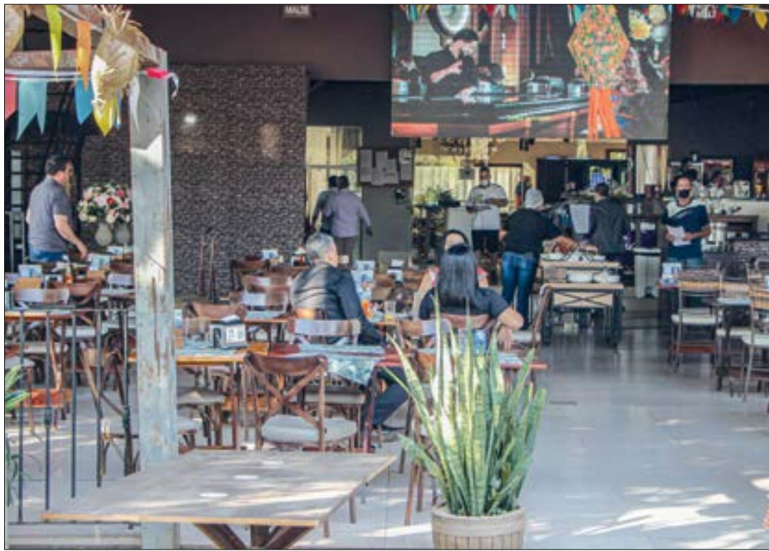
As limitações de dia ou horários para funcionamento não estão mais em vigor na Capital