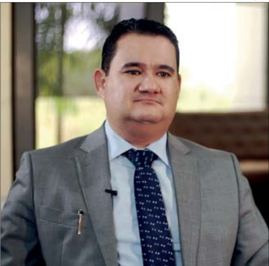
Juiz aponta que afastamento de Emanuel é necessário para garantir segurança da instrução processual