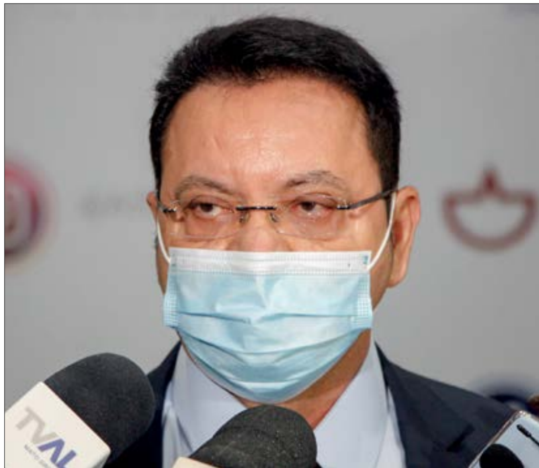
Segundo Botelho, Mato Grosso tem uma demanda reprimida de 150 mil casas populares

O governador argumenta que o Ser Família Habitação é uma forma de viabilizar à população de baixa renda o acesso à moradia adequada e regular, bem como aos serviços públicos, de modo a reduzir a desigualdade social. Para isso, o Estado pretende disponibilizar cerca de 20 mil unidades habitacionais, número