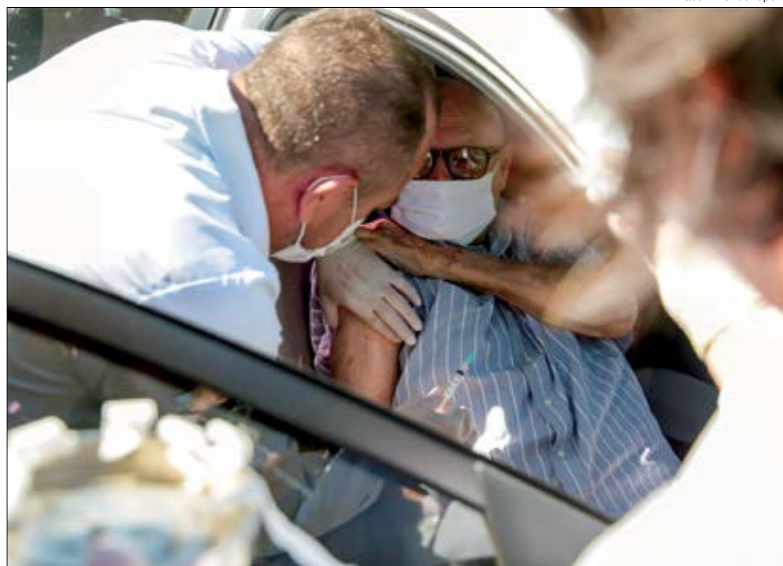
O município tem avançado na vacinação da população e números de óbitos e casos tem diminuído

O município registrou 38.299 casos da doença e 942 óbitos até o momento. O número de pessoas recuperadas é de 37.215. 104 casos estão sendo monitorados e 36 pessoas seguem internadas.