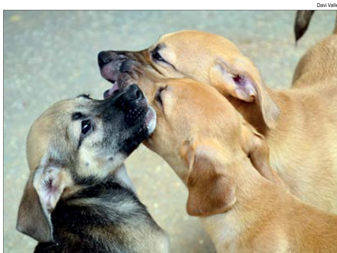
Projeto contribui para o controle populacional dessas espécies em bairros carentes de Cuiabá

A aula inaugural foi encerrada com a entrega dos materiais que serão utilizados nas oficinas, como instrumentos musicais, bolas e o uniforme para os alunos.