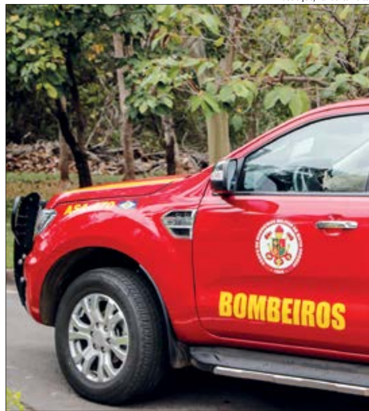
A criança caiu na piscina e foi encontrada pelos pais depois que eles sentiram sua falta