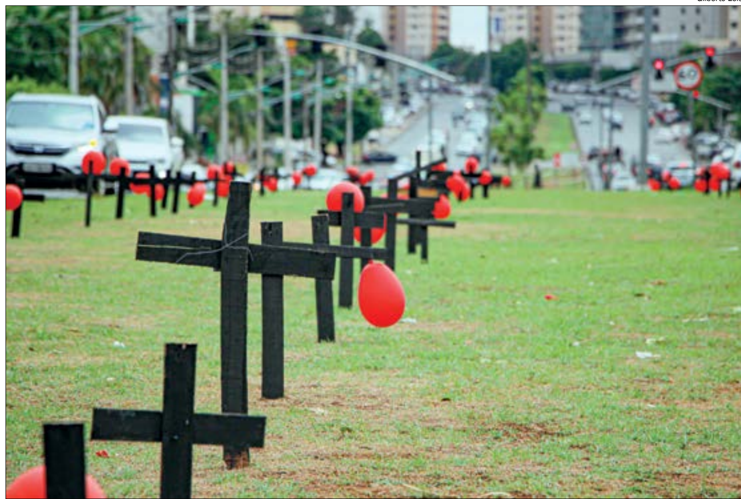
A Prefeitura de Cuiabá removeu as cruzes instaladas pela ONG Observatório Social

Ela conduzida a delegacia e lá ela registrou um boletim de ocorrência contra o marido, e afirmou representar criminalmente contra ele. O caso é investigado pela Polícia Civil.