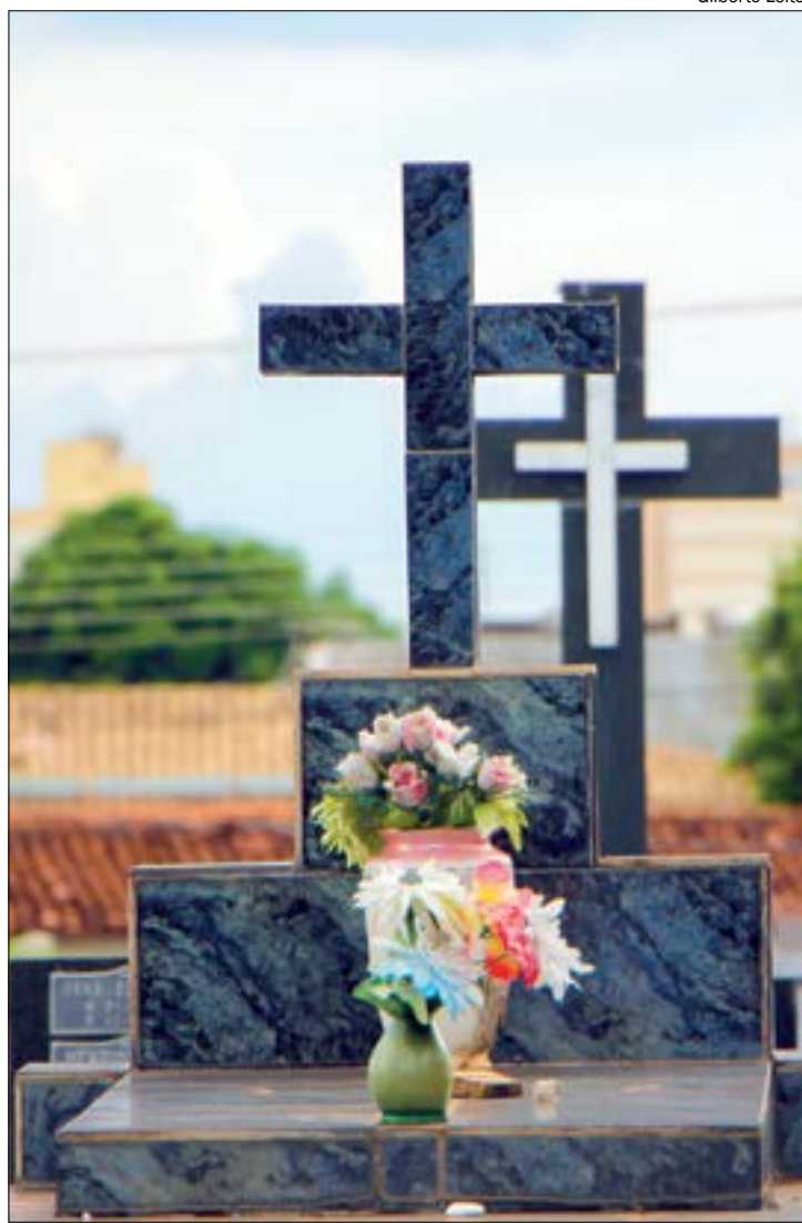
O uso de máscaras faciais segue obrigatório, bem como o distanciamento e uso do álcool em gel

"Que possamos prestar essa homenagem diante das pessoas falecidas e aos entes queridos na perspectiva da saudade, pois a saudade é o amor que fica