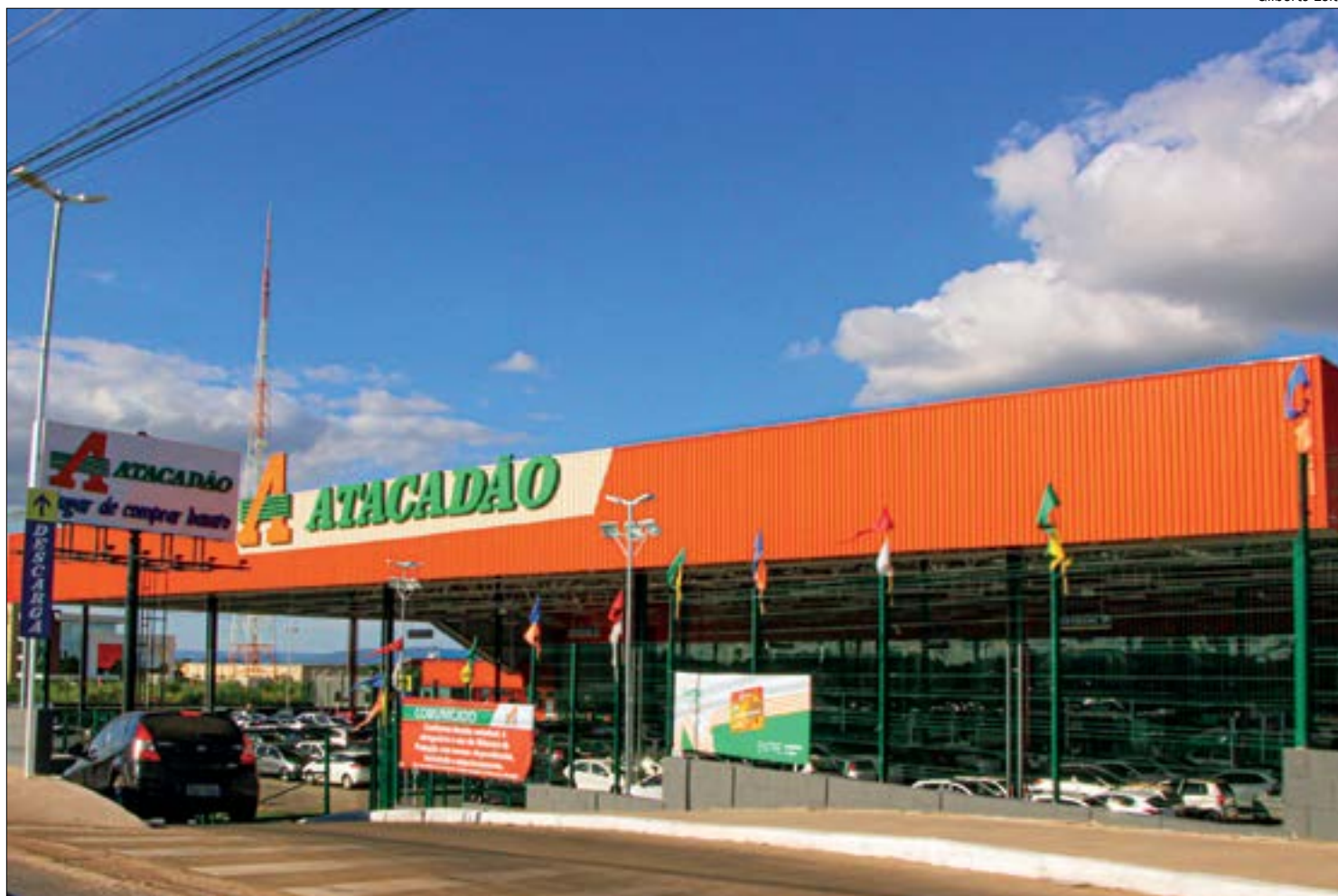
Em Mato Grosso, a conversão de lojas varejistas para atacado cresceu no último ano

Com poder de compra mais restrito, a população mato-grossense acompanha uma tendência nacional de comprar em lojas que ofereçam mais por menos. São atraídos pelas embalagens mais econômicas