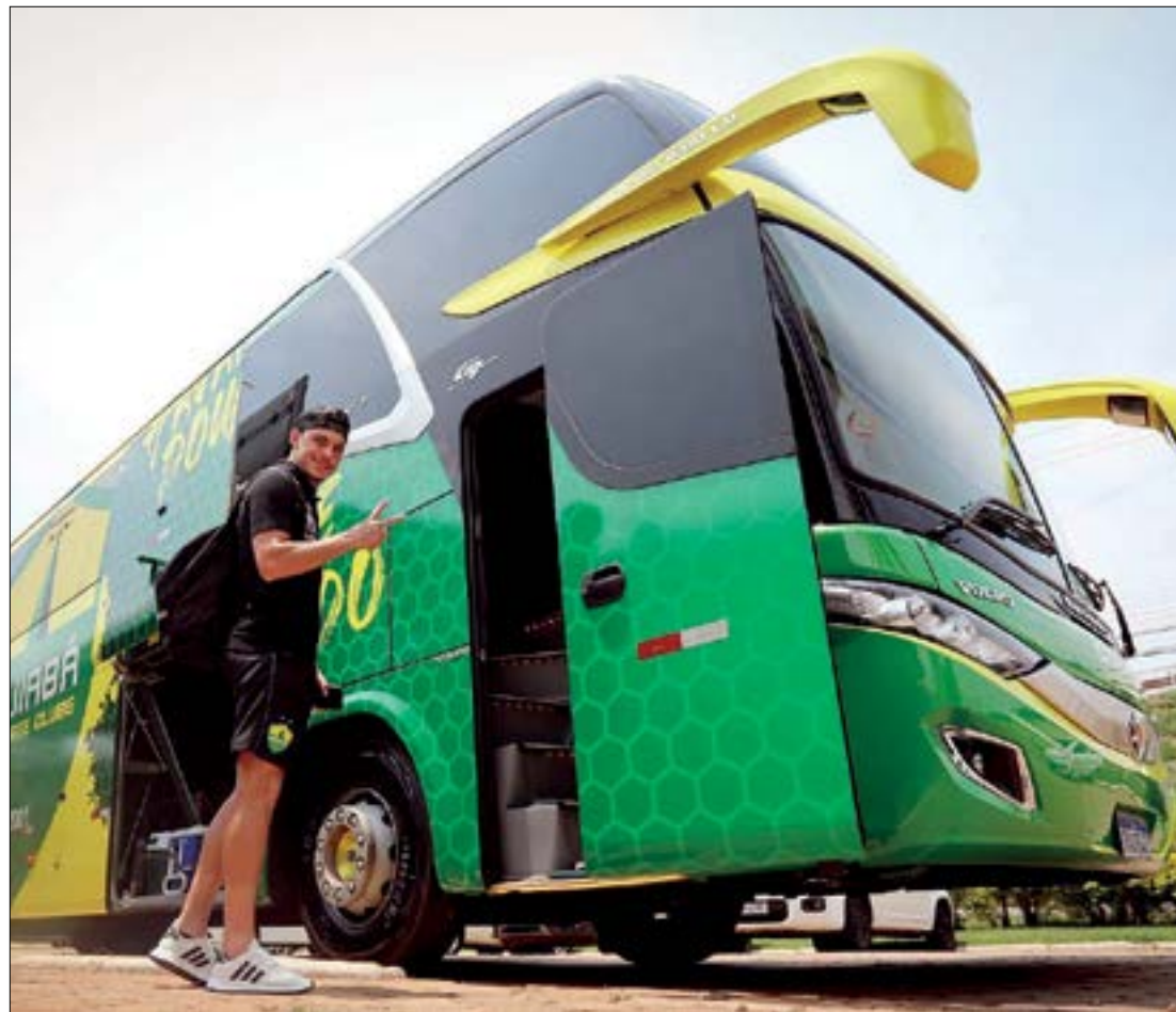
Após resultado positivo contra o Flamengo, jogadores estão confiantes para enfrentar o Galo

“Nossa equipe tem entendido bem o que é o campeonato. Tem jogos em que você tem um controle maior e tem a oportunidade de ter um pouco mais a bola. E existem jogos em que você tem que se defender mais e explorar os contra-ataques. Esse entendimento da competição tem gerado frutos pra nossa equipe e por isso que a