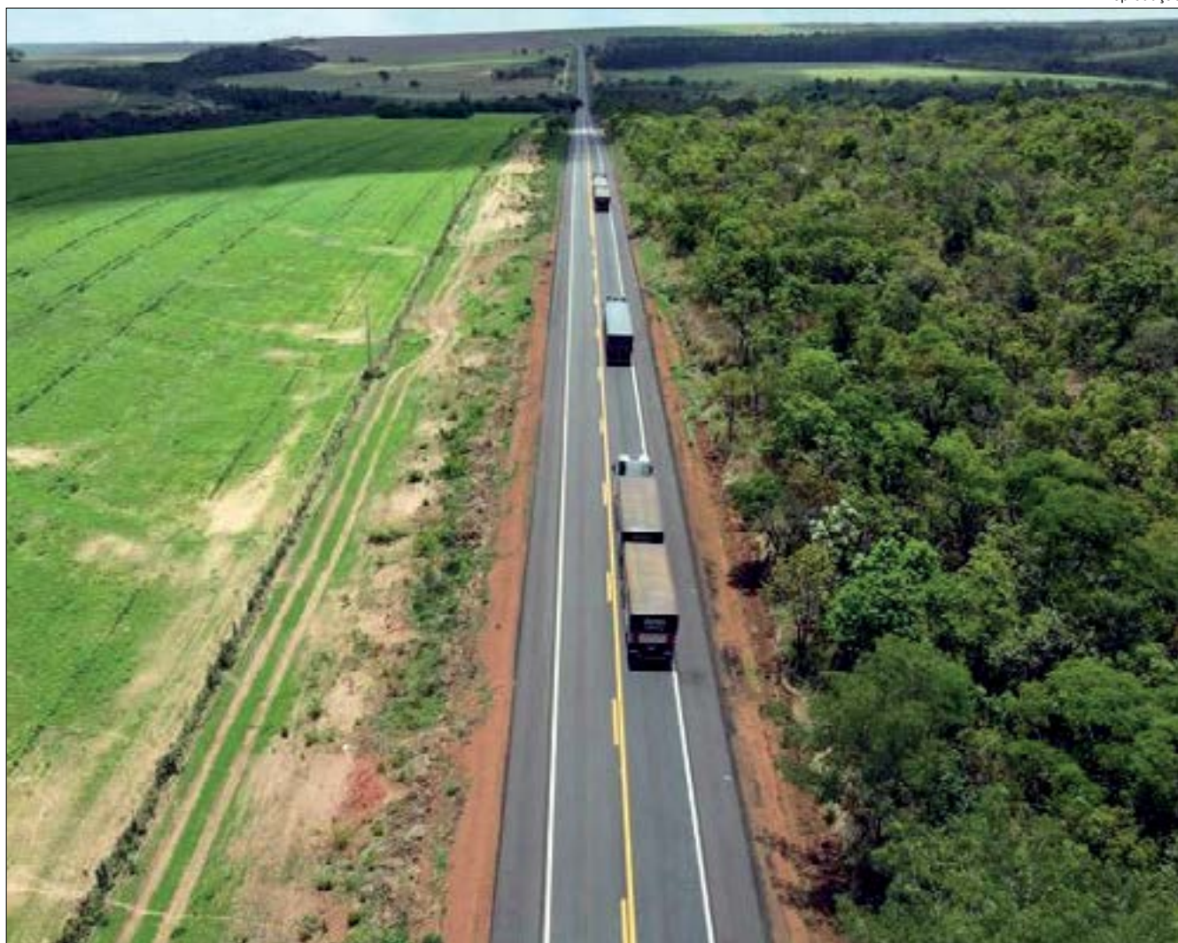
Até agora foram investidos pelo governo federal R$ 82,4 milhões na restauração desses 86,5 quilômetros da BR-364

Dentro do estado, o DNIT é responsável pela manutenção de 4,2 mil quilômetros de patrimônio público de malha federal implantada (BR-070, BR-158, BR-163, BR-174, BR-242 e BR-364).