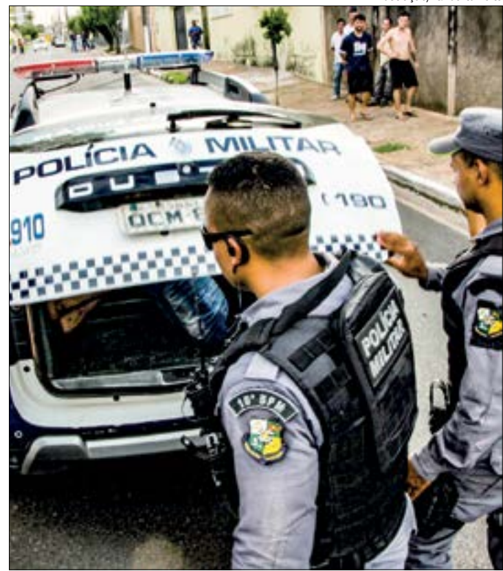
O suspeito era morador no condomínio e tentou fugir dos policiais que atiraram para impedir fuga