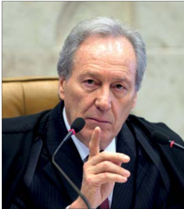
Lewandowski diz que incorporação do auxílio aos salários desvirtua a finalidade da verba indenizatória