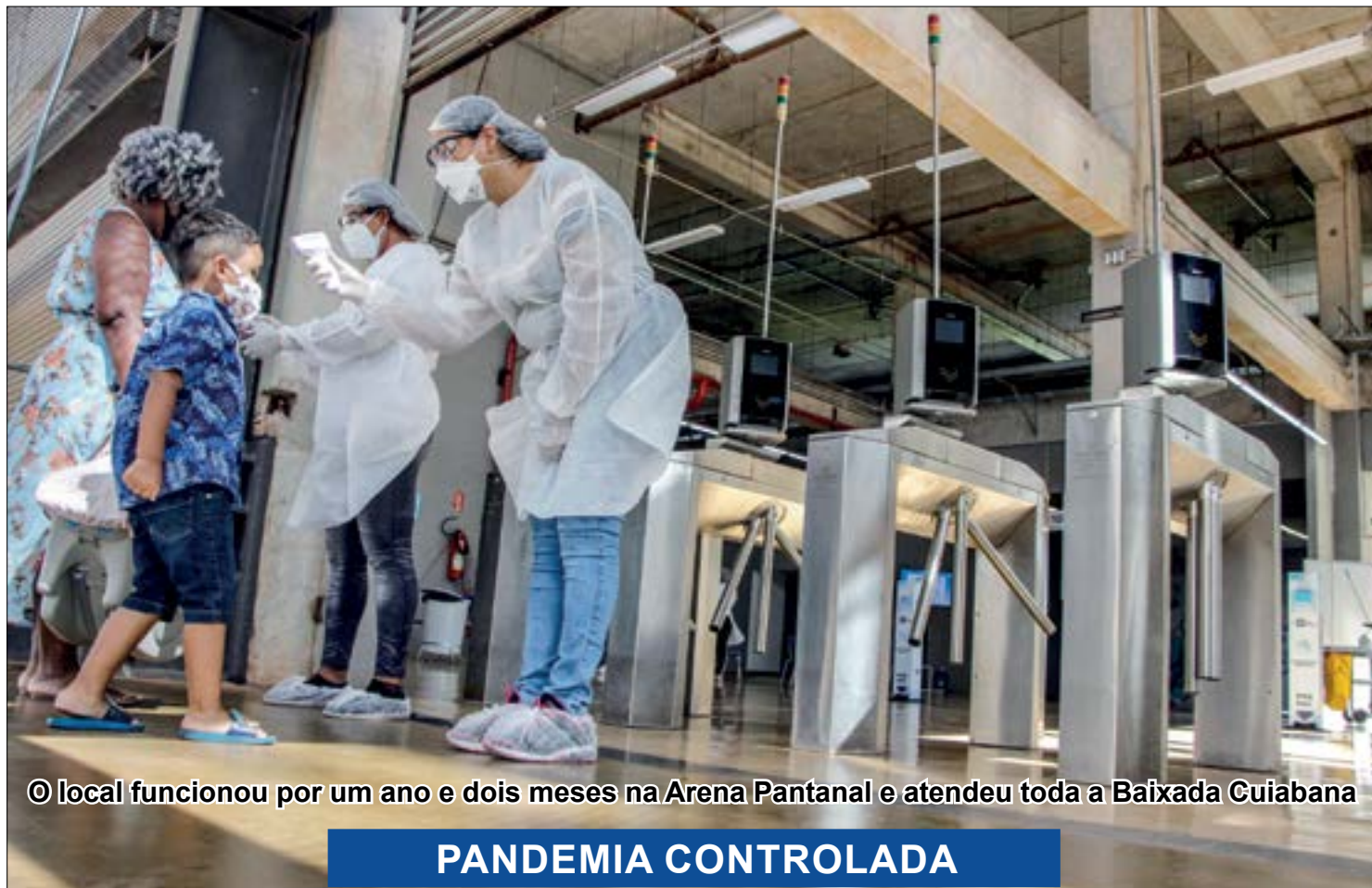
© local funcionou por um ano e dois meses na Arena Pantanal e atendeu toda a Baixada Cuiabana