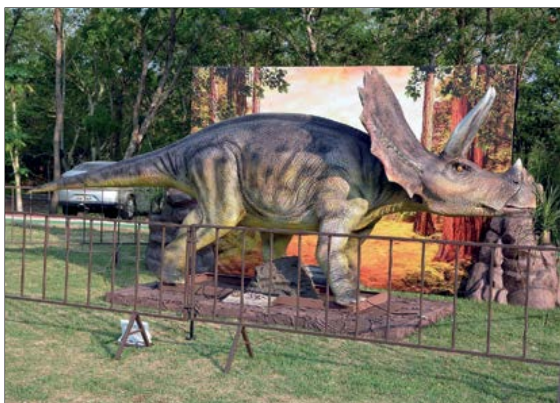
Dinossauros fazendo a alegria da criançada