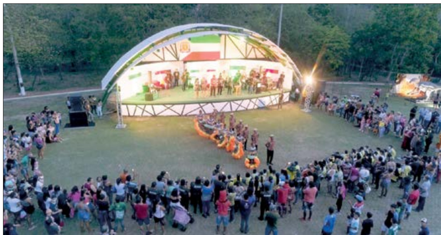
Na abertura oficial aconteceram apresentações culturais em grande estilo