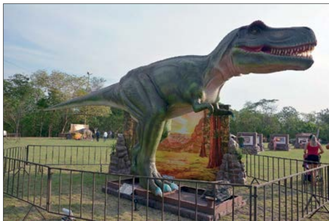
Dinossauros gigantes são atração em Várzea Grande