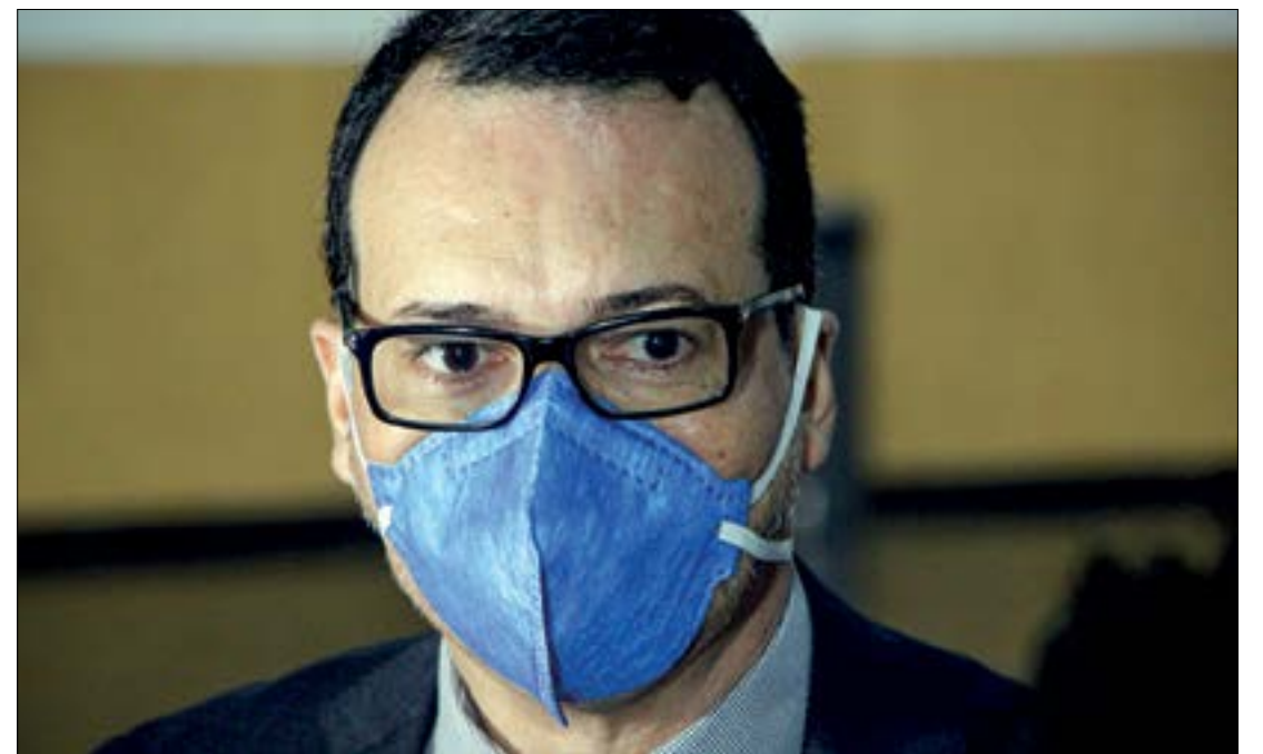
Lúdio afirma que assunto da RGA não será resolvido nem com votação da LOA