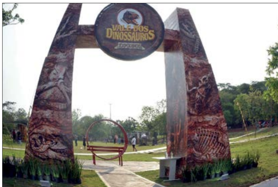
A entrada da Exposição Vale dos Dinossauros