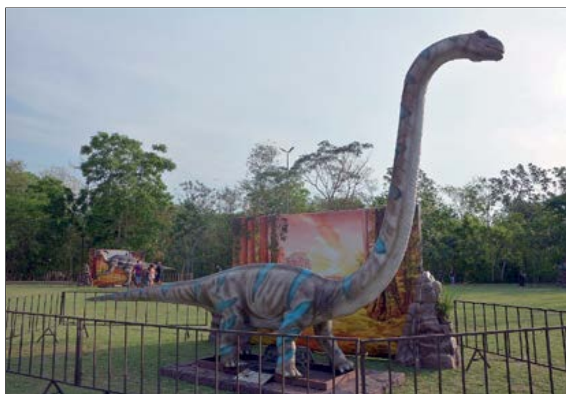
Exposição perfeita é também oportunidade de curtir a natureza no Parque Berneck, riqueza ambiental de Várzea Grande