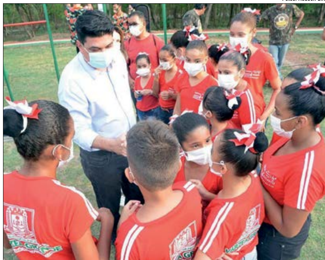
Prefeito de Várzea Grande Kalil Baracat fazendo a alegria da criançada

A exposição Vale dos Dinossauros estará aberta ao público todos os dias, das 17h30 às 19h e no sábado, domingo e feriados das 7h30 às 19h. A entrada é gratuita.