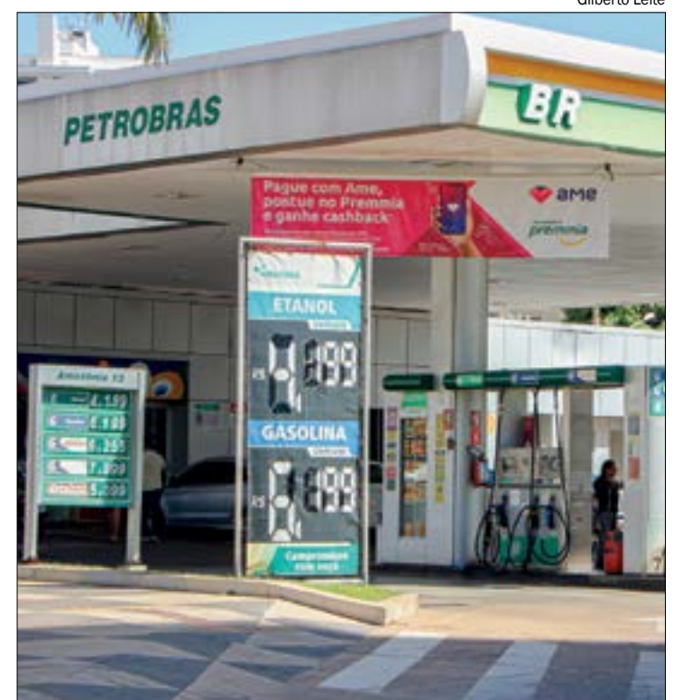
Governador afirma que reduções de impostos não serão suficientes para conter aumentos da Petrobras

A tendência é que essa mudança no imposto vire um ‘tiro pela culatra’, resultado em uma carga adicional de R$ 17 bilhões em ICMS, paga pelos motoristas.