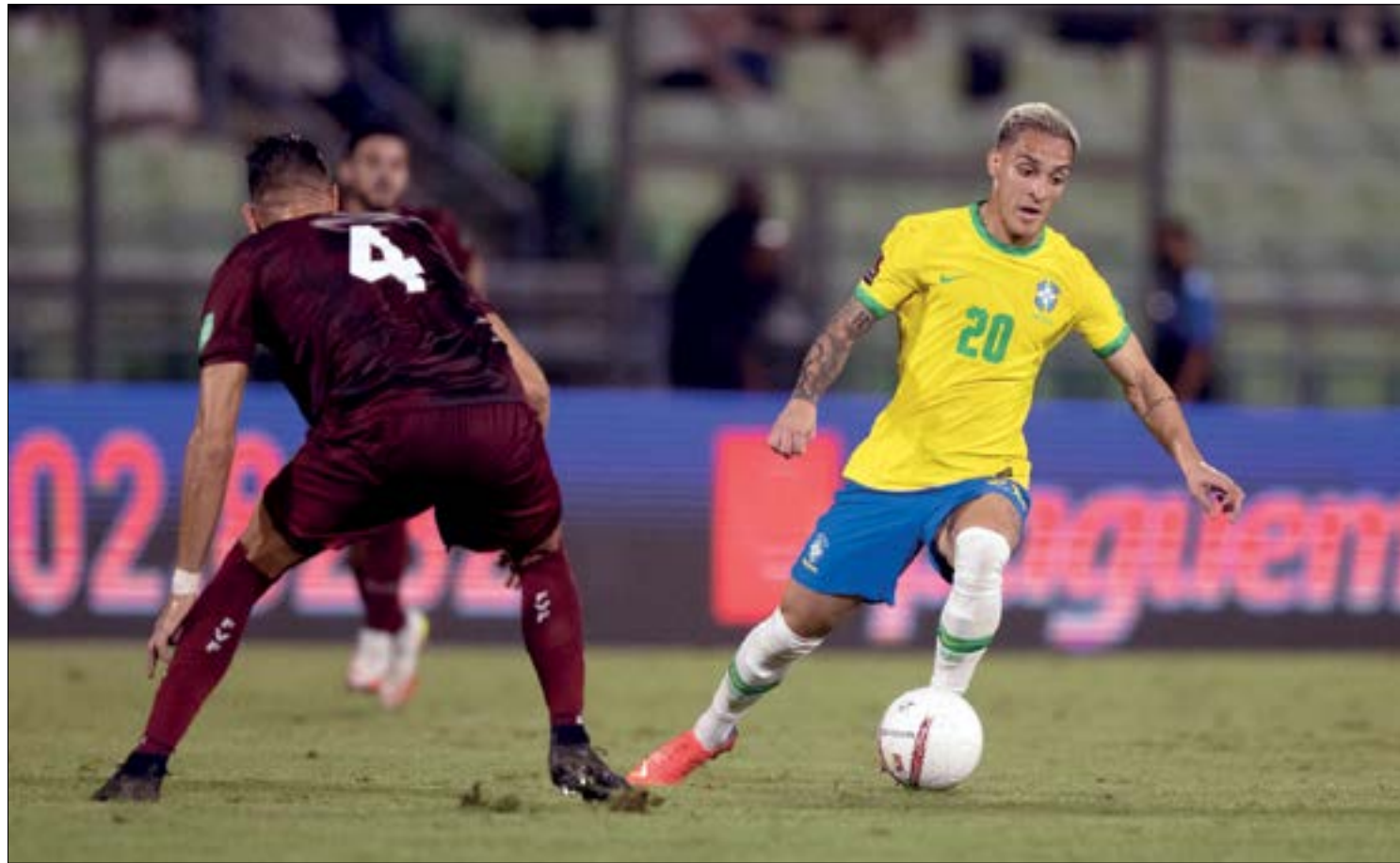
Mais uma vez, Tite precisou recorrer aos estreantes para conseguir mudar os rumos da partida