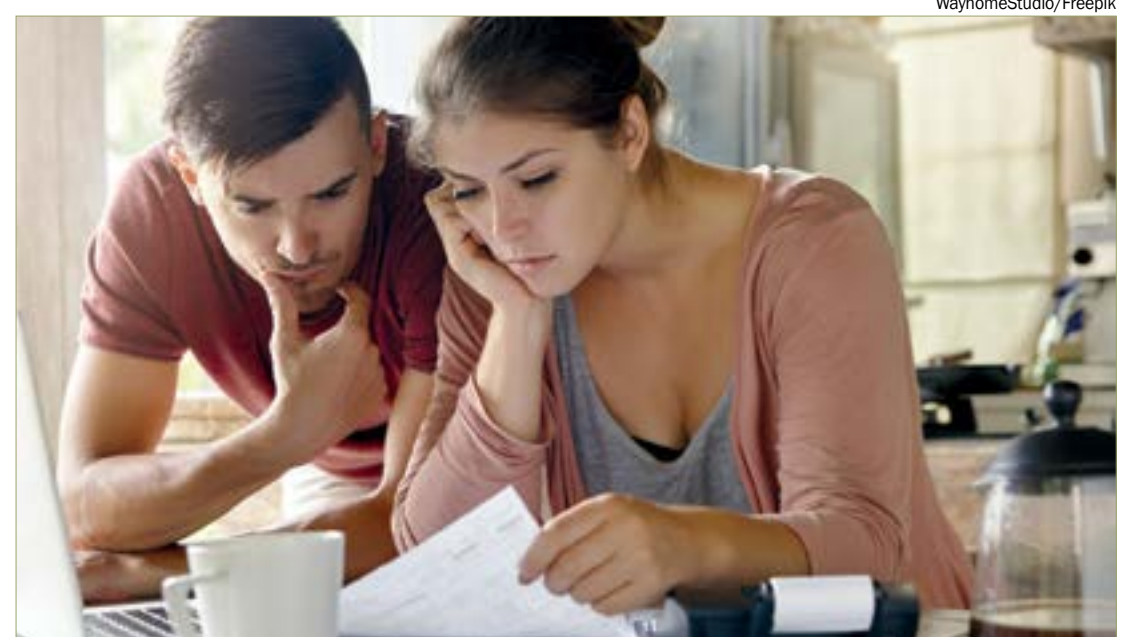
Número de famílias com dívidas parceladas aumentou, mas inadimplência recuou em setembro