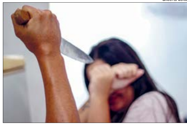
A vítima tentou fugir pulando a laje de uma casa de mais de 2m de altura para não ser morta