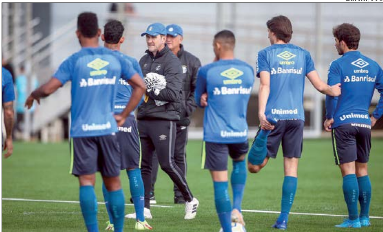
Postura de Felipão como técnico e suas propostas de jogo são questionadas pelos jogadores