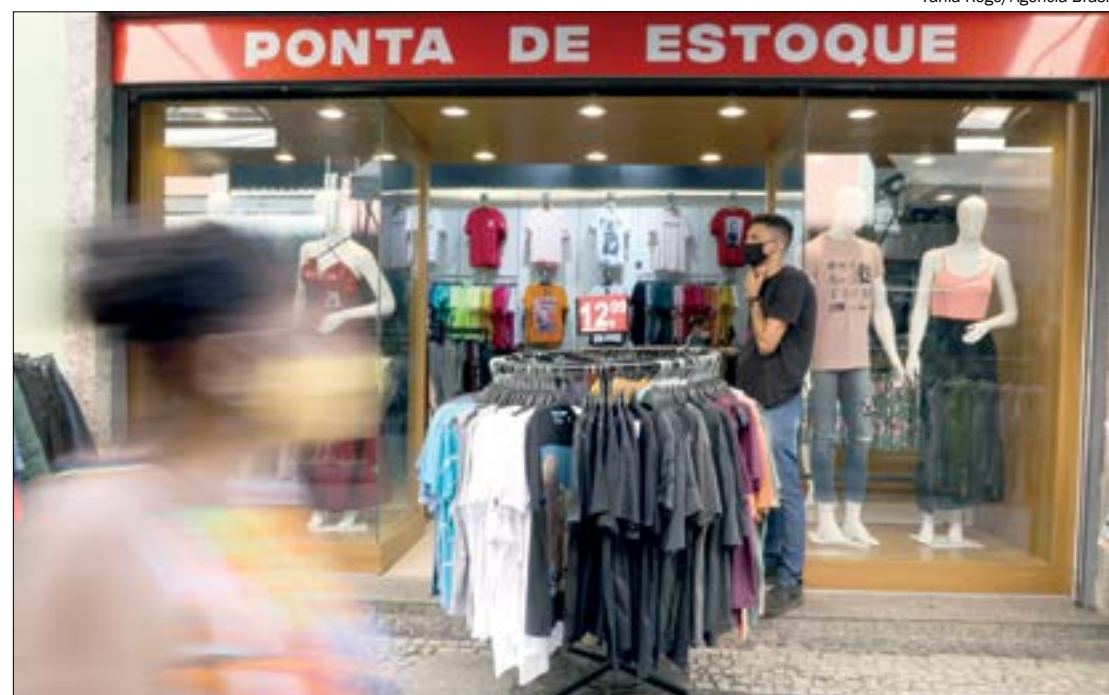
Comércio foi o principal gerador de empregos no último ano, segundo o Ipea