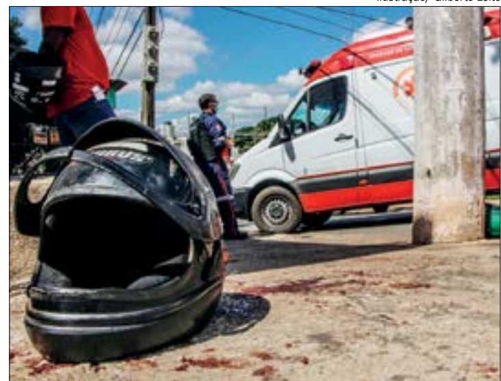
Débora foi atropelada quando a motorista da caminhonete fazia uma conversão para entrar em residencial