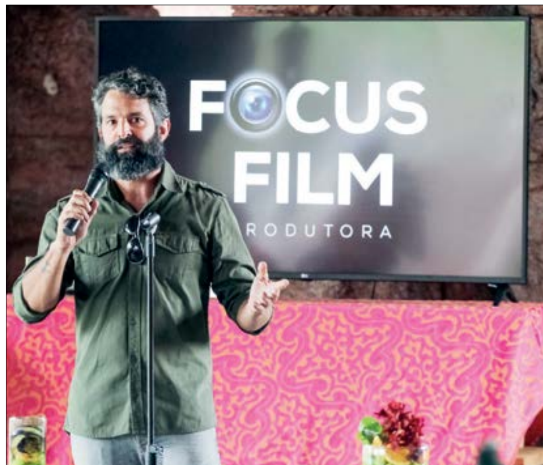
O ator Iran Malfitano é o ator principal do filme Oi Alice 2