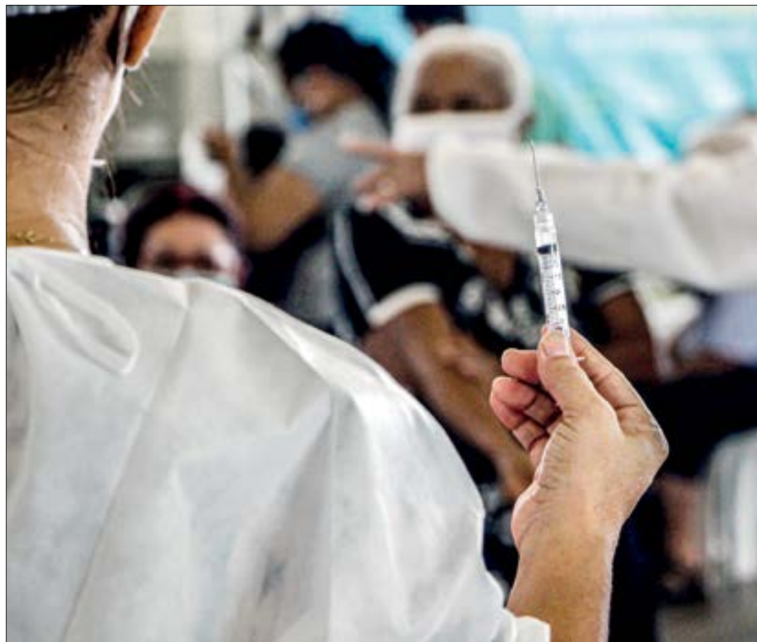
O segundo maior grupo de não vacinados compreende as pessoas de 18 a 19 anos, com 3.026 pessoas

Já o segundo maior grupo, compreende as pessoas