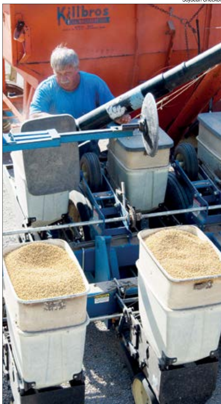
Plantio da safra 2021/22 é um dos mais adiantados nos últimos cinco anos, segundo o Inmet

"A semeadura da soja teve um início adiantado em MT na safra 2021/22. Com o fim do vazio sanitário no último dia 15.09 em Mato Grosso, os sojicultores aproveitaram o acúmulo de umidade no solo para