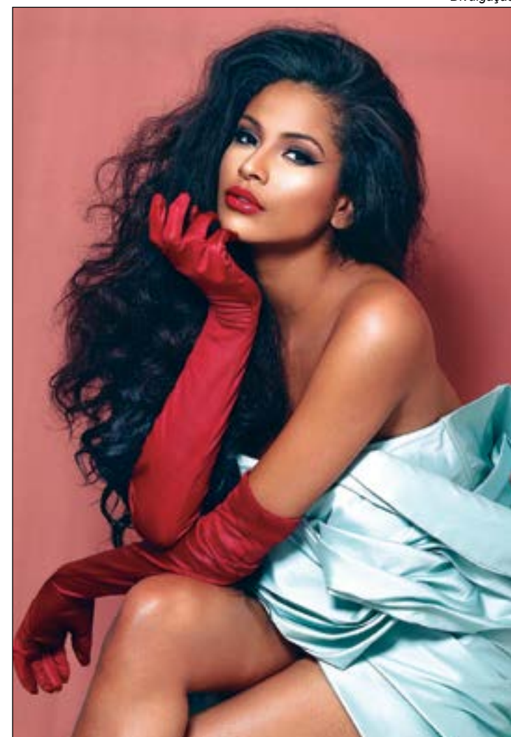
A Miss Brasil 2017 Monalysa Alcantara, belíssima e sexy, enfeita a coluna e é presença confirmada no Miss Universo Mato Grosso