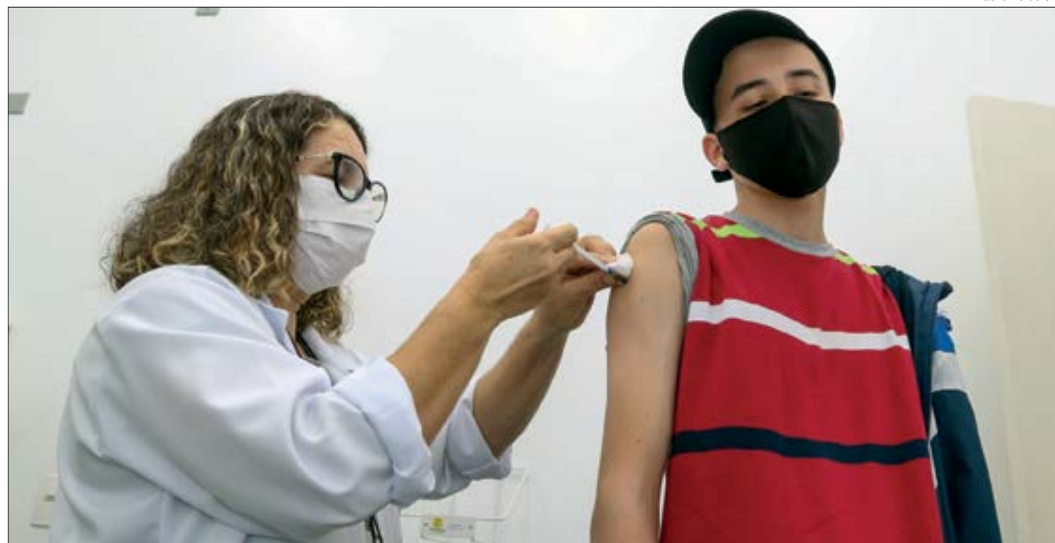
Prefeitos serão orientados a suspenderem a vacinação contra a covid-19 para adolescentes com idades entre 12 e 17 anos

*Estagiário sob a supervisão da editora Cátia Alves