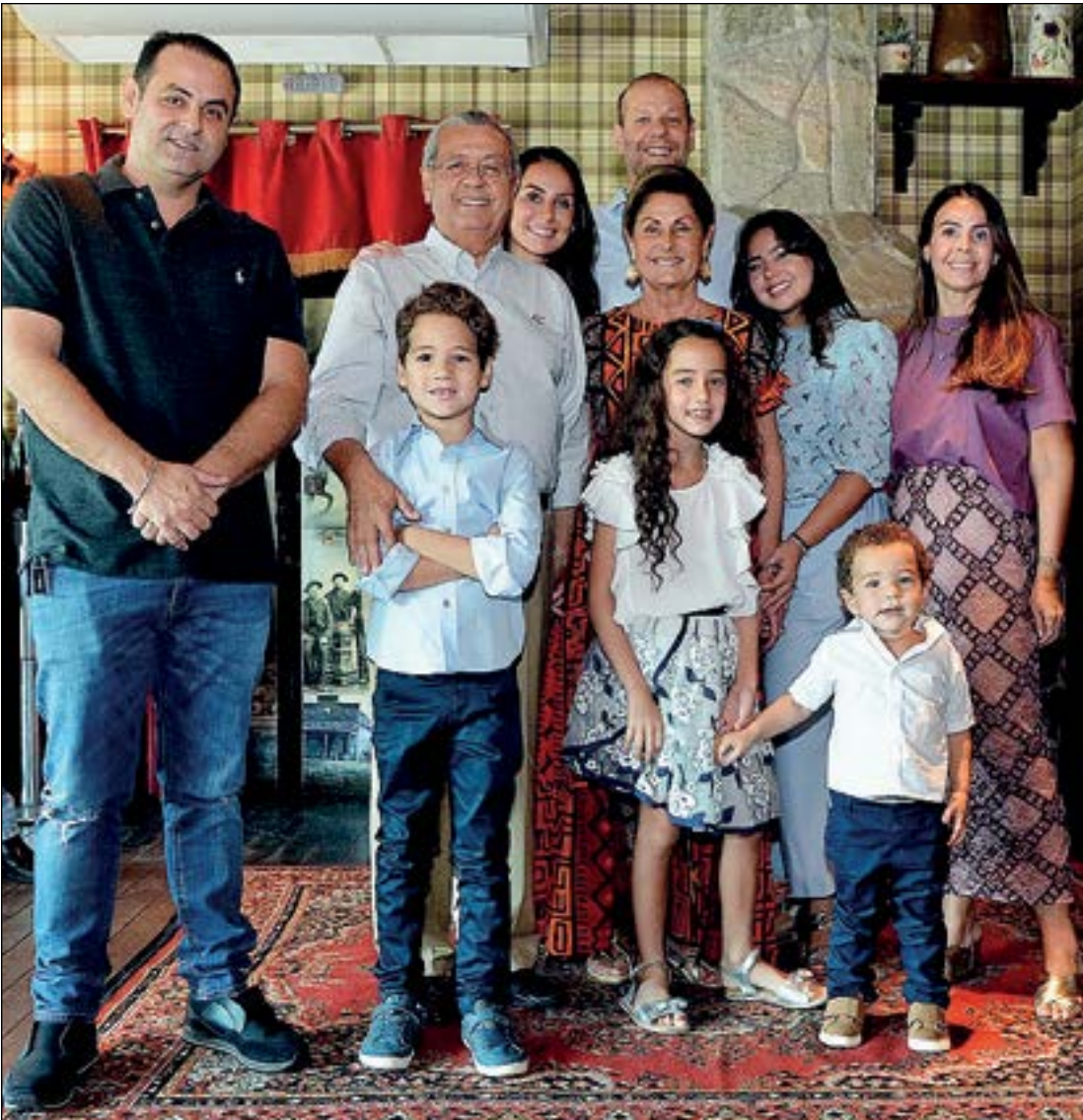
O senador Jayme Campos, rodeado pela sua querida família na comemoração dos seus 70 anos