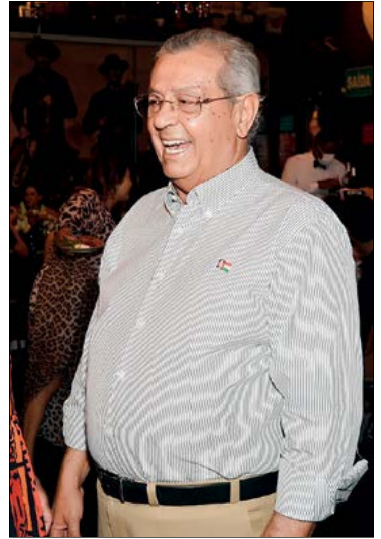
Cheio de alegria e vitalidade, o Senador Jayme Campos