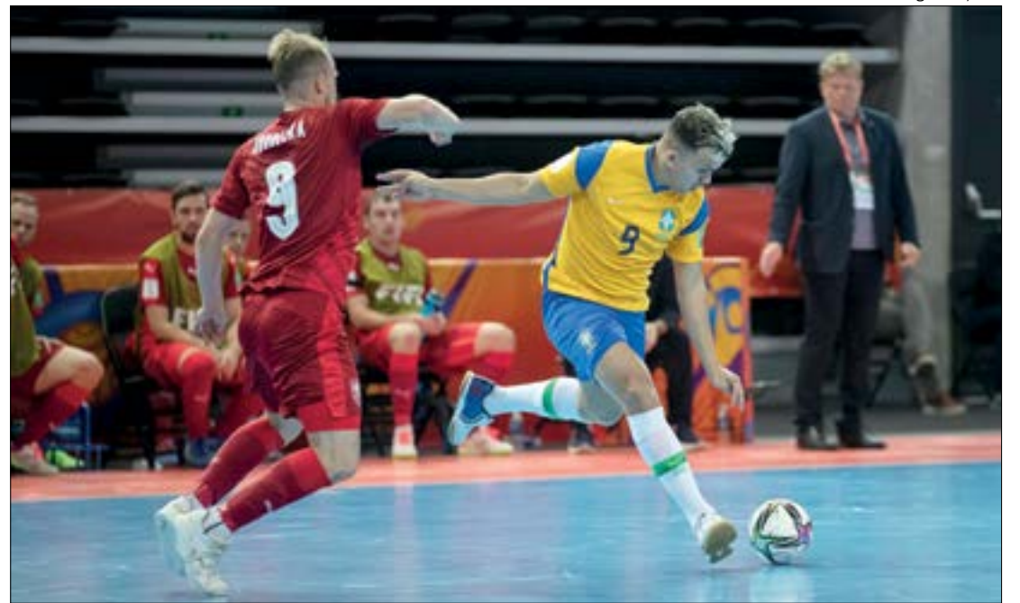
Vitória sobre os tchecos praticamente garante a vaga do Brasil nas oitavas de final