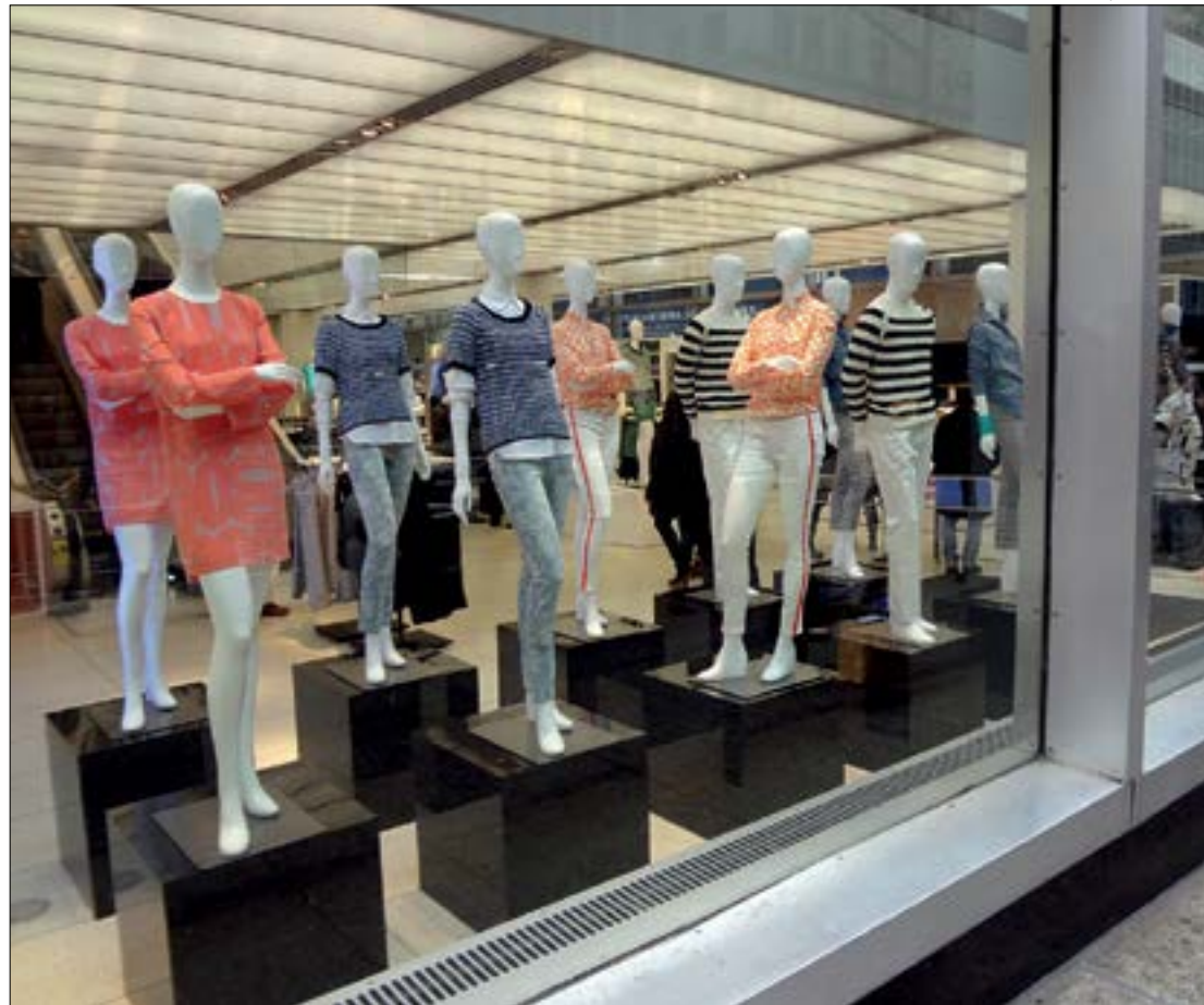
Esse foi o quarto crescimento mensal de 1,9%, mas índice ainda é abaixo do nível de satisfação