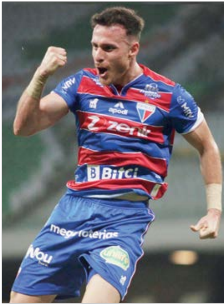
Desempenho histórico do Fortaleza mostra que o futebol brasileiro vive novos tempos