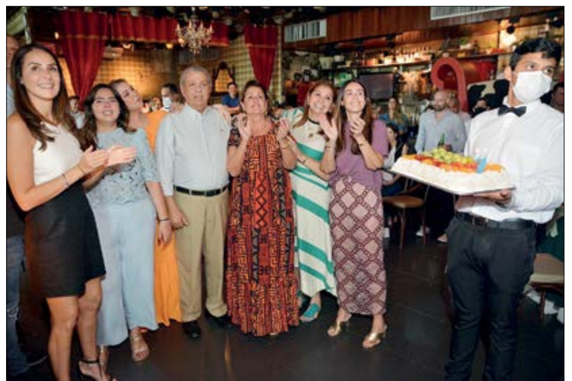
A hora dos parabéns com a família e amigos, todos reunidos