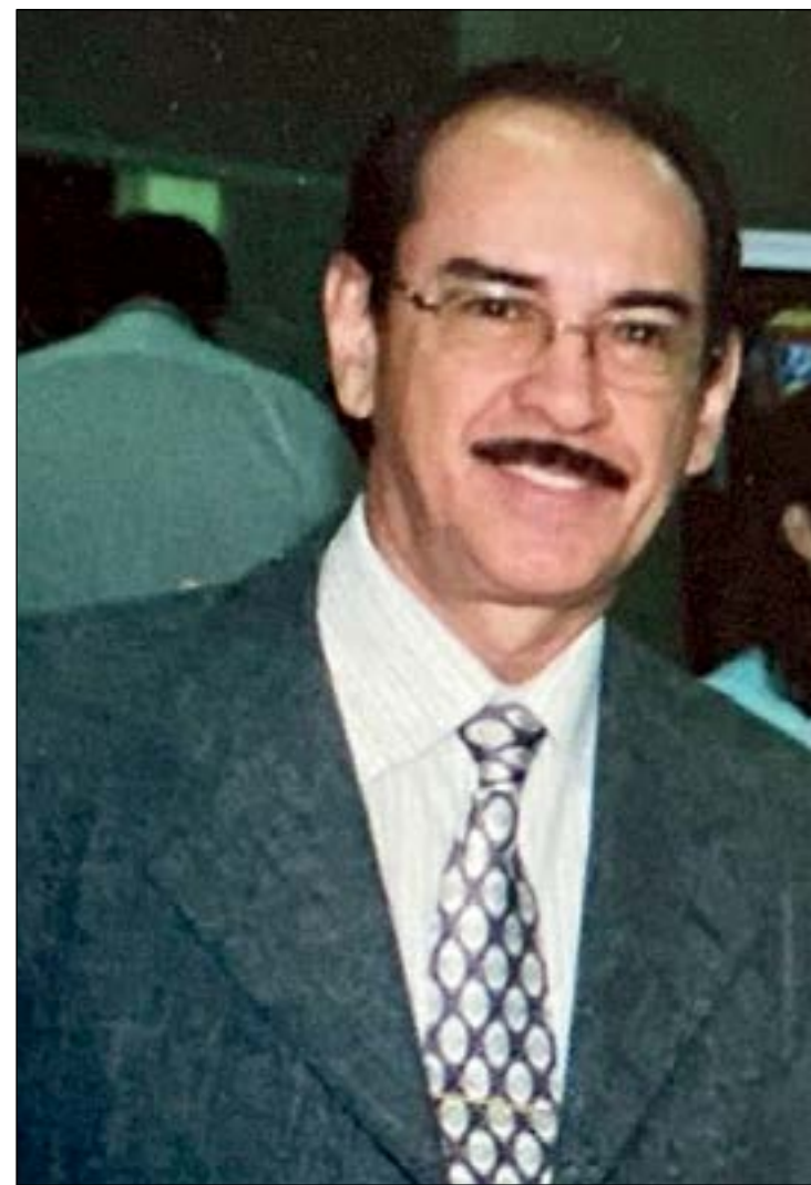
Colegas e amigos homenageiam procurador com mensagens sobre sua carreira e profissionalismo