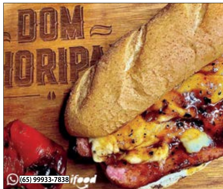
(65) 99933-7838 food