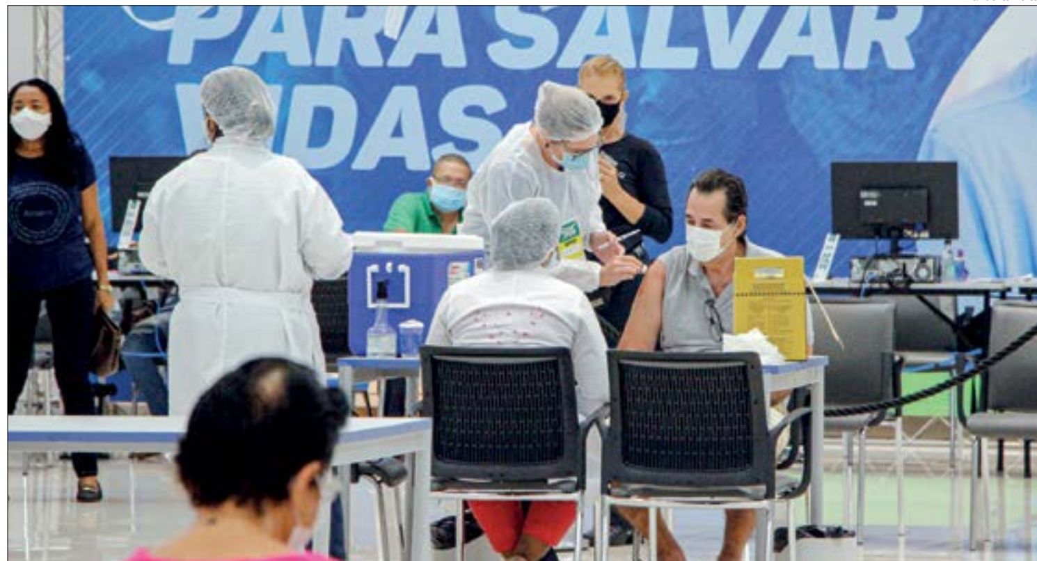
Prefeitura ainda não tem previsão de quando começará a aplicar 3ª dose, pois não recebeu remessas para essa finalidade