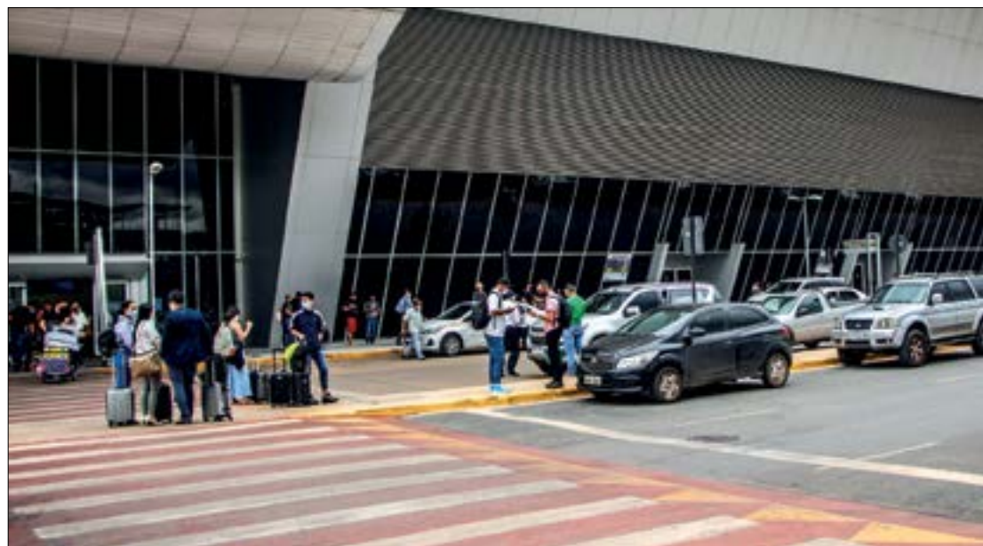
Empresas que atenderem até 7 municípios têm redução de 84% de ICMS