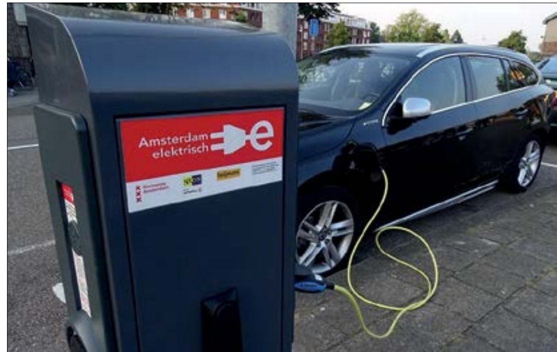
Segundo a pesquisa, 89,7% dos consumidores queriam carros elétricos como opção de compra