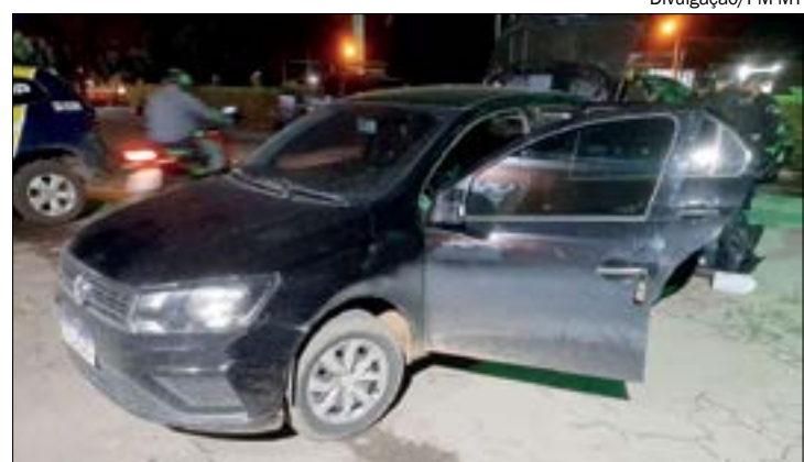
Suspeitos foram interceptados na BR-163, próximo a Rosário Oeste