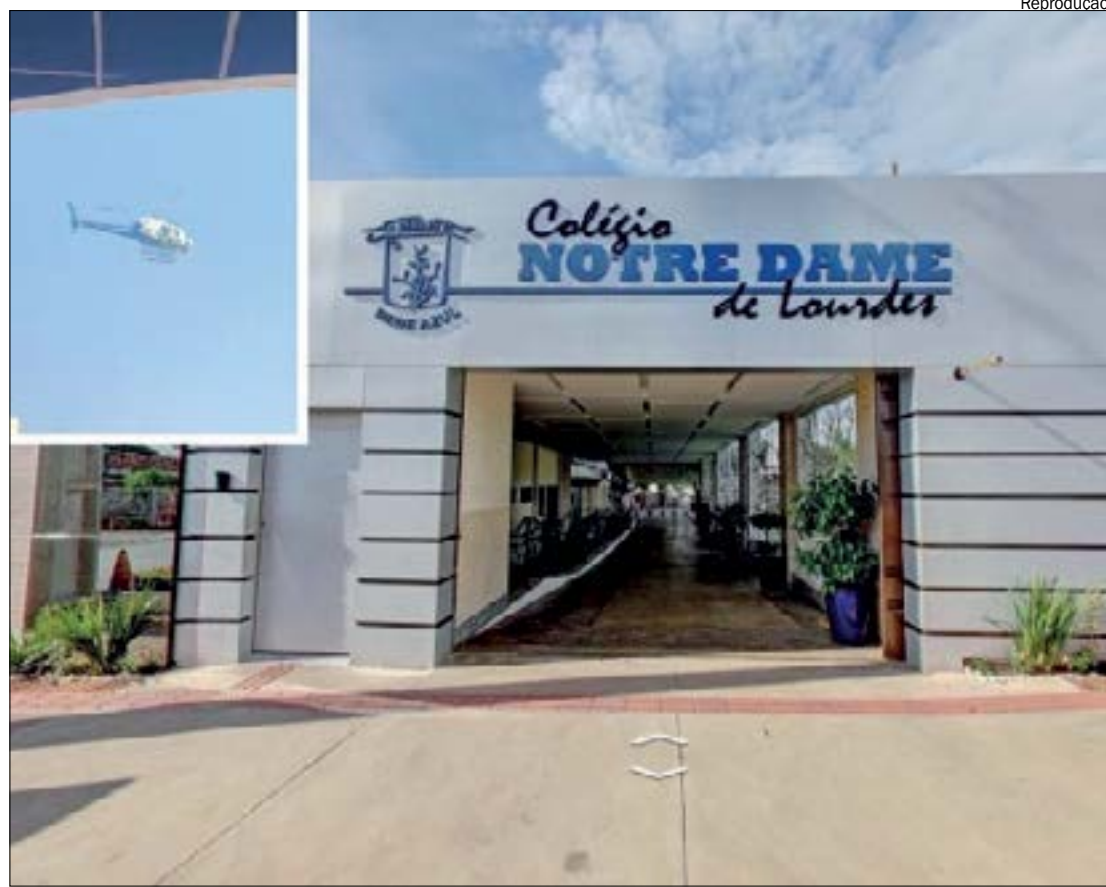
Grupo questiona como a diretora da escola particular conseguiu a liberação de aeronave pública

*Estagiário sob supervisão do editor Gabriel Soares