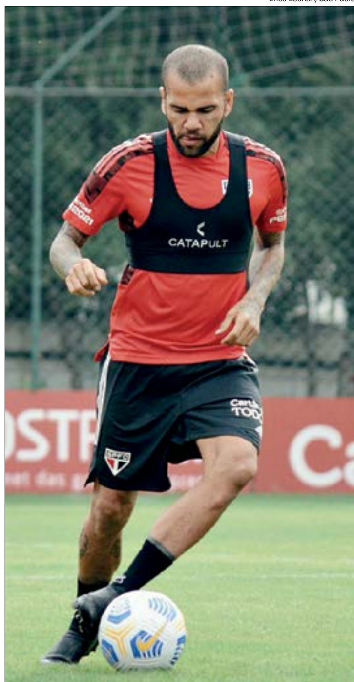
Daniel Alves quis fazer 'greve' por dívida e diretoria do São Paulo respondeu com um corte definitivo no relacionamento

- Aos 38 anos, Daniel Alves ainda quer disputar sua última Copa do Mundo em 2022. Para isso, ele tem que se manter ativo nos gramados. Como ele só jogou seis partidas pelo Tricolor Paulista durante a temporada deste ano, há possibilidade de que o defensor acerte com algum clube brasileiro. Contudo, a tendência é que ele busque contrato com algum clube do exterior, para se manter jogando em alto nível.