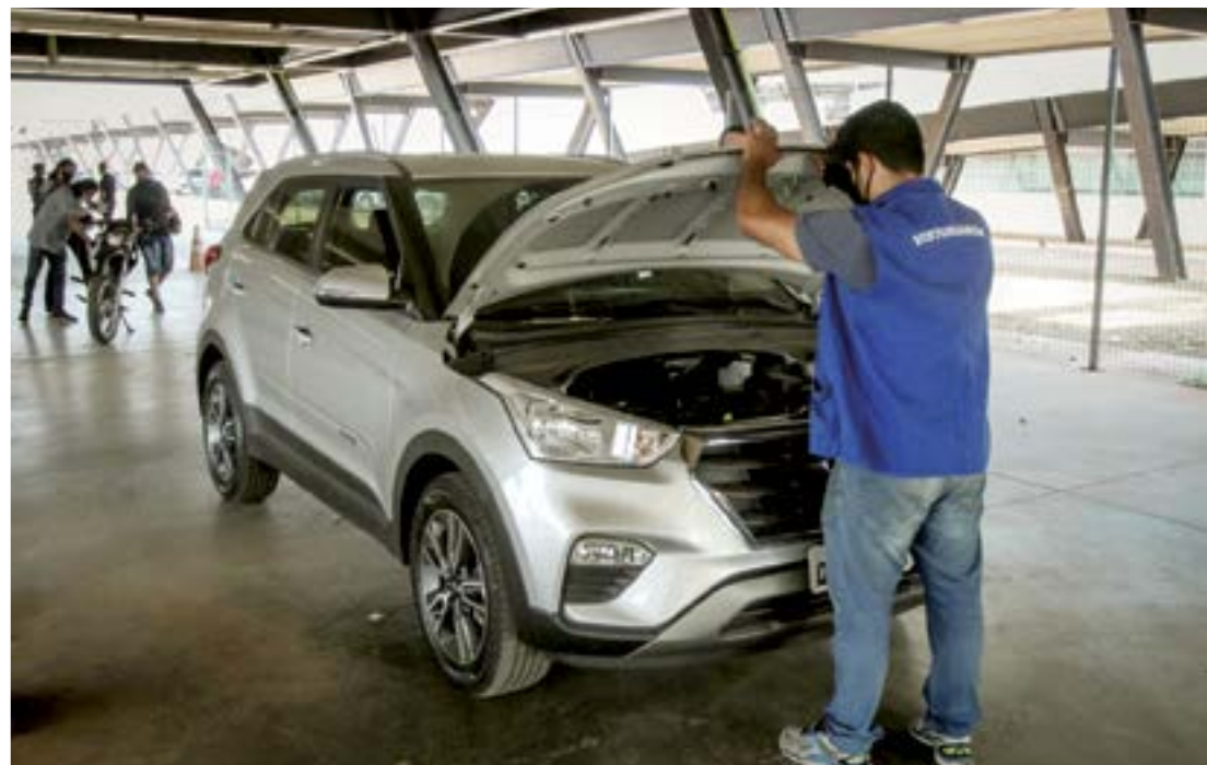
Aumento nos emplacamentos sinaliza melhora no setor de automóveis