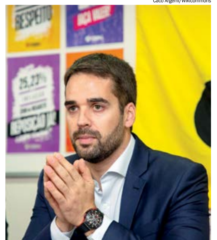
Eduardo Leite é cotado com uma das principais opções para a terceira via em 2022

Além de Eduardo Leite, o governador de São Paulo, João Dória, também busca aprovação interna do PSDB para ser candidato à presidência em 2022. Os dois estão viajando o país para conversar com a militância do partido em busca de viabilizar suas candidaturas. Também disputam a prévias do PSDB o senador Tasso Jereissati e o prefeito de Manaus, Arthur Virgílio Neto.