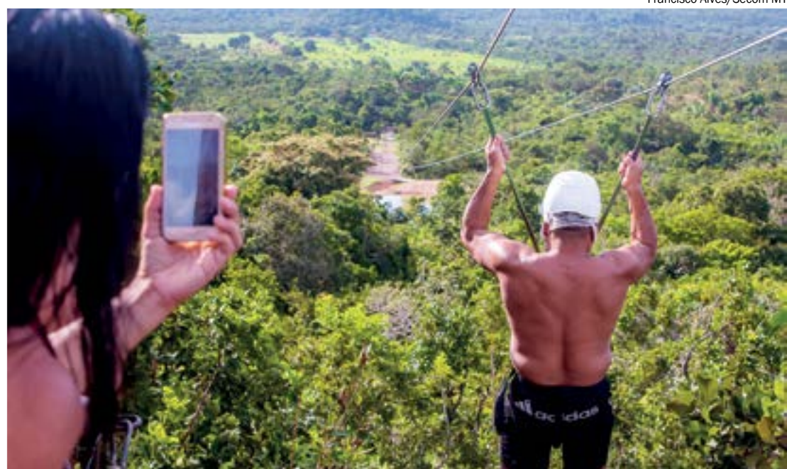
Qualificação de guias busca melhorar qualidade do serviço ofertado a turistas