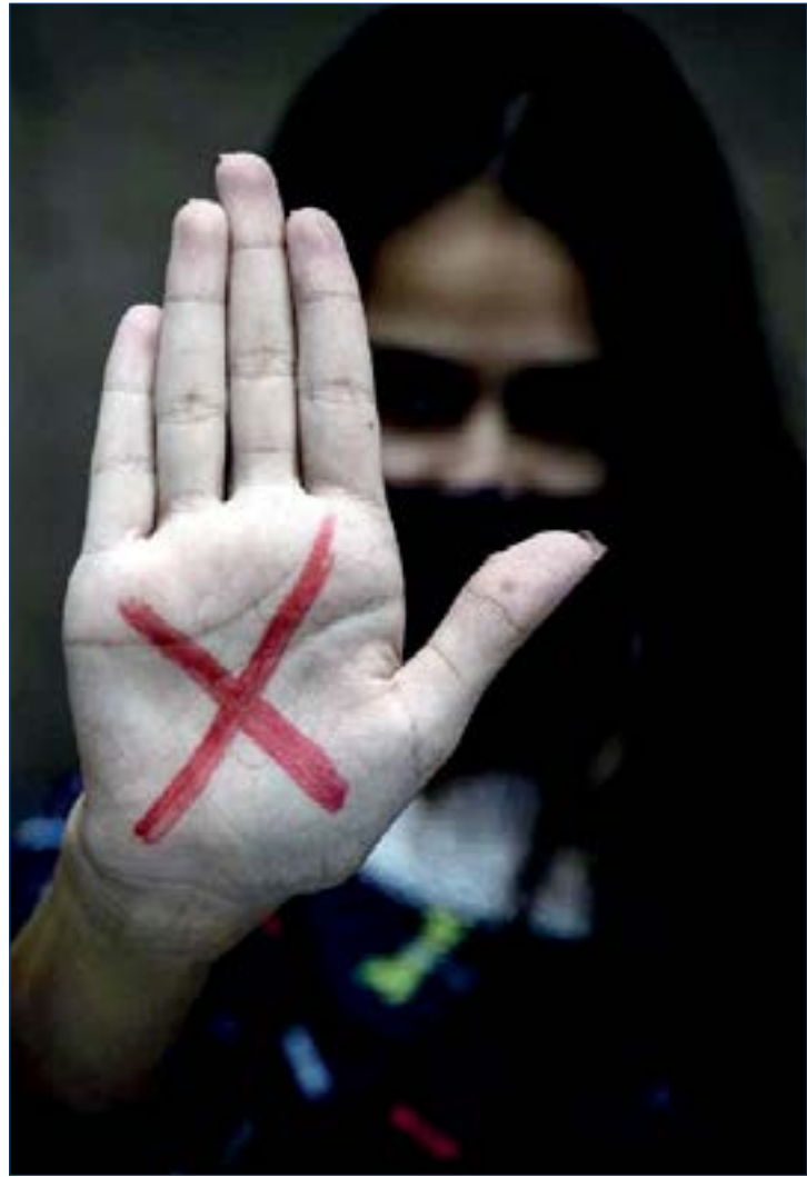
Aumento de crimes sexuais foi percebido em todo o estado; estupro é o único que teve redução