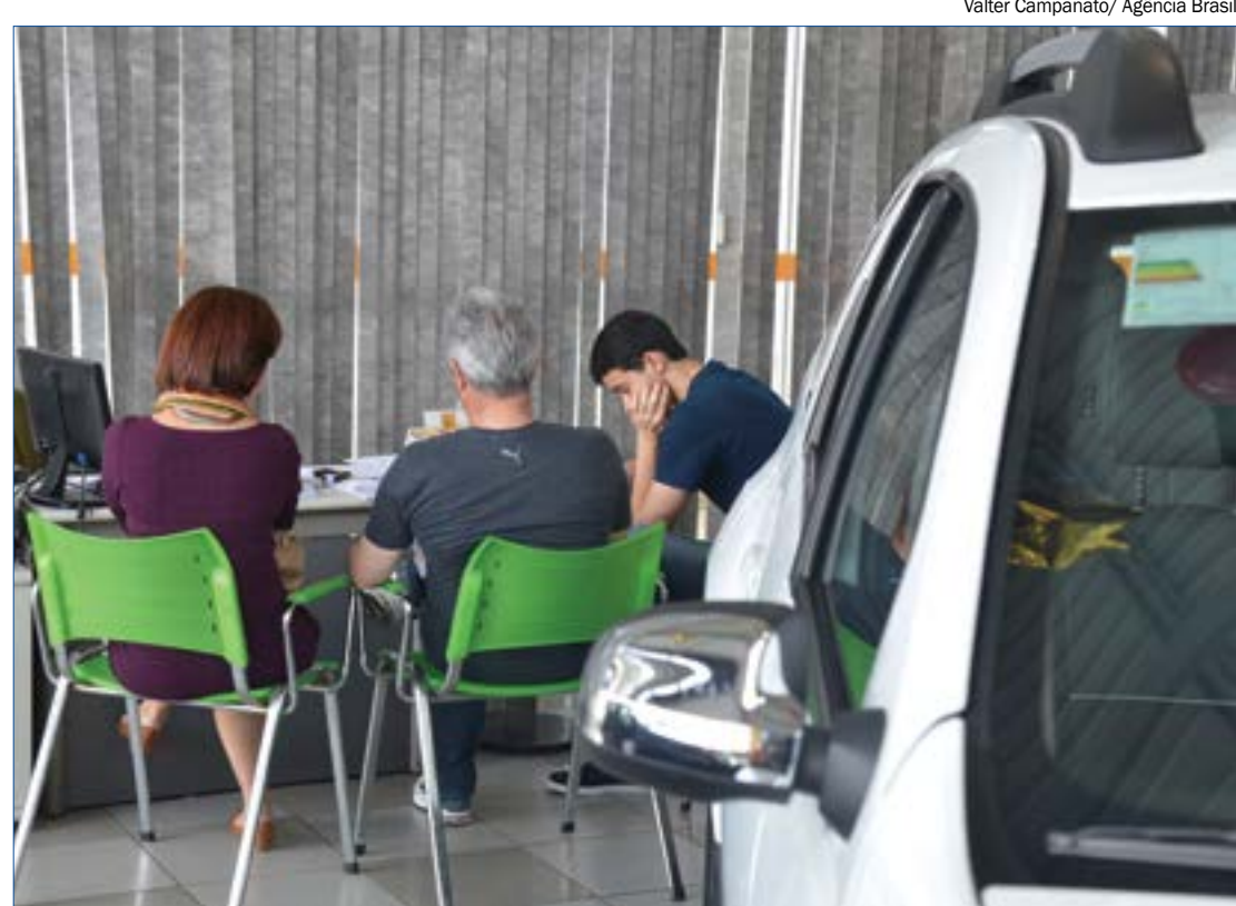
Valorizados por causa dos problemas da indústria, IPVA de carros usados deve subir em 2022

*Estagiário sob supervisão do editor Gabriel Soares