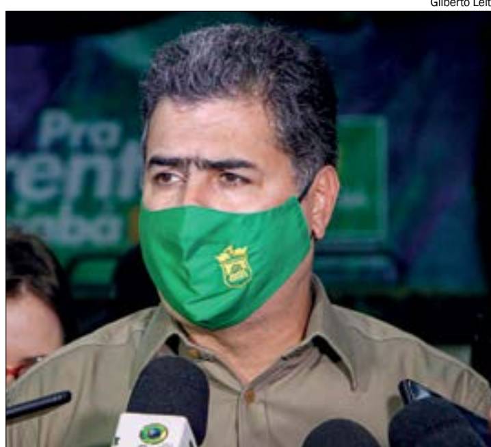
Emanuel afirma que já gastou R$ 1,6 milhão com kits alimentação e terá novo gasto para garantir a merenda escolar

“Assim sendo, terá o Município de Cuiabá gastos em duplicidade, na ordem de R$ 1.628.484,00. Isso porque já teve este ente, conforme documen-