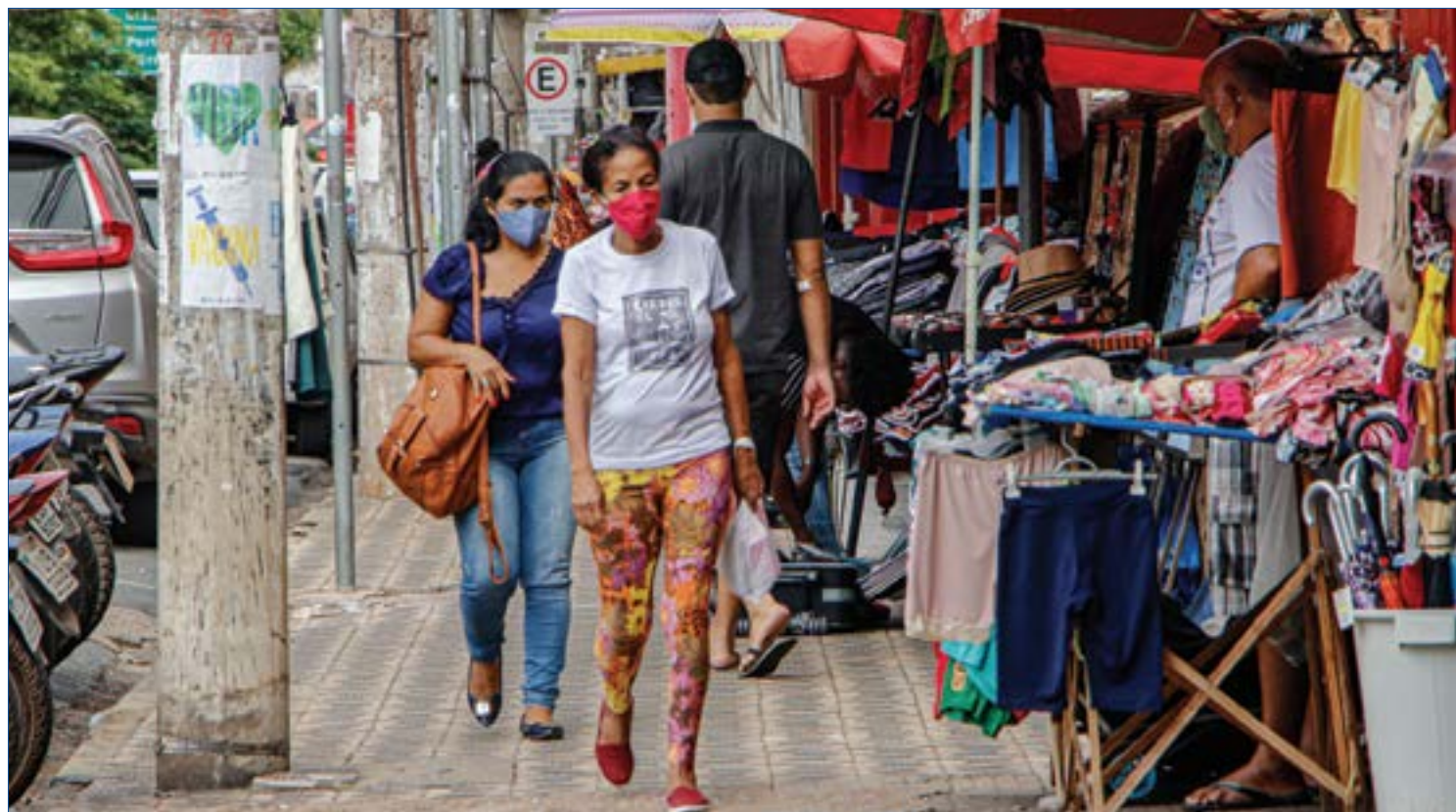
Pesquisa aponta que cerca de 1 em cada 6 cuiabanos se submetem à informalidade para garantir o sustento