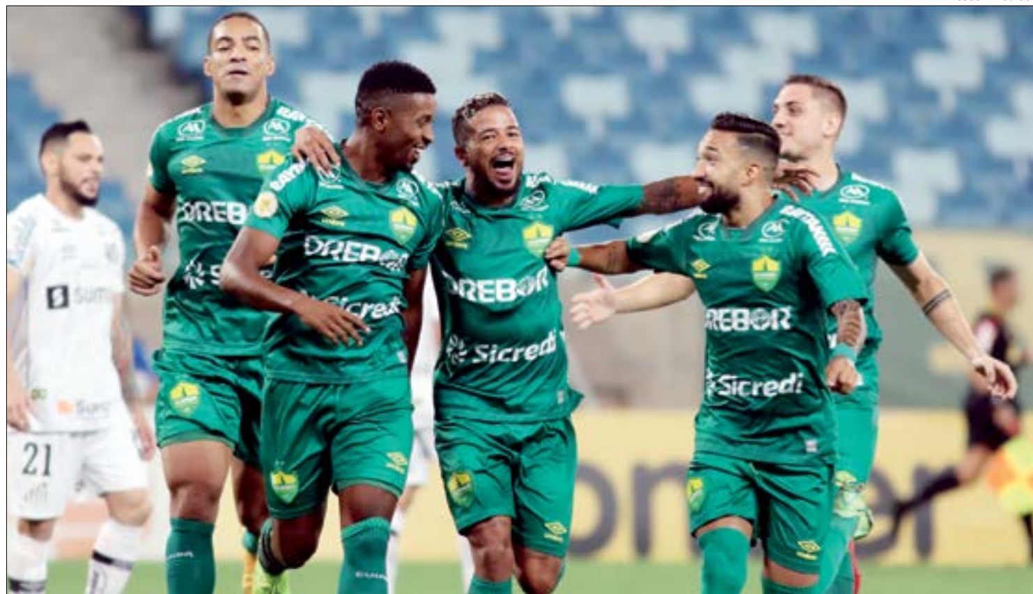
Vitória sobre o Santos deixa Cuiabá entre os 10 primeiros do Brasileirão e faz torcida sonhar com vaga na Sul-Americana