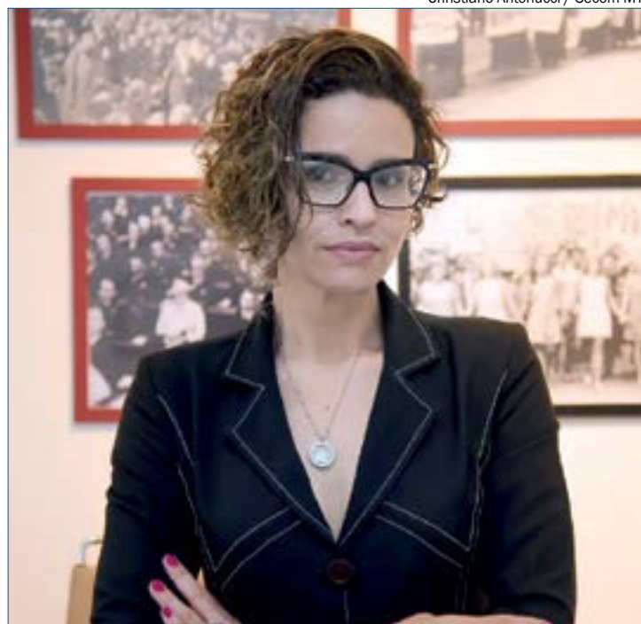
Advogada explica mudanças recentes nas leis de crimes sexuais