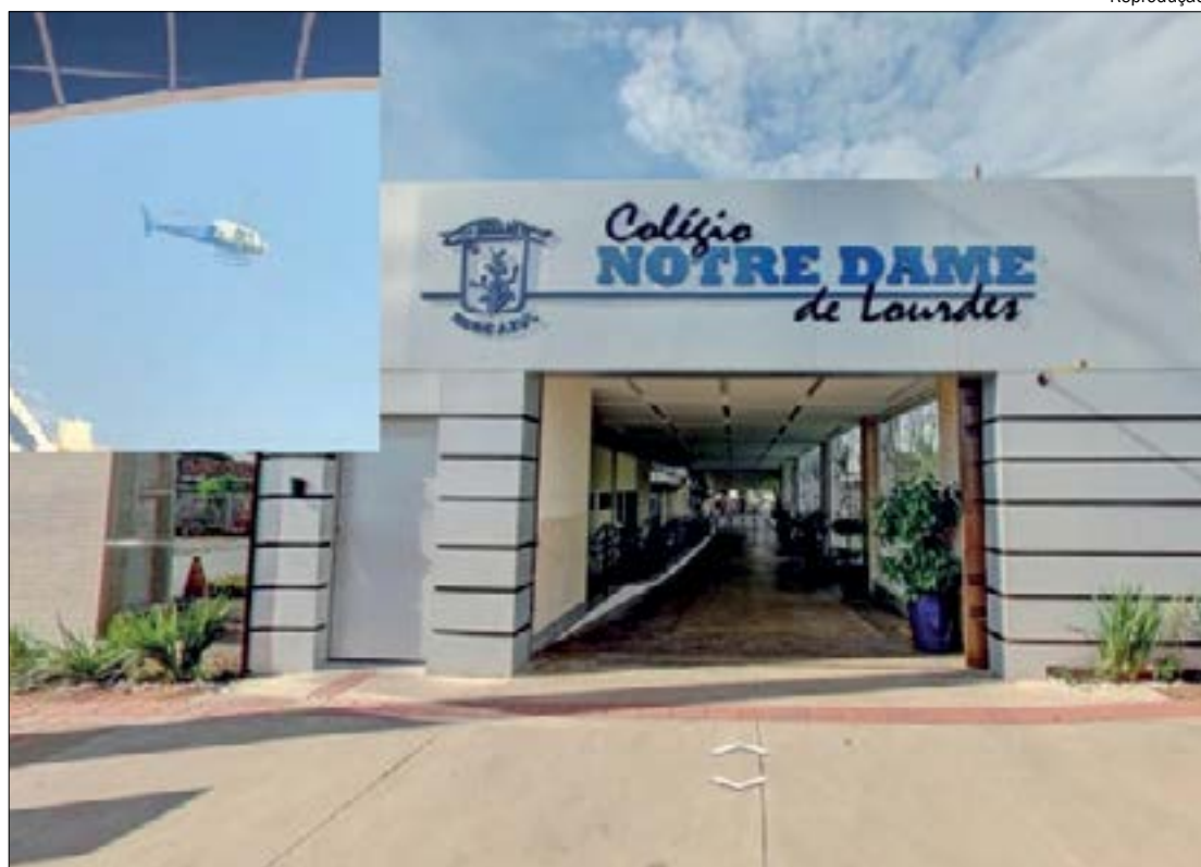
'Sobrevoos patrióticos' repercutiu nacionalmente devido à suspeita de uso político da PM

O artigo 5º da Constituição Federal garante a liberdade de expressão e é citado por pessoas contrárias a projetos que abordem o tema "Escola sem Partido", cujo conteúdo proíbe esses profissionais de abordar temas políticos.