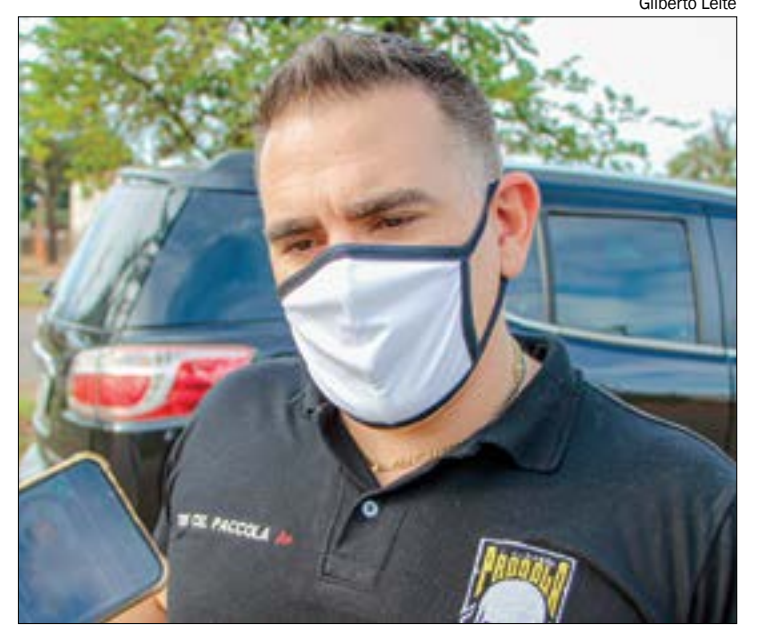
Presidente do Cidadania diz que partido não tem espaço para quem defende ideais antidemocráticos

“Defendemos a democracia e as instituições republicanas, as liberdades individuais, a diversidade, o combate à desigualdade social, a economia de mercado, o direito à propriedade, o agro moderno que produz e protege o meio-ambiente, a sustentabilidade. Sua defesa, vereador, de um governante e de um regime que contrariam os princípios do Cidadania é um sinal de que está no partido errado”, destacou.