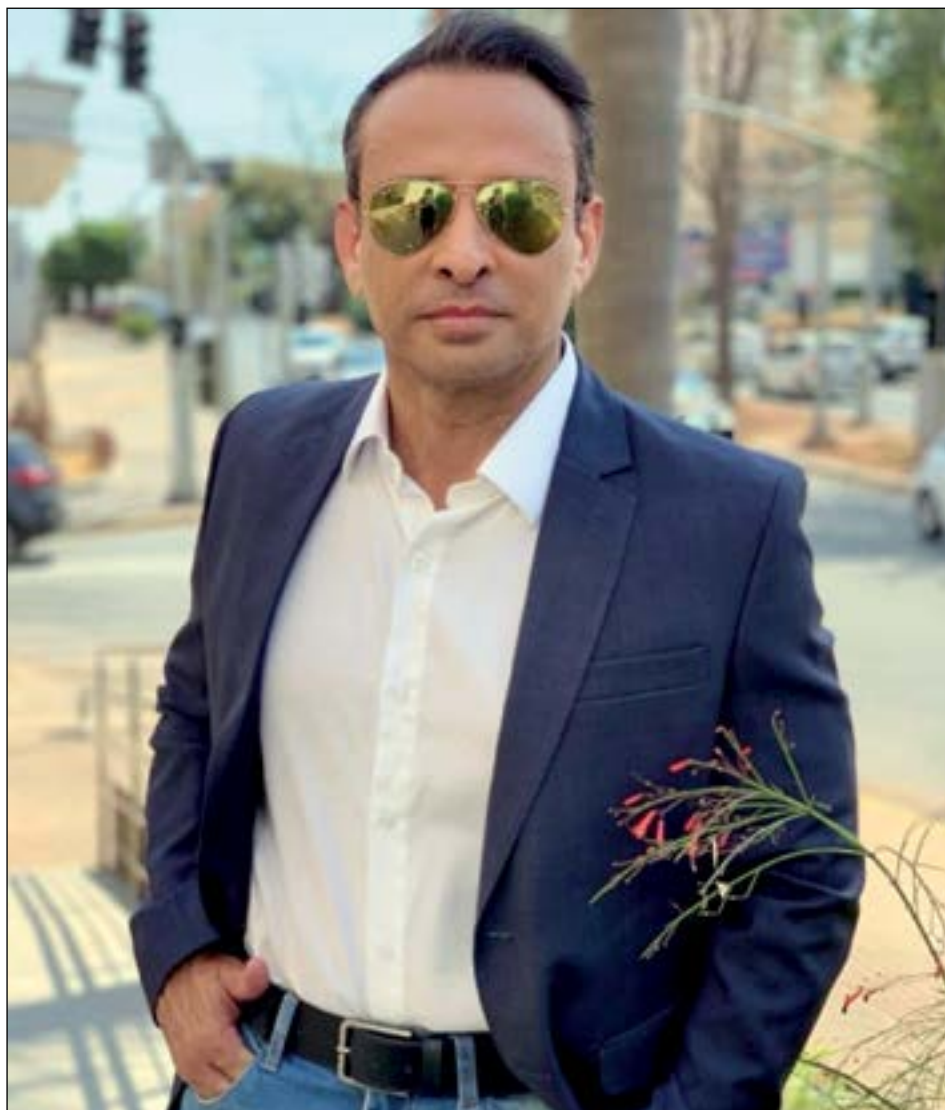
O respeitado cirurgião plástico Olyntho Gonçalves