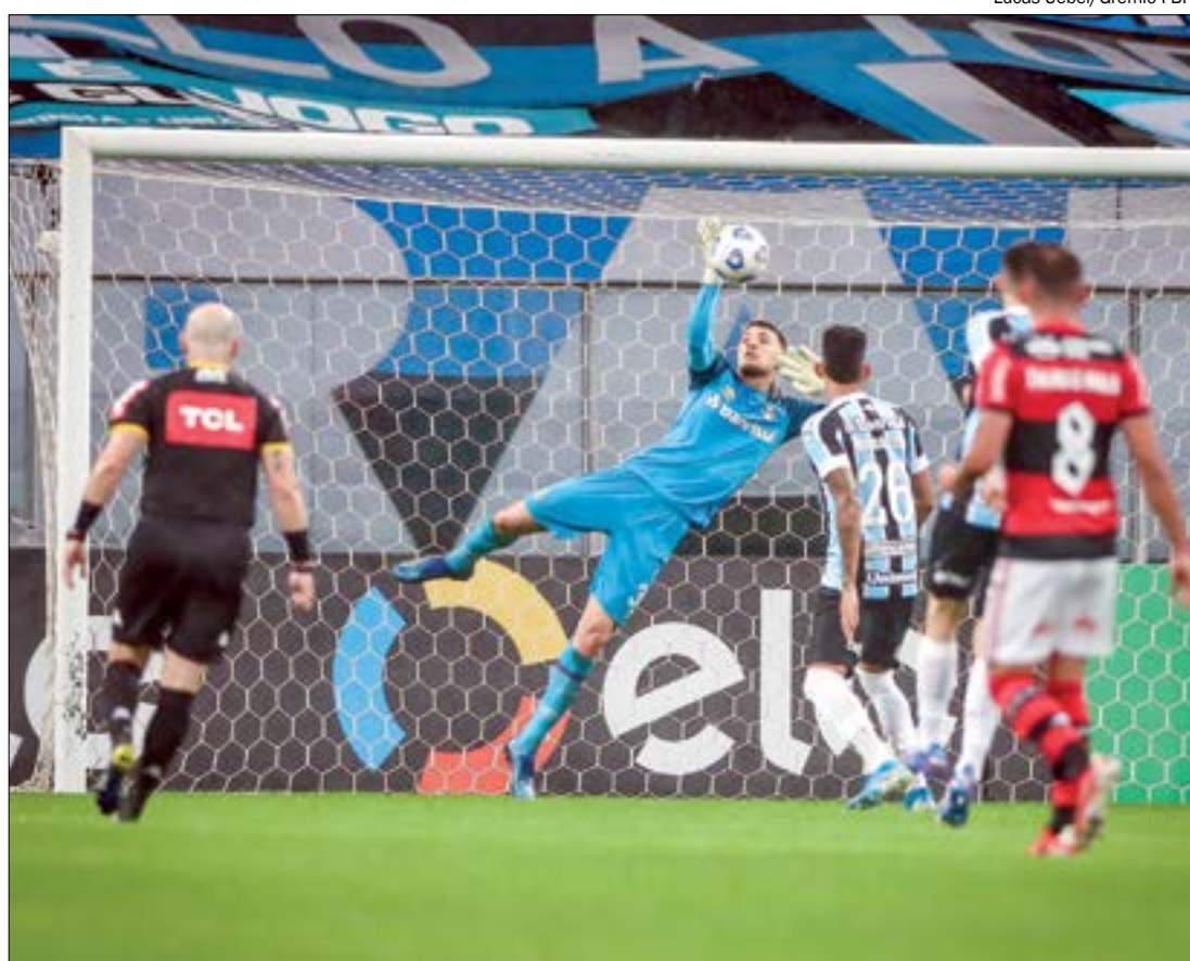
Grêmio ficou abalado com a derrota avassaladora, em uma partida em que tinha a vantagem numérica e de campo