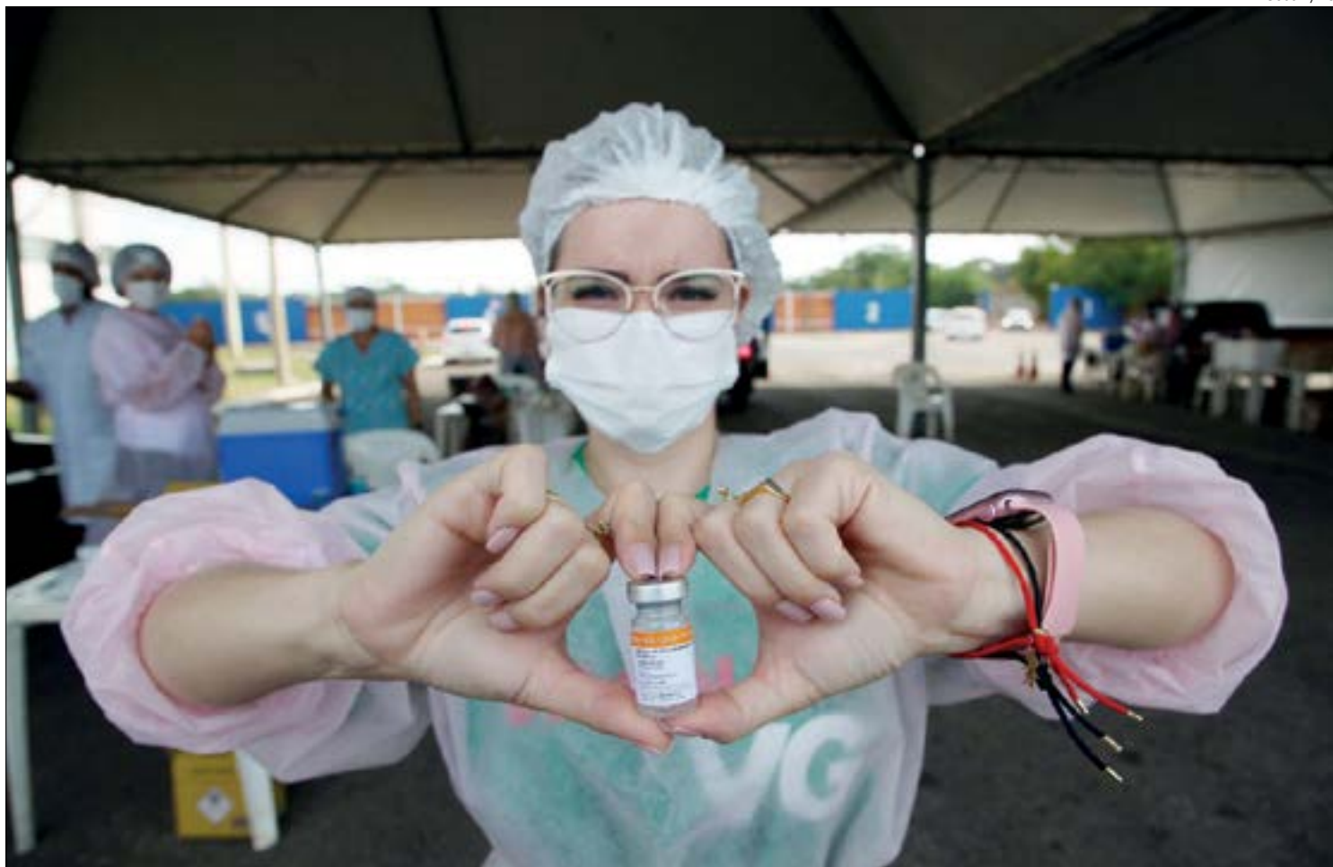
Vacinação de jovens a partir de 12 anos ainda depende de aval do Ministério da Saúde