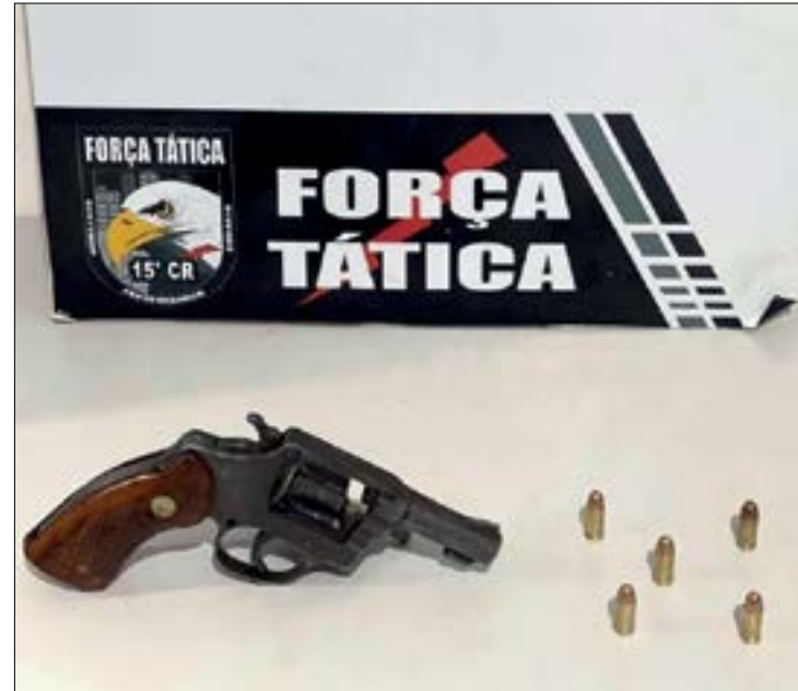
Com o criminoso morto foi encontrado uma arma calibre 32 e munições