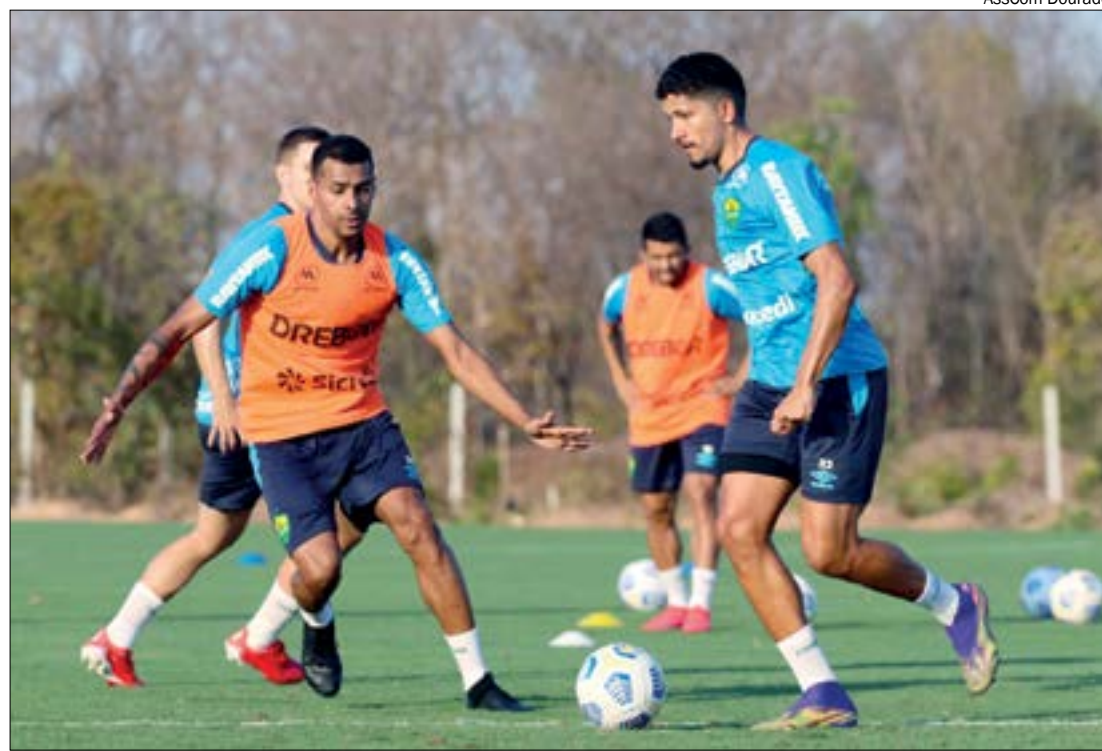
Cuiabá fez um treino intenso nesta sexta-feira (20), antes de viajar para São Paulo, onde enfrentará o Palmeiras

VERDÃO – Vivendo um ótimo momento na tem-