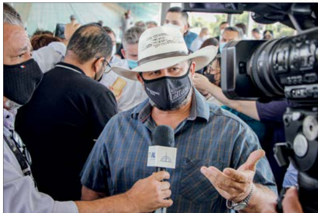
Cattani garante que já tem apoio suficiente e CPI deve ser criada na próxima semana

Cattani evitou empurrar a responsabilidade para algum elo específico da cadeia de suprimento do gás. Ele falou que pode ser uma questão da iniciativa privada, que estaria praticando um lucro exorbitante, ou do próprio aparelho estatal, por meio da tributação. "Pode ter atravessador da iniciativa privada, como também pode ser estatal. Por isso a necessidade de uma CPI, nós temos que descobrir isso aí".