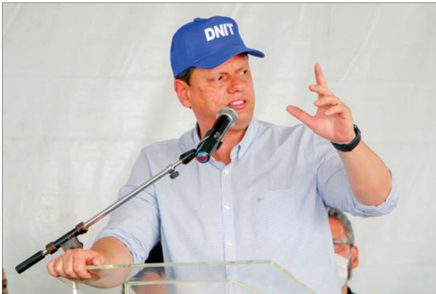
Segundo Tarcísio, troca no comando da Rota do Oeste deve liberar imediatamente os novos investimentos na rodovia

"Nós estamos chegando no final dessa trajetória.