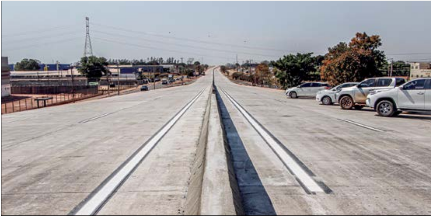
Após oito anos, Governo Federal conclui duplicação de 168 quilômetros da rodovia Cuiabá-Rondonópolis