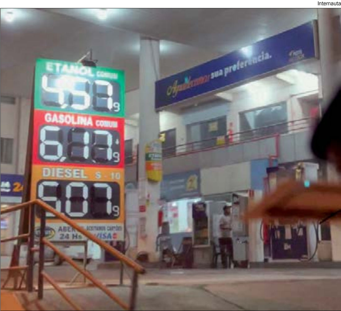
Postos de Cuiabá já estão vendendo o etanol a R$ 4,57 por litro e há relatos de preços maiores

“Os preços do etanol permanecem firmes e em