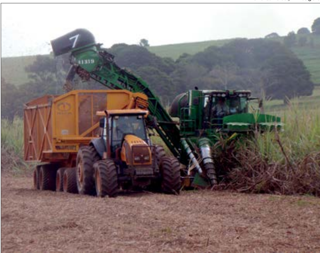
Combinação de seca e geadas causa perdas nas lavouras, comprometendo a matéria-prima das usinas de etanol

“Esses números mostram que empresas estão priorizando a produção de etanol anidro para atendimento do nível atual de mistura do biocombustível na gasolina”, explica Rodrigues.