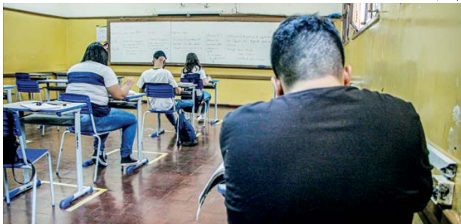
A Seduc alega que a infecção não ocorreu nas escolas, pois servidores e estudantes estavam de férias