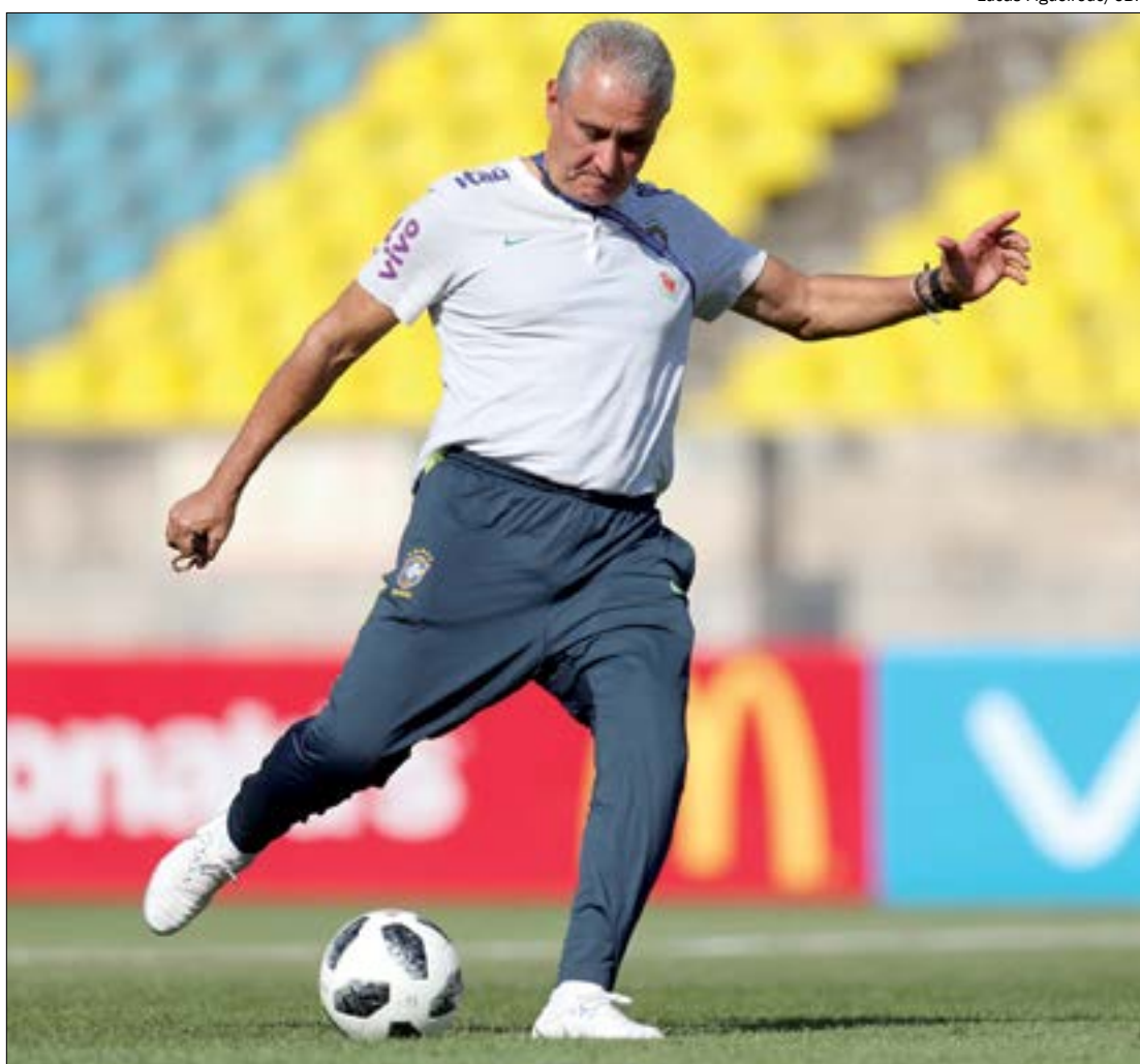
Tite teve tempo de sobra para analisar atuação da seleção olímpica e deve incorporar algumas das escolas de Jardine