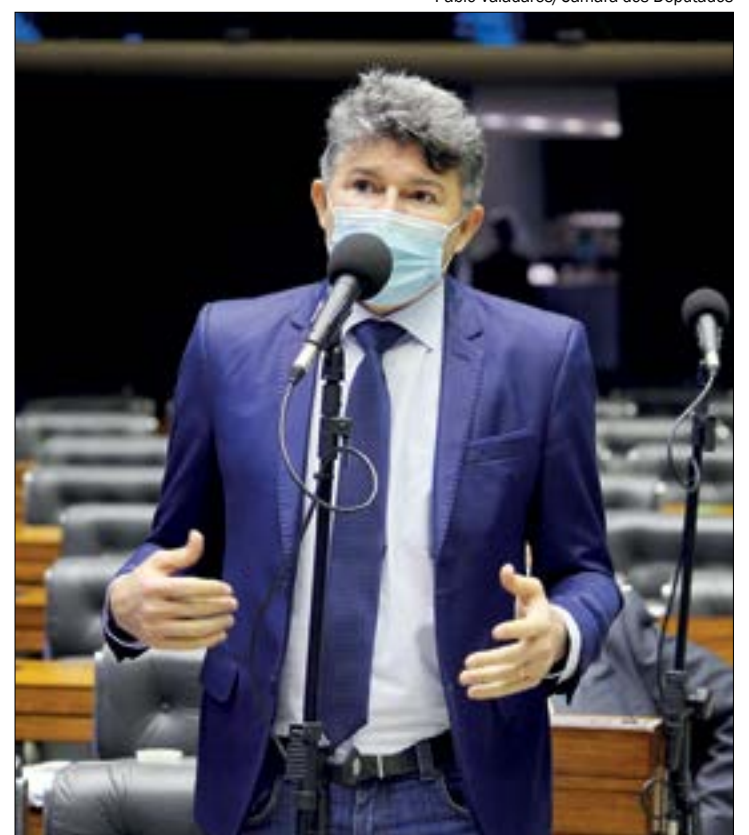
Pablo Valadares/Câmara dos Deputados

IRONIA - O parecer do MP aponta a possível fraude em um boletim que é impresso pela urna eletrônica para auditoragem da votação. Curiosamente, o deputado usou esse documento para defender a impressão de um comprovante de voto, justamente o que pode ter sido fraudado na eleição do Hospital Militar.