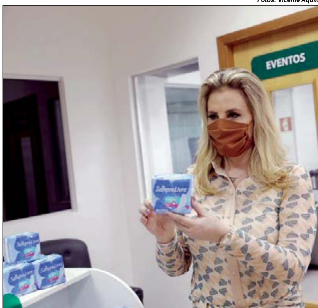
A primeira-dama da capital busca quebrar tabu da pobreza menstrual com a campanha "Cuiabá Por Elas"