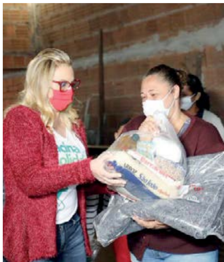
A primeira-dama, intensifica doações de cobertores para pessoas em situação de vulnerabilidade social