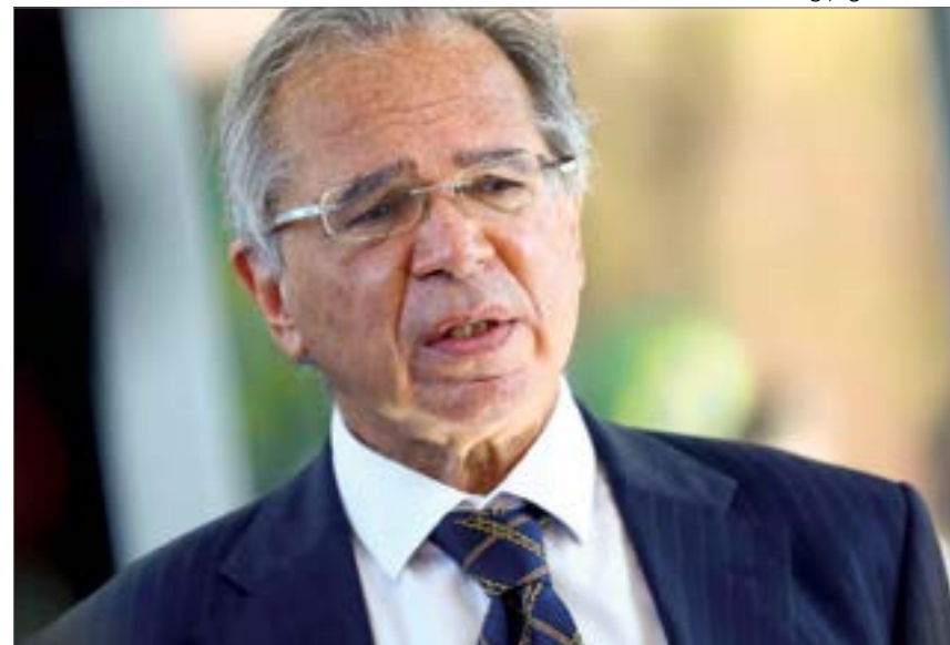
Guedes explica que projeto prevê pagamento integral e instantâneo de dívidas até R$ 66 milhões