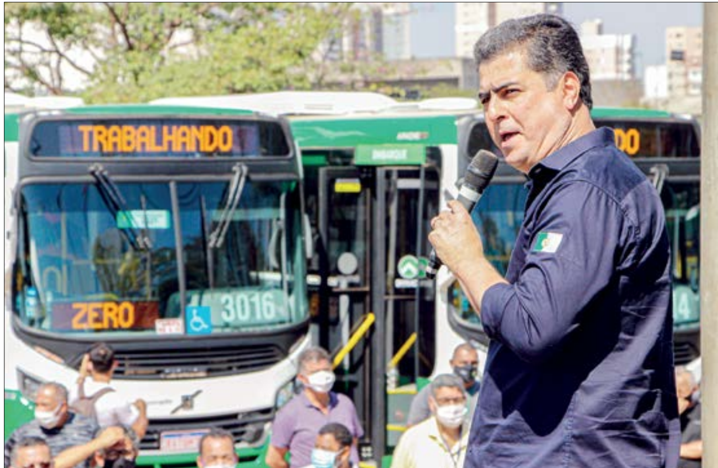
Com as novas entregas, Cuiabá passa a ser uma das poucas capitais com mais de 60% da frota climatizada