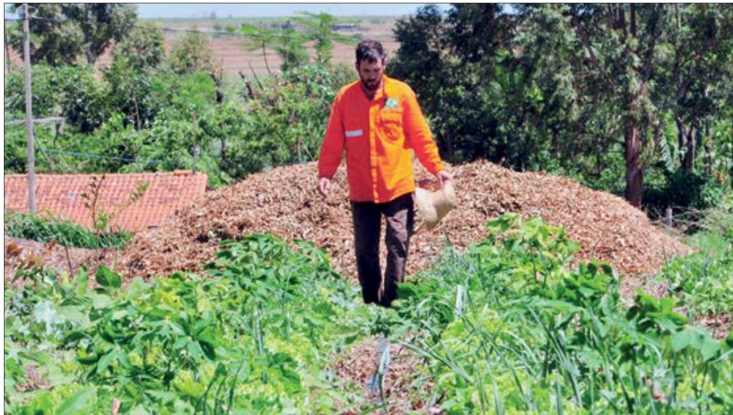
Produtores contabilizam perdas com o frio extremo que assolou o Brasil nos últimos dois meses