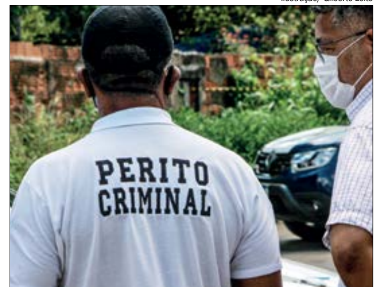
O funcionário tentou fechar a porta para impedir que os ladrões entrassem no quarto e acabou levando dois tiros