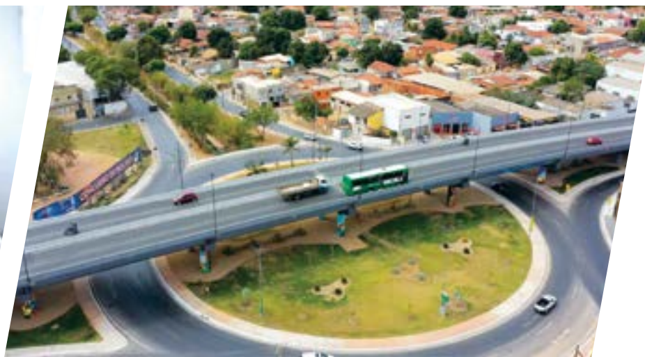
Faixas exclusivas de ônibus e dois novos viadutos.