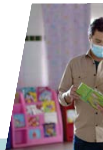
Centro de Cuiabano,