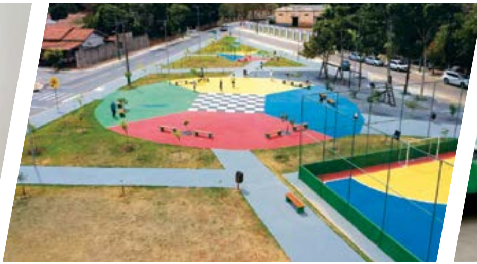
Mais de 100 praças novas e reformadas.