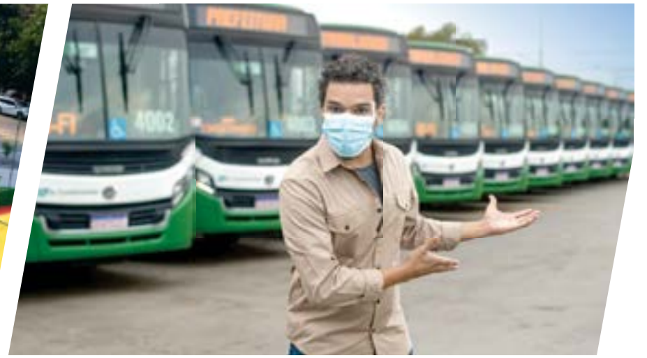
Mais de 140 ônibus novinhos, com wi-fi e ar-condicionado.