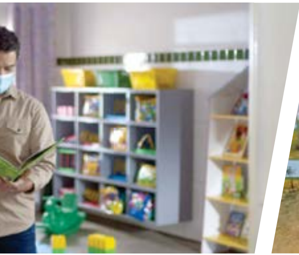
Educação Infantil o CEIC.