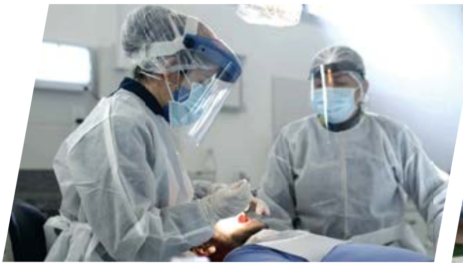
Novas unidades de saúde com hora estendida.