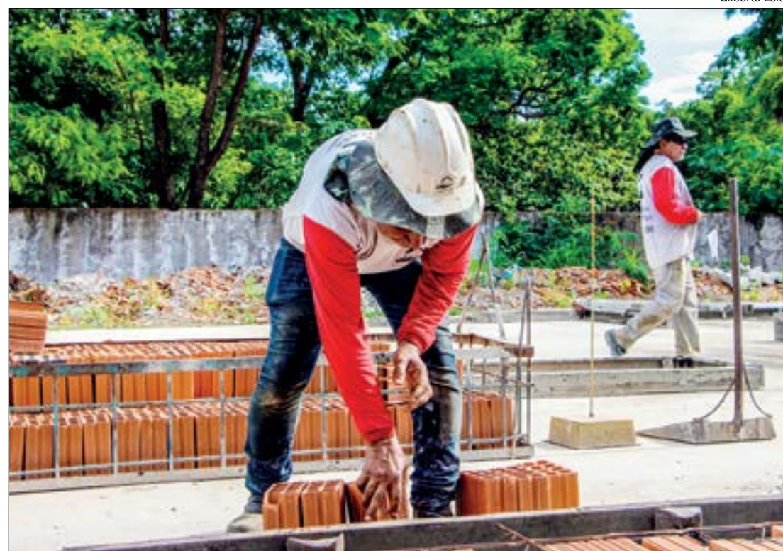
No acumulado de 2021, o saldo positivo é de 1,5 milhão de novos trabalhadores no mercado formal

Segundo ele, o foco será a geração de oportunidades de trabalho aos jovens e formalização de cerca de 38 milhões de trabalhadores informais que hoje recebem o auxílio emergencial do governo. Em breve, ainda de acordo com Guedes, serão lançados novos programas, como o serviço social voluntário e os bônus de inclusão produtiva (BIP