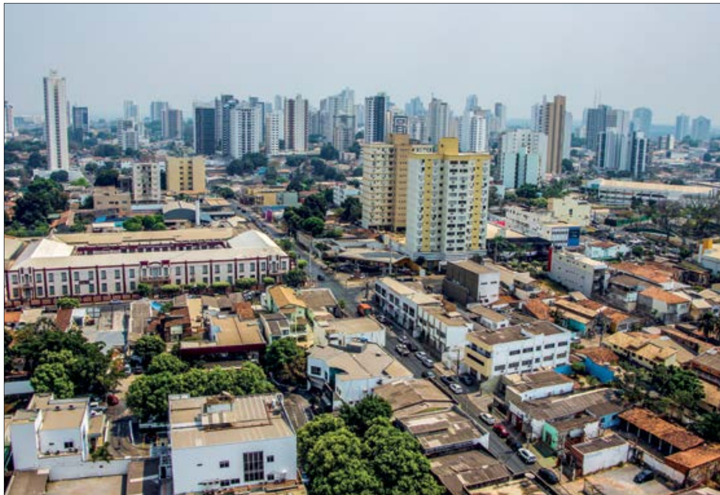
Segundo o relatório do 2º trimestre, a quantidade de imóveis usados vendidos chegou a 2.563, contra 347 novos

No novo relatório de desempenho do mercado imobiliário em Cuiabá, os valores transacionados passaram de R$ 1,08 bilhão